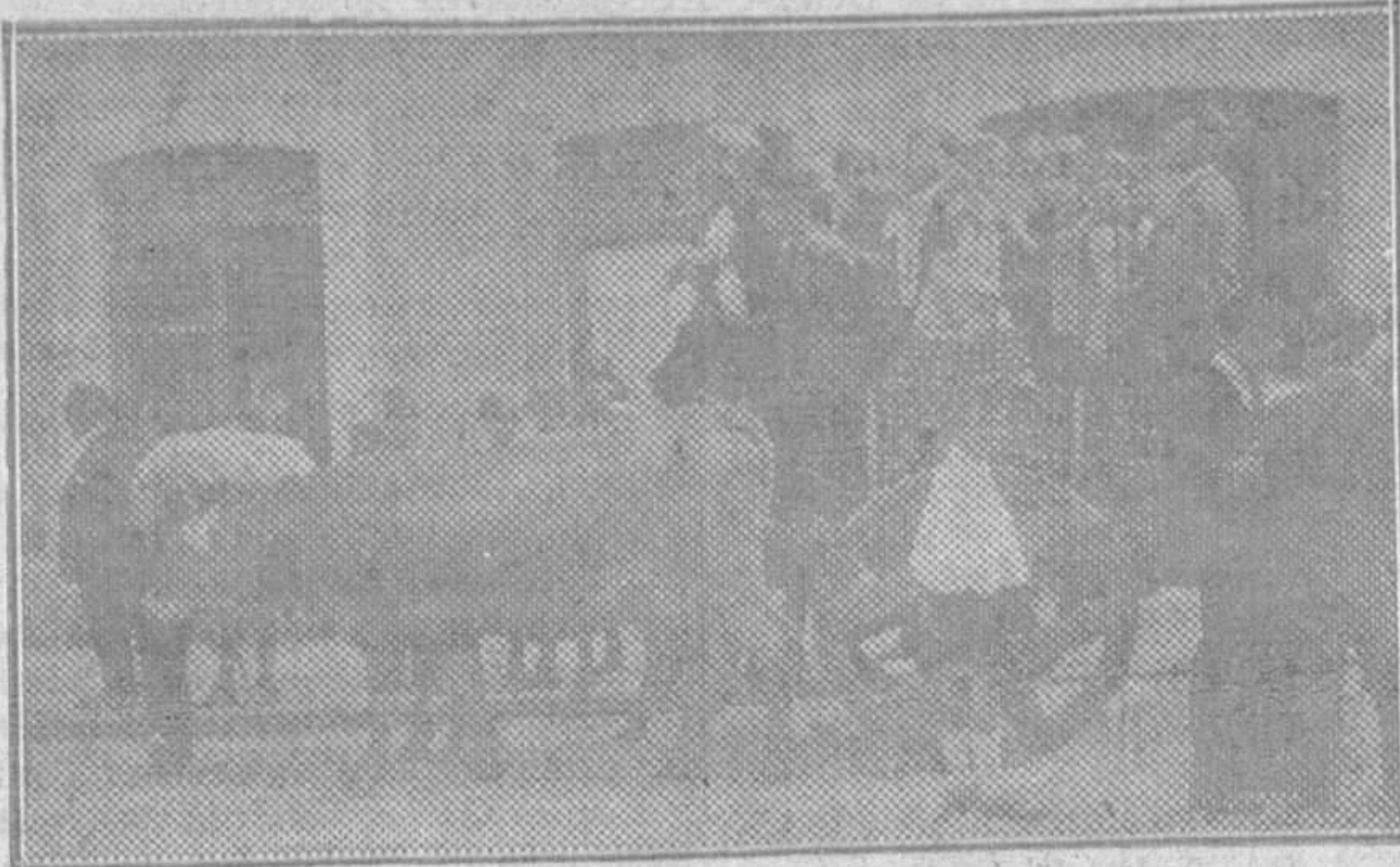
FIESTAS DE SAN ROQUE EN LLANES.—Grupo de bellísimas señoritas del bando en el momento de trasladarse al campo del «Brao» en típico carruaje asturiano

VISITAD EN GIJÓN EL Restaurant "MERCEDES"