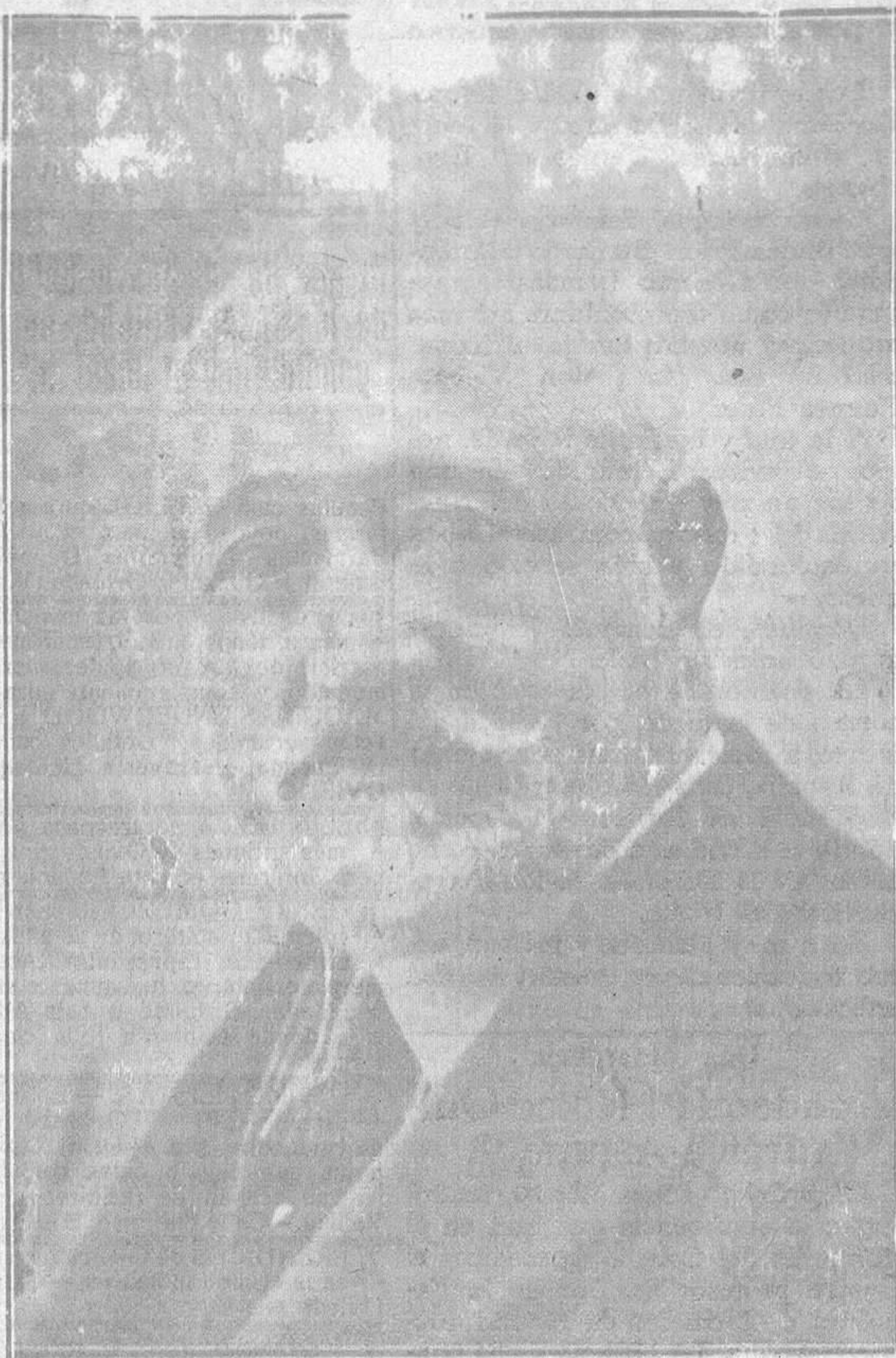
Excelentísimo Sr. D. Nicanor de las Alas Pumarino, presidente de la Diputación provincial y de la Feria de Muestras Asturiana y Exposición Agro-pecuaria

Gijón, al celebrar su V Feria de Muestras Asturiana y Exposición Agro-Pecuaria, trata con esta demostración de sus industrias y de su riqueza agrícola y ganadera de la región, expuestas en su recinto, de estimular a todos los asturianos a seguir trabajando con entusiasmo para lograr que Asturias figure y ocupe el puesto que le corresponde entre las demás regiones españolas, a lo que todos los asturianos estamos obligados, y con esto dar la merecida satisfac-