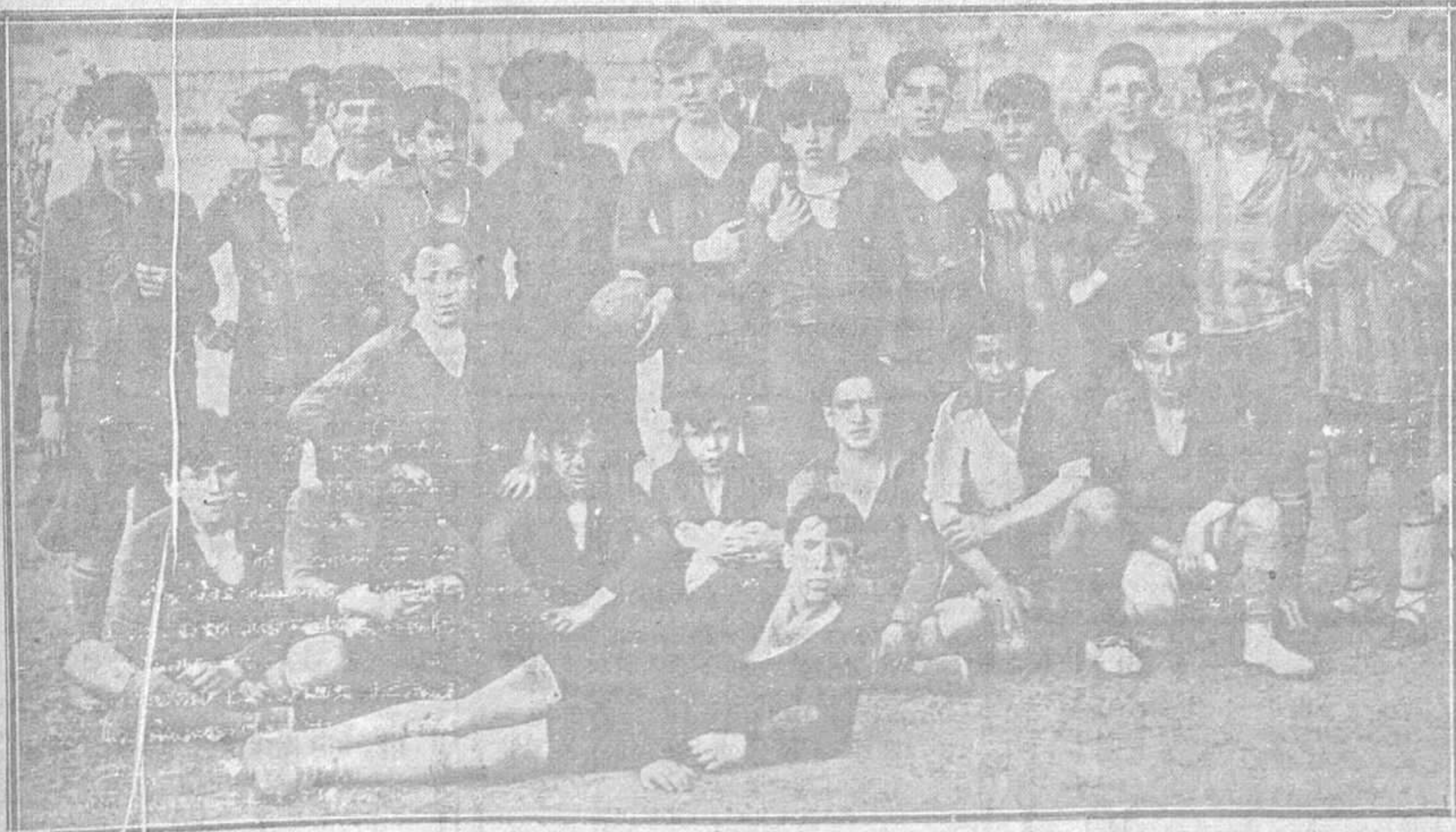
EL CAMPEONATO DE «LA VOZ DE ASTURIAS».—Los equipos del «Relámpago» y del «Betis», que lucharon el domingo en partido cuarto final, de tan interesantísimo torneo