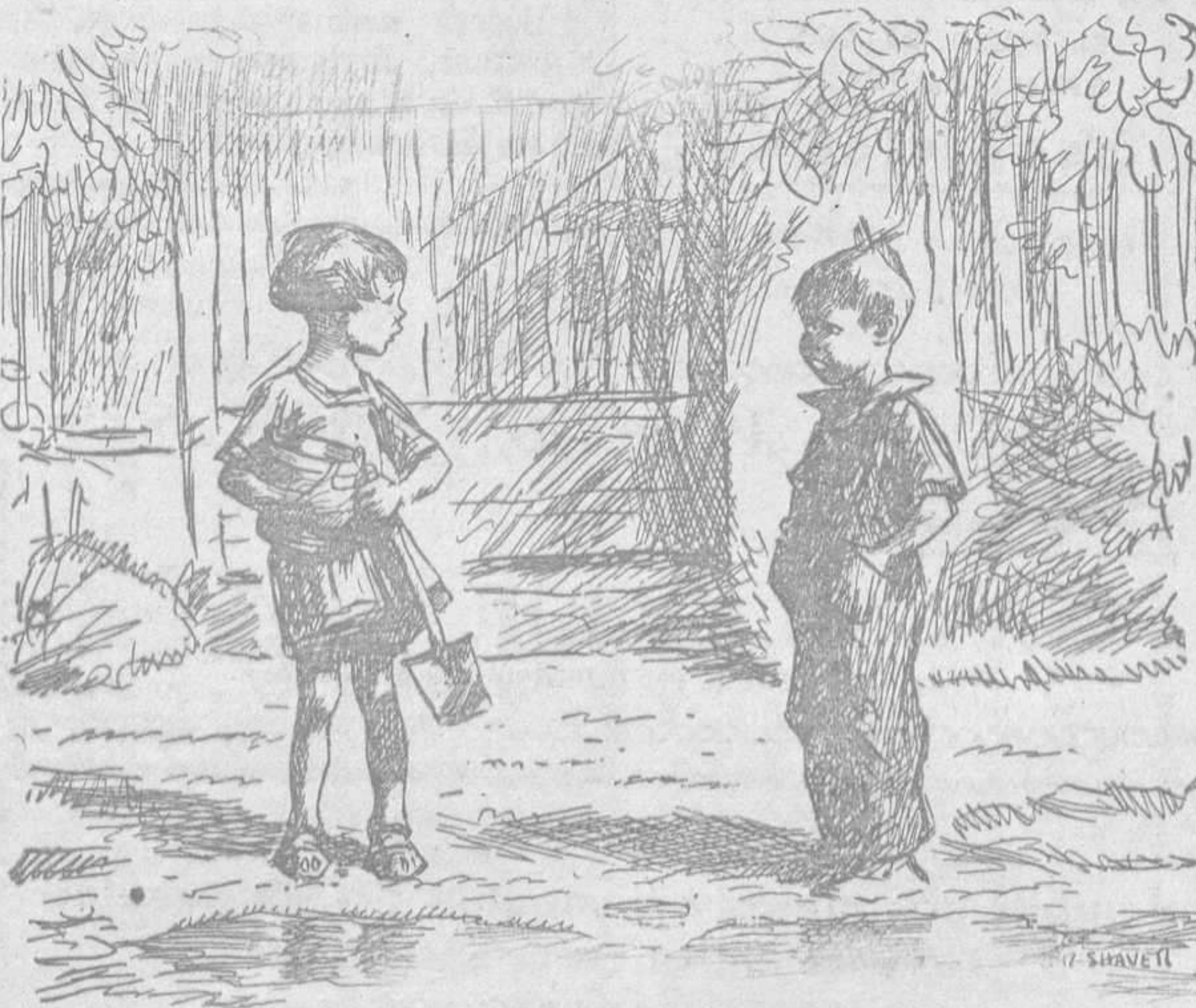
—Yo ya soy un hombre: llevo pantalón largo como papá. —¡Anda! Entonces mamá es una niña, porque lleva falda corta como yo.