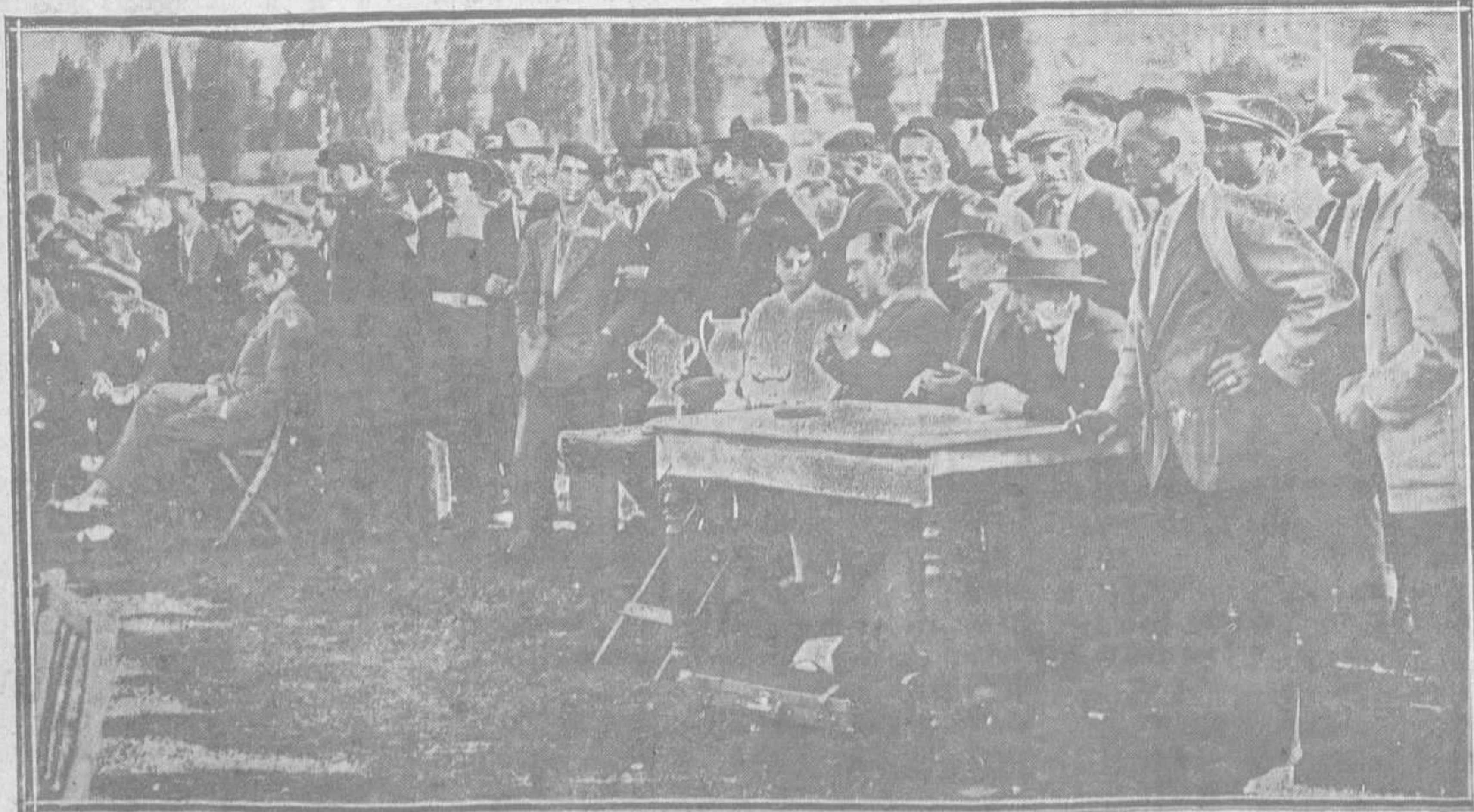
EN EL CAMPO DE RUBIN.—Un aspecto de las brillantísimas tiradas de Pichón que con tanto éxito vienen celebrándose en aquel lugar y a las que han concurrido las más notables escopetas.