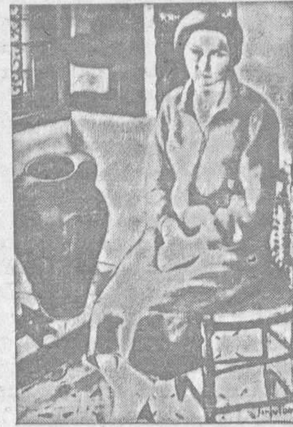
La muchacha y el cántaro