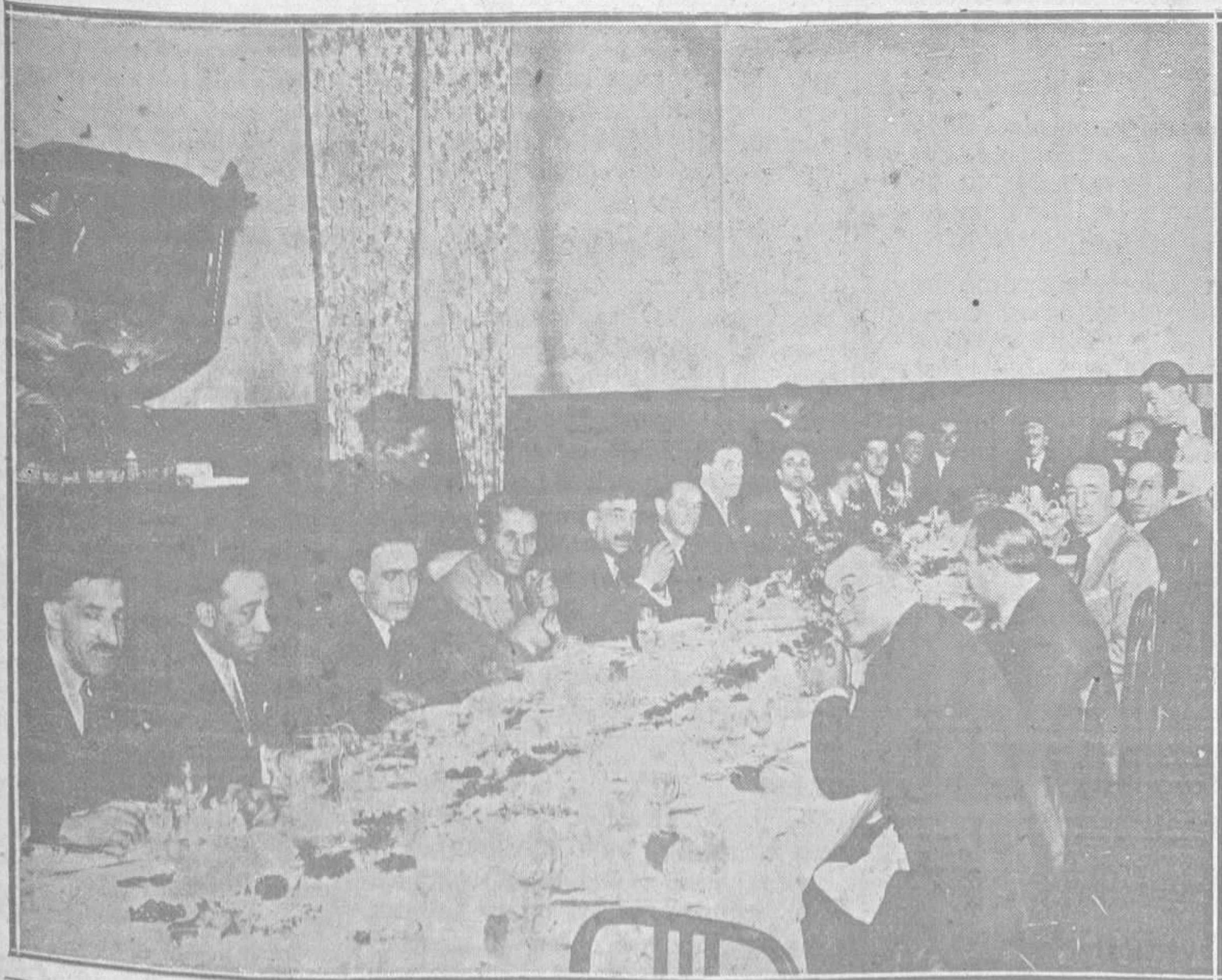
EN EL HOTEL FRANCES.—Los periodistas gijoneses y ovietenses asociados, que el domingo se reunieron en fraternal banquete con ocasión de concurrir los primeros a las fiestas de San Mateo