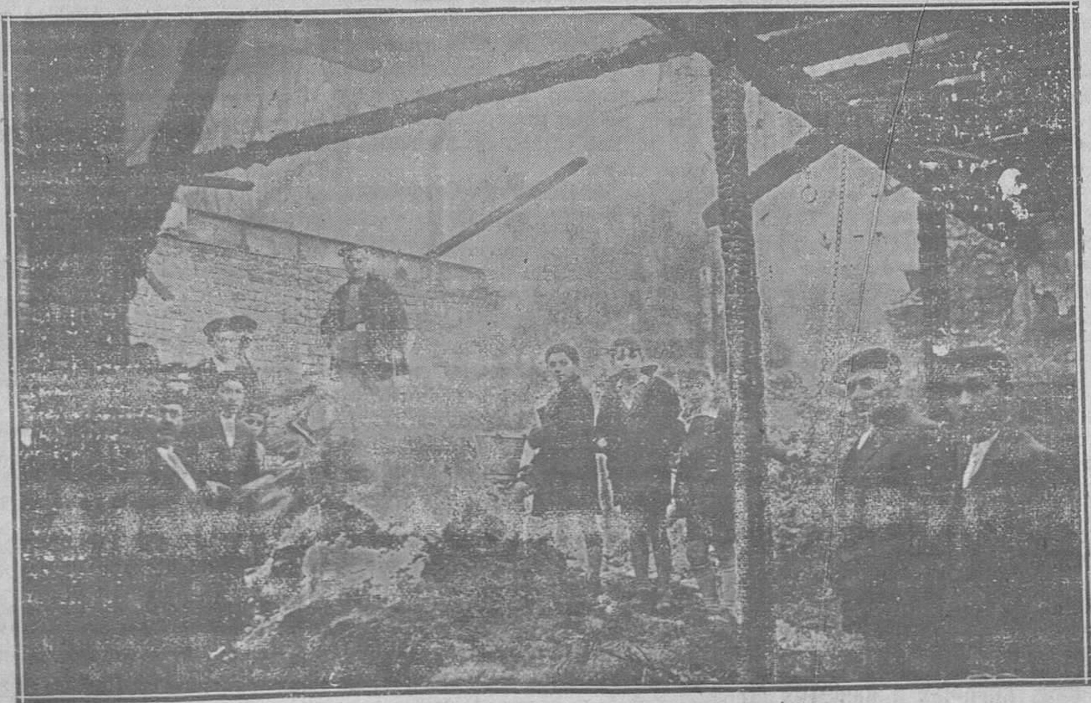
SAMA DE LANGREO.—Un detalle del incendio del pasado domingo

Se hacen Panteones, Lápidas, Altares, Estátuas y Adornos, Peldaños, Pilas y toda clase de mármoles para muebles y de construcción