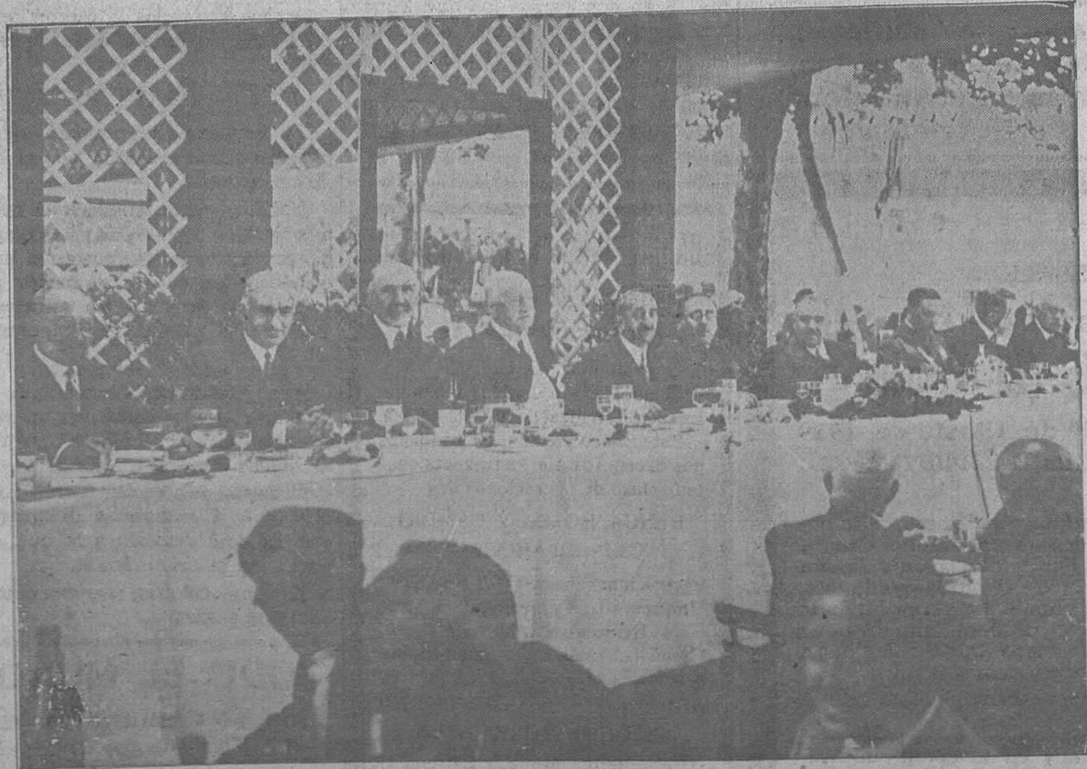
EN LA FERIA DE MUESTRAS.—Una parte de la presidencia del banquete en honor del ministro de Economía, señor Rodríguez de Viguri (x), que ha clausurado en nombre del Gobierno el Certamen regional.

Cantidades recaudadas en los templos de esta ciudad el día de la colecta. Suma anterior, 1.421,90. R. P. Santa Anna y Marías de los Sagrarios, 100. Parroquia de la Corte (segunda vez), 101,50. Cristo de las Cadenas, 15. Total en Oviedo, 1.638,40. Faltan todavía algunos datos.