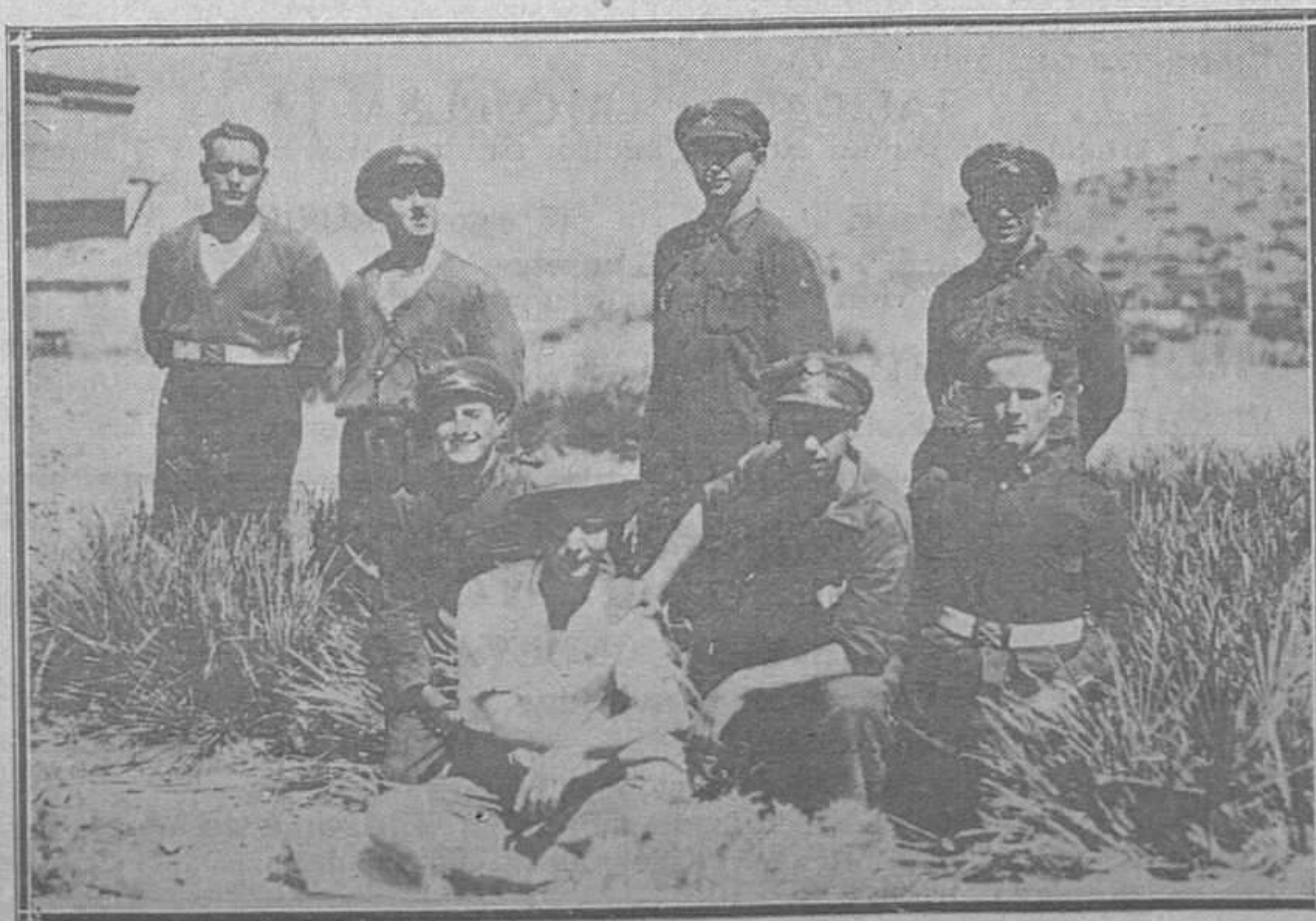
EN MARRUECOS. — Grupo de soldados asturianos que prestan sus servicios en el Parque de Automóviles de Villa Sanjurjo