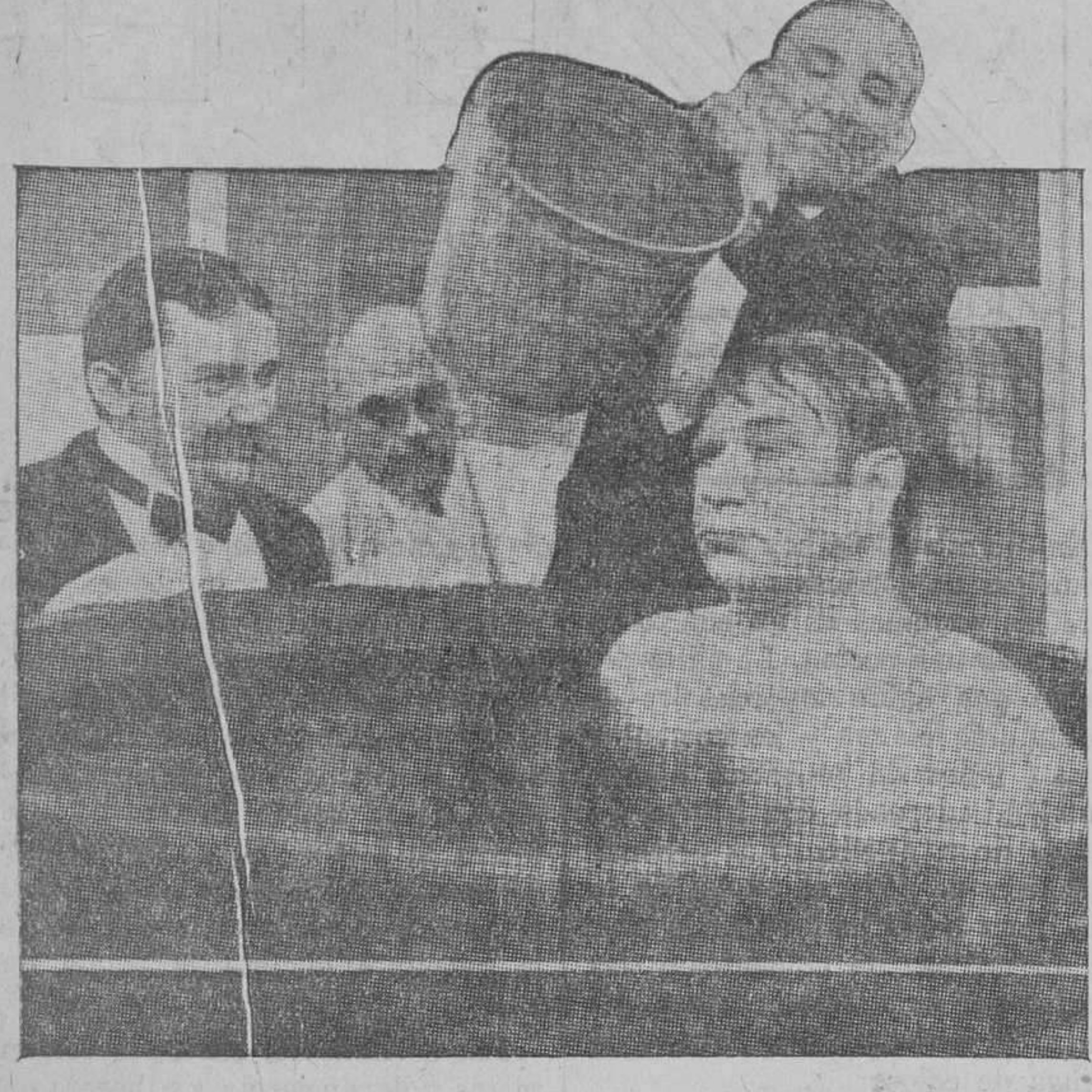
Una de las escenas de la película «Carné», de la Metro, próxima a estrenarse en el Capitol