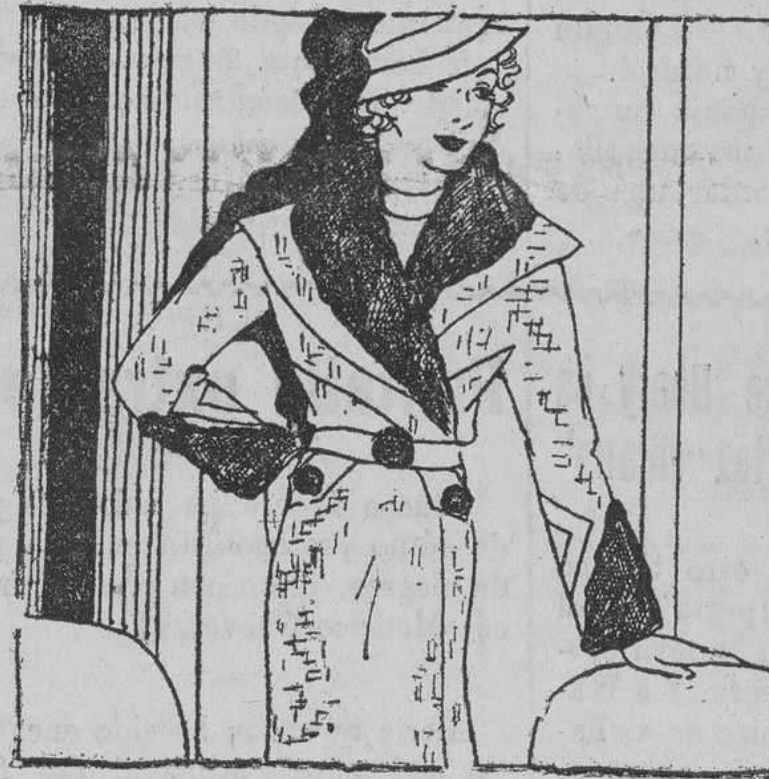
A la izquierda: Un elegante modelo de sobretodo confeccionado de paño liviano, con corte de olapa que baja hasta la cintura. Lleva adorno de piel en los puños y cuello de piel.—A la derecha: Traje de lana gris, adornado con astrakán negro en la blusa, en forma de almilla, y mangas en un solo corte. El gracioso sombrerito que lo complementa es de fieltro negro, y uno de los últimos estilos, de bordes drapeados y copa alta y plegada. Lleva por adorno una pequeña pluma.

ción, removiéndolas constantemente con la ayuda de una espátula. Esta compota se sirve en frío y, por separado, un trozo de crema fresca y bizcochos secos.