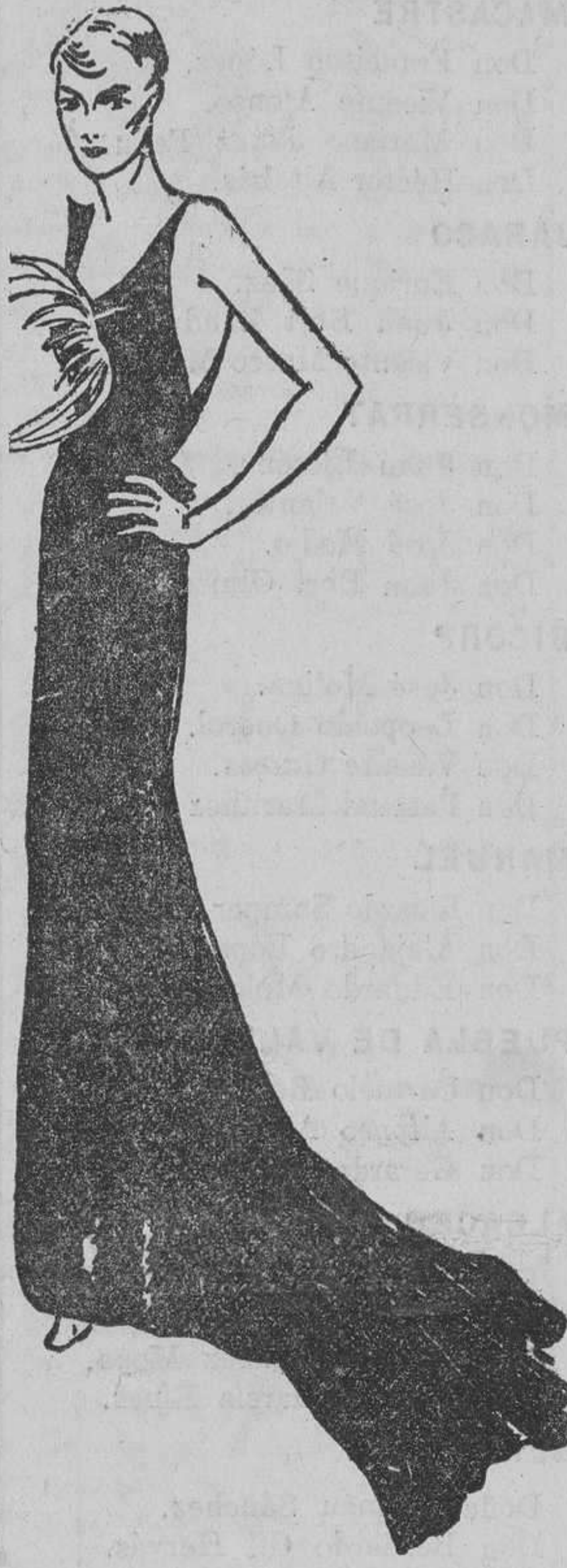
El modelo perfecto de la elegancia, en trajes para comida, es un vestido de chifón negro, de corte liso y sencillo en la parte de delante, y que termina en cola opulenta. La creadora de este modelo (Lelong) ha colocado sobre el pecho un penacho de plumas de ave del Paraíso, con lo cual hace resaltar aún más su sobria elegancia.

La moda del renard, que se lleva en todos colores, negro, azul, beige, ahumado, plateado, etc., ha traído nuevamente la del manguito, que se lleva a toda hora del día o de la noche, y que da a la