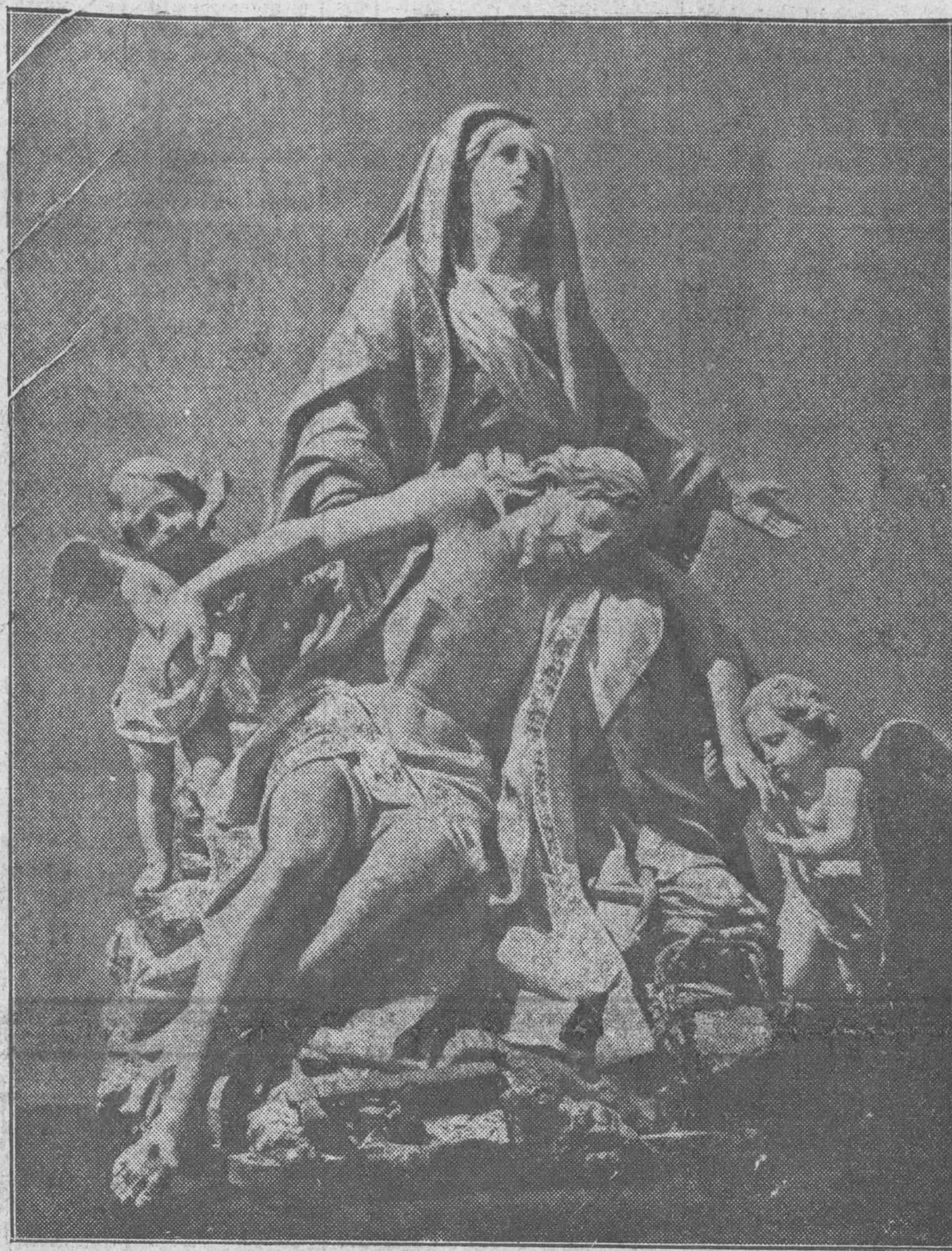
LA VIRGEN DE LAS ANGIUSTIAS

Como habíamos anunciado, anoche se celebró el grandioso desfile de todas las Hermandades, y Corporaciones con motivo de la visita a los monumentos, acto que resultó sencillamente soberbio por el