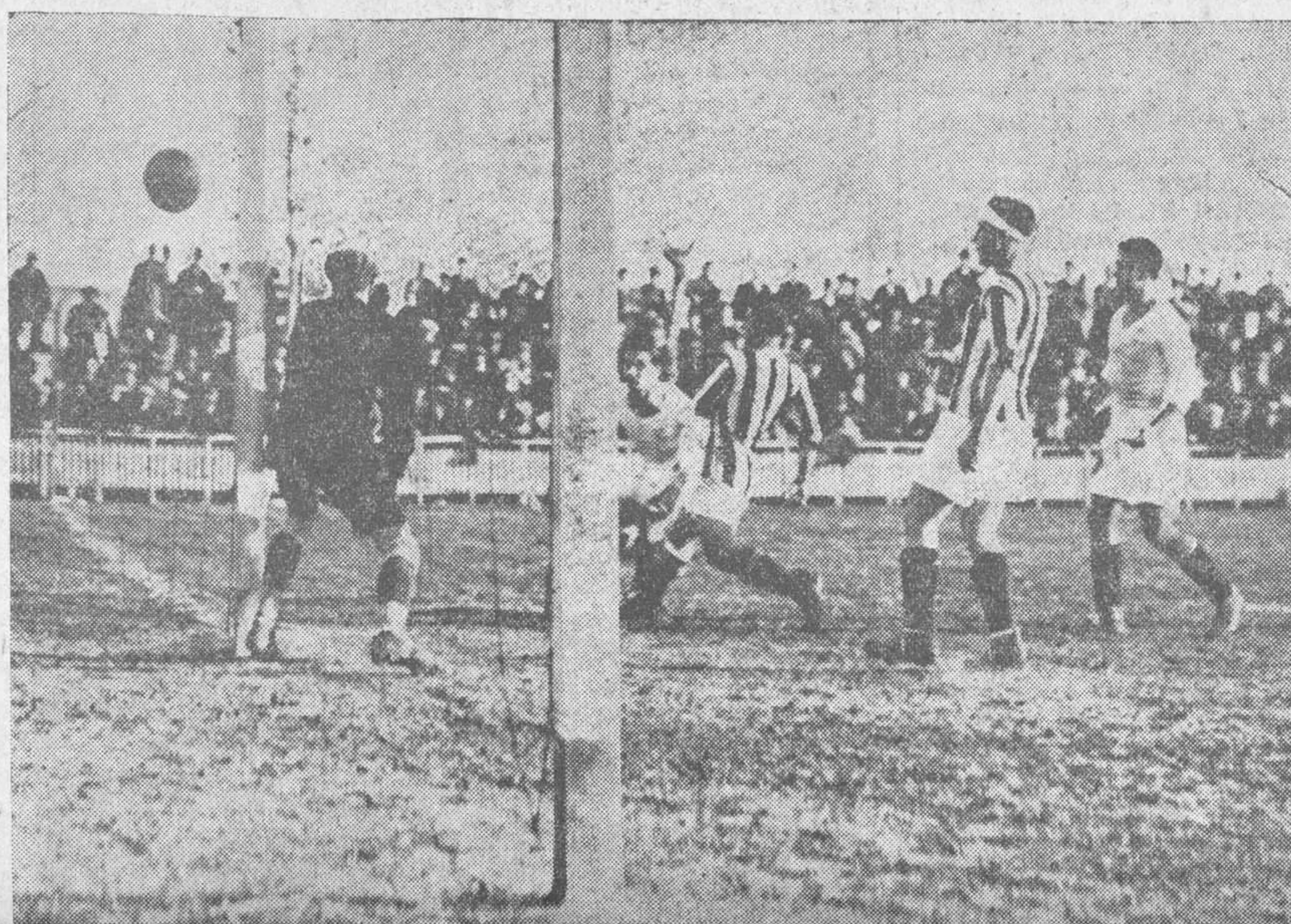
El tercer goal del Sevilla marcado por Campanal