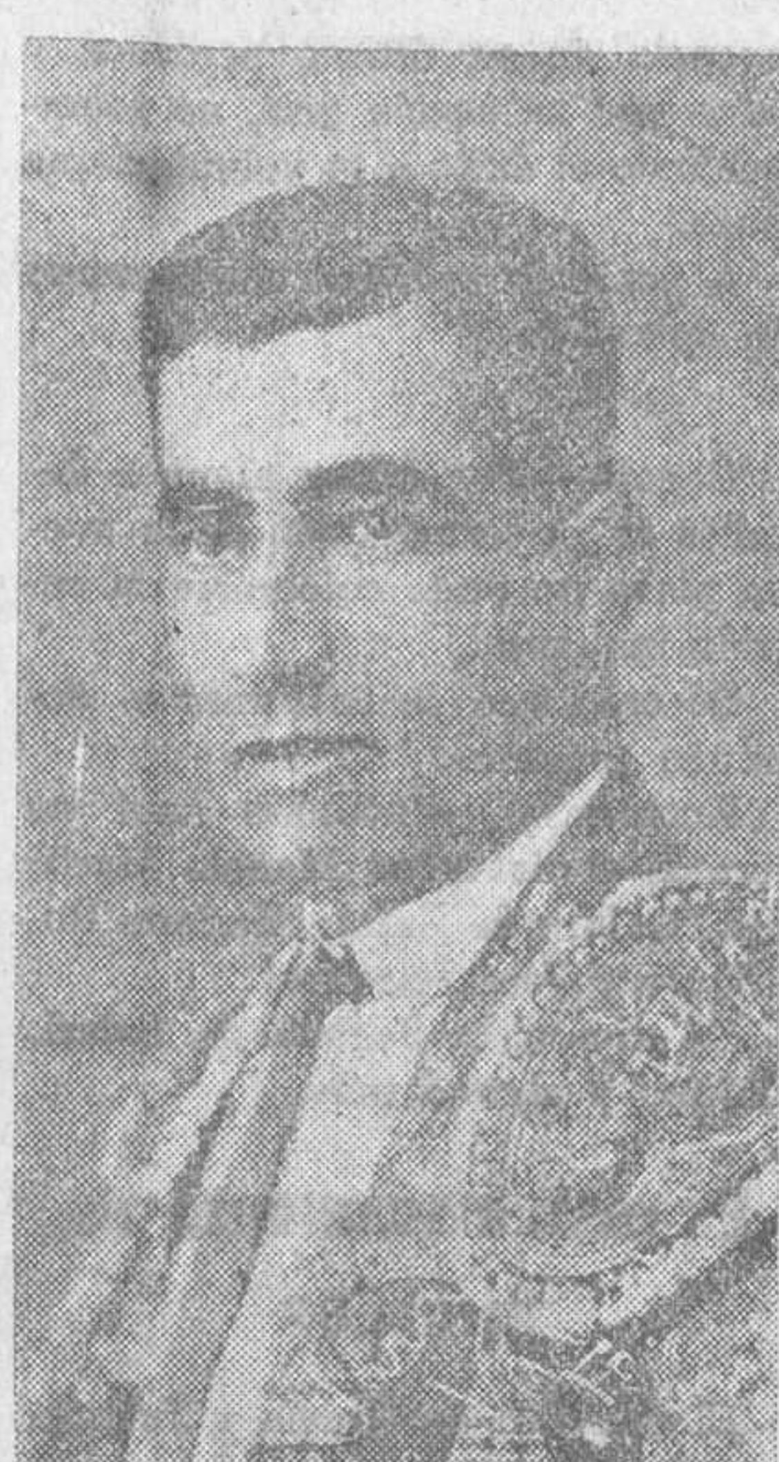
EL DIESTRO ALDEANO

—Desde muy niño tuve gran afición a los toros. Mis padres me lo impidieron siempre, y el respeto a ellos me privaba de exteriorizar mis deseos. Cuando murió mi padre decidí dar mis primeros pasos