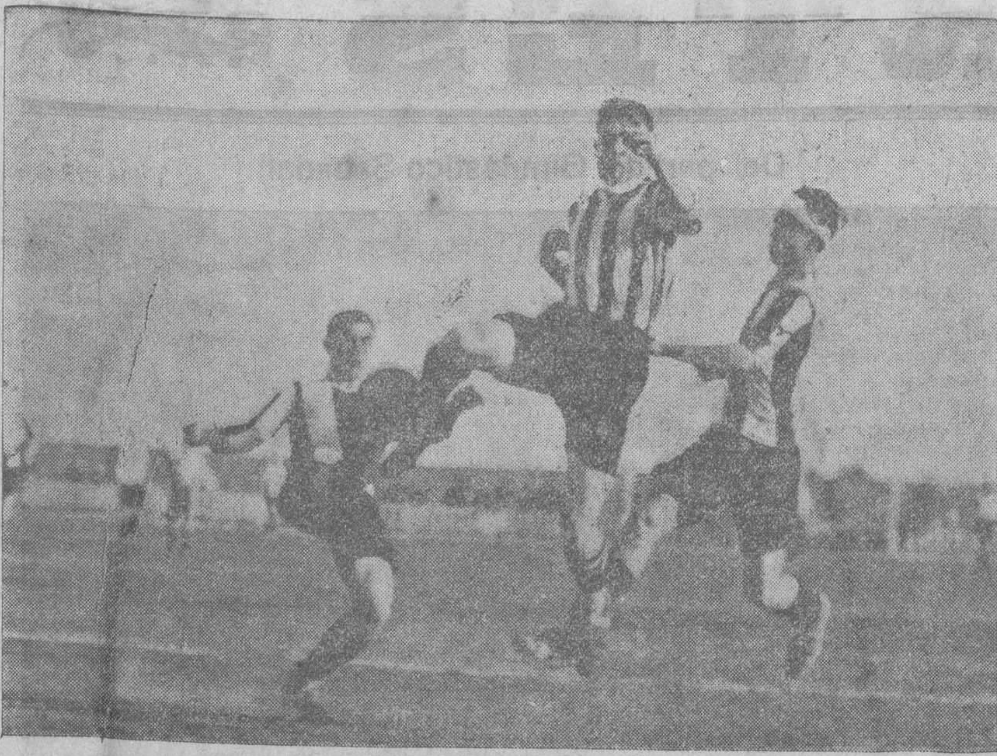
Un despeje de Alamar

sobre todo el segundo. Por los madrilenos, merecen destacarse Santos, Cuesta y Marín, y sobre todo el oportunismo de toda su delantera.