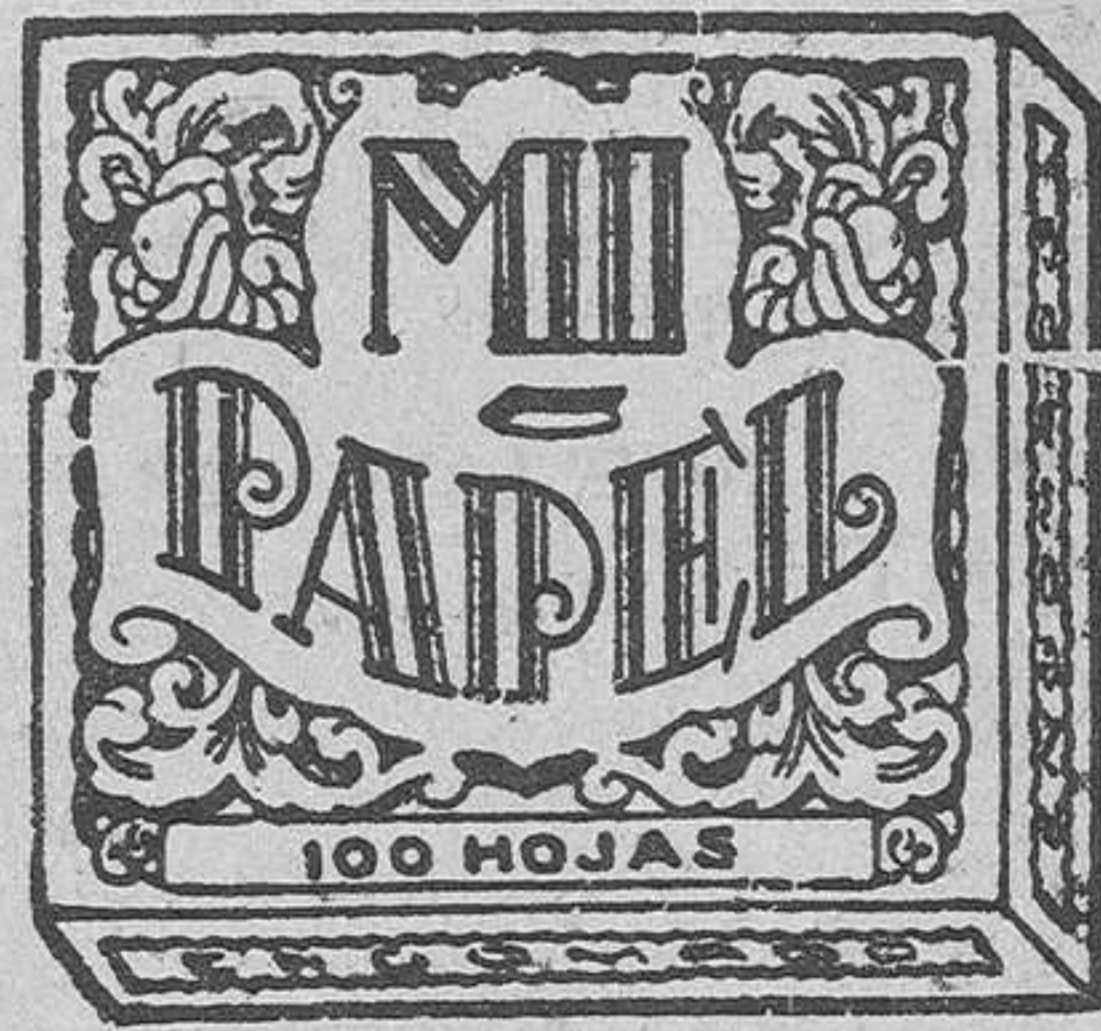
(MARCA DE FABRICA)

Casa matriz, Pelayo, núm. 62 (plaza Cataluña) Barcelona Teléfono 16,046