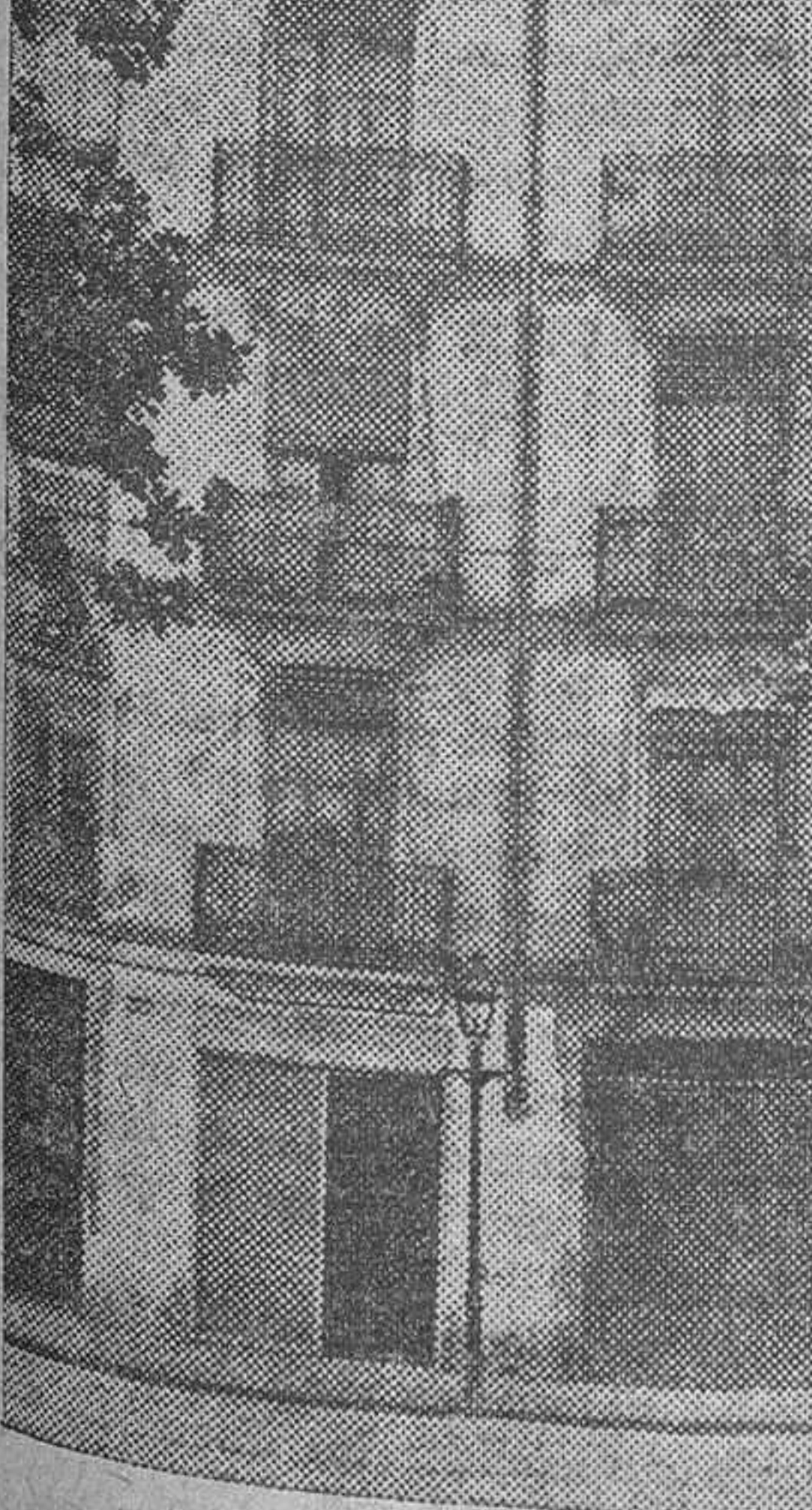
La casa de la Gran Vía, donde se cometió el crimen

A preguntas del presidente del tribunal dice tener 25 años, ser natural de Valencia y sastre de oficio. En sus mocedades fué procesado por hurto y cumplió la condena correspondiente.