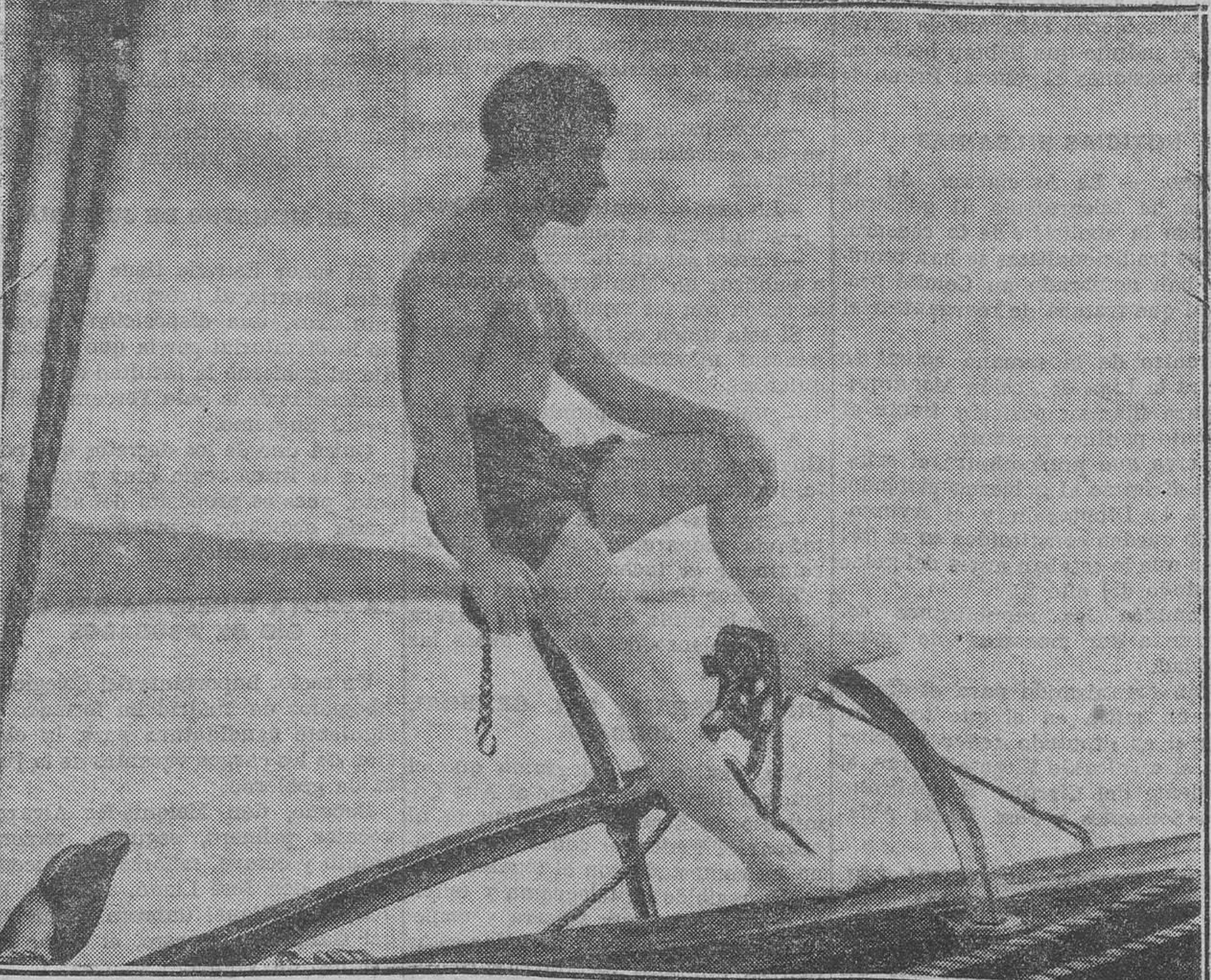
Por la primera vez vamos a oír la voz de Ramón Navarro, sabiendo, al fin, si tiene el mérito que le atribuyen como tenor o como barítono. La «Canción pagana» nos hará ver a este actor en papel de salvaje que rapta a una joven blanca; rapto que, como puede presumirse, acaba en casamiento.