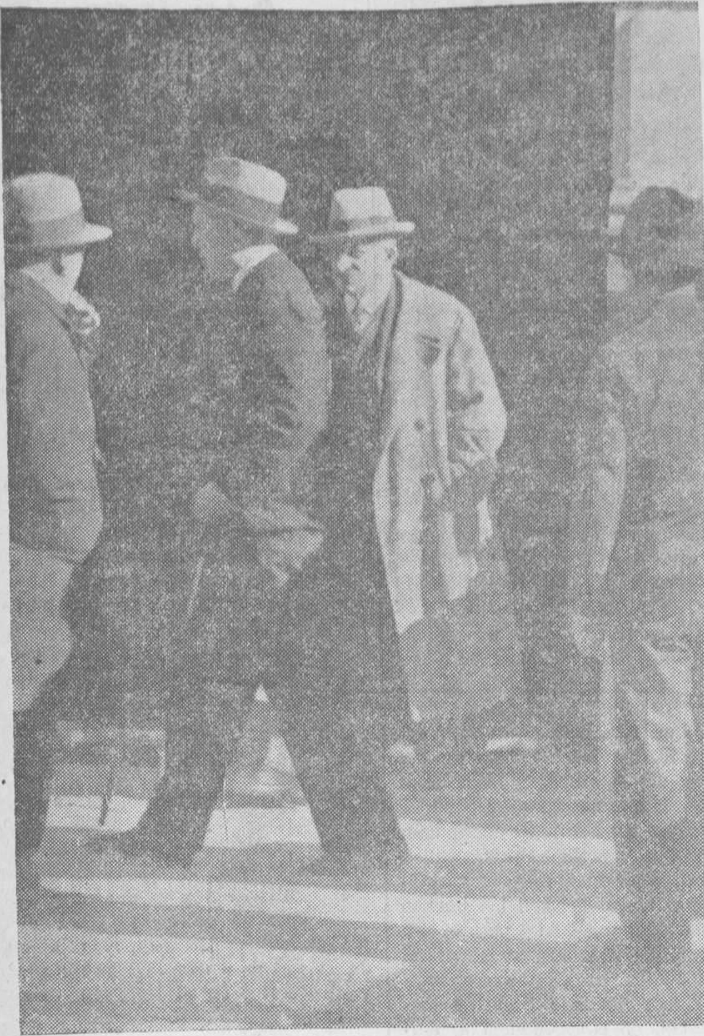
El conde de Romanones al llegar esta mañana a Valencia