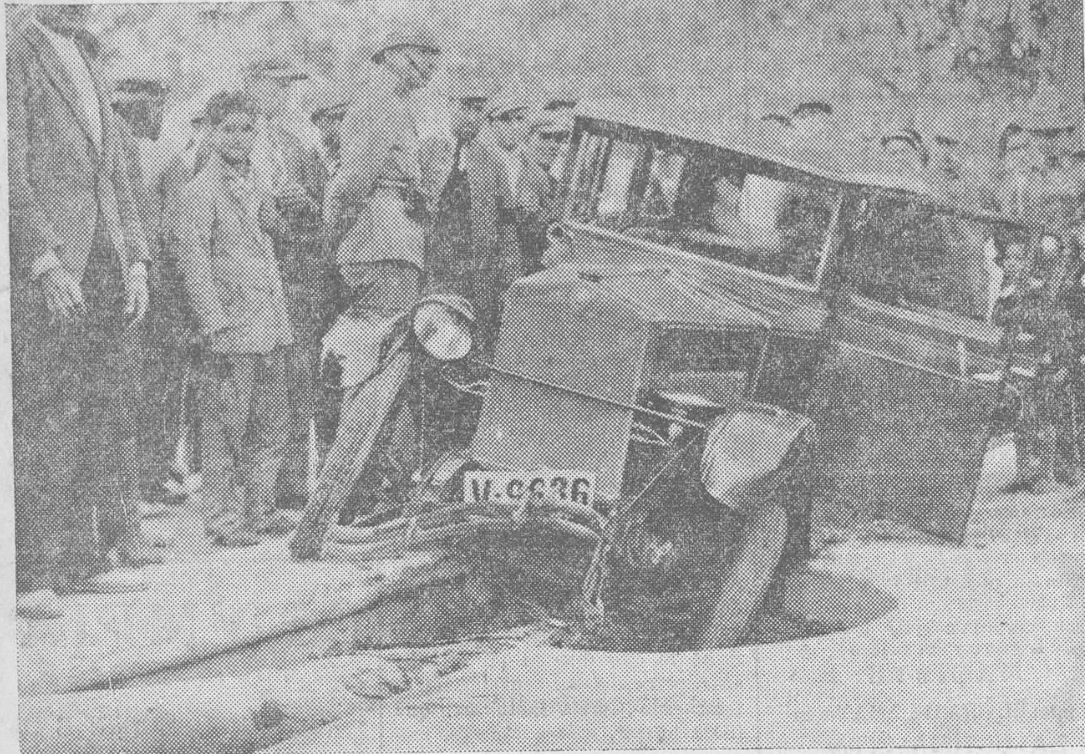
Estado en que ha quedado el auto después de la catástrofe

El maquinista resultó con un brazo fracturado, y el fogonero con heridas leves.