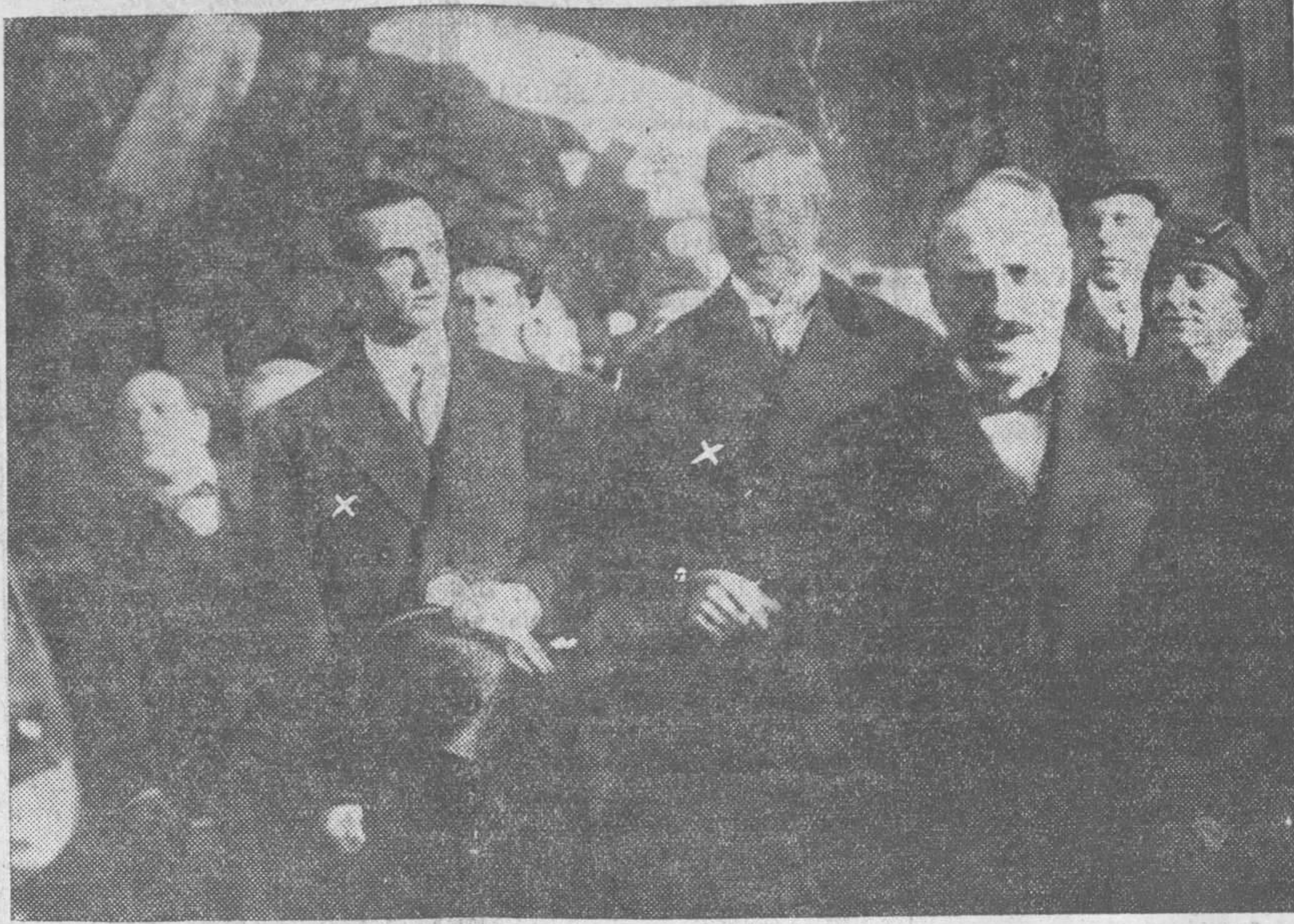
El duque de Piemonte, heredero del trono de Italia (X) llegó a Bruselas, donde el pueblo belga le tributó un cariñoso recibimiento. Encierra esta fotografía el interés de reflejar su llegada, acompañada del soberano belga (X), porque el Príncipe Humberto, al visitar la capital de Bélgica con motivo de su boda con la Princesa de la casa reinante, fué objeto de un atentado