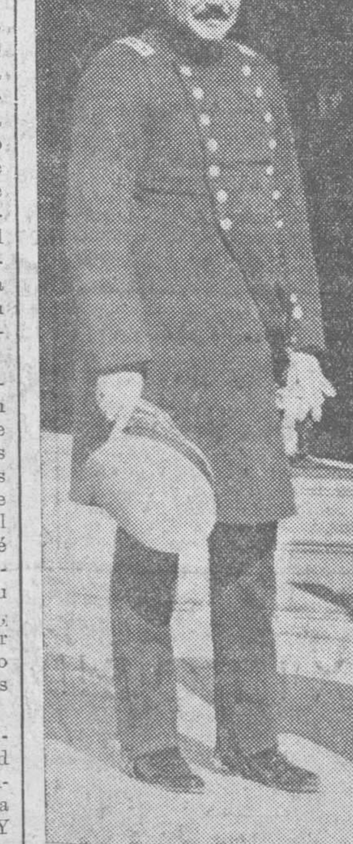
Hace pocos días el general Ibáñez, presidente de la República de Chile, se libró de un atentado contra su persona, y hoy ofrecemos a nuestros lectores, como nota del día, su figura en uno de los momentos de su actuación presidencial