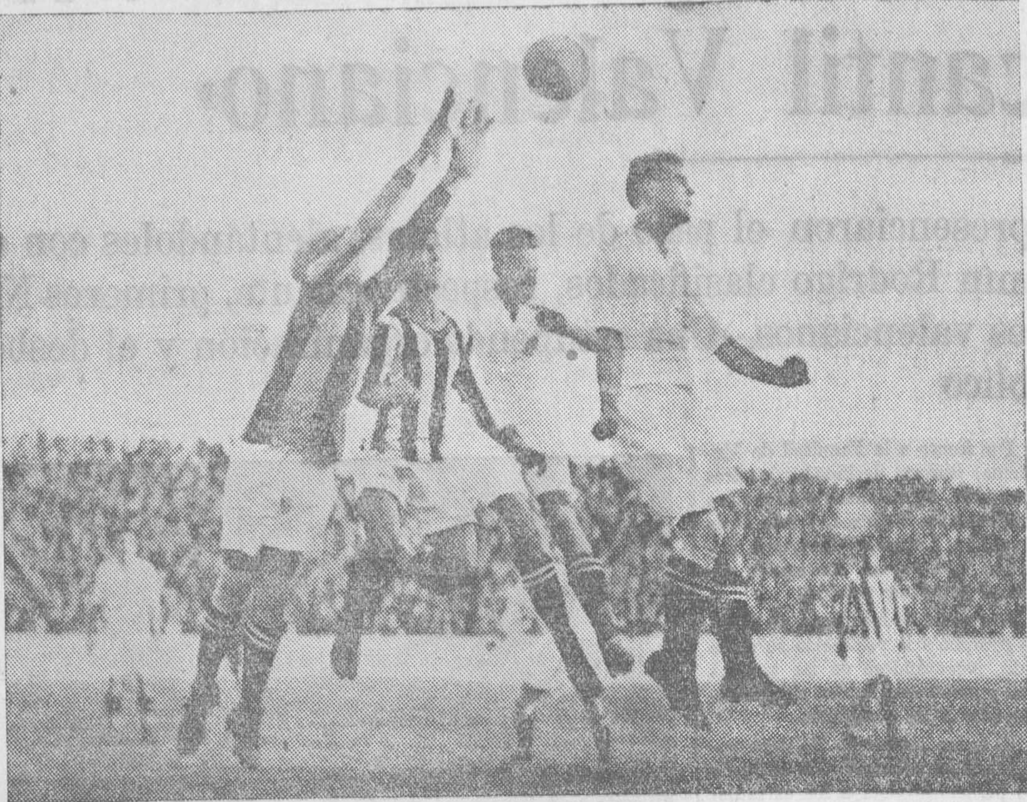
ALANGA DESPEJA VALIENTE UN CORNER CONTRA SU META

Fué justo el resultado, pues aun cuando el Valencia dominó más, del Castellón fué el mejor juego que se hizo