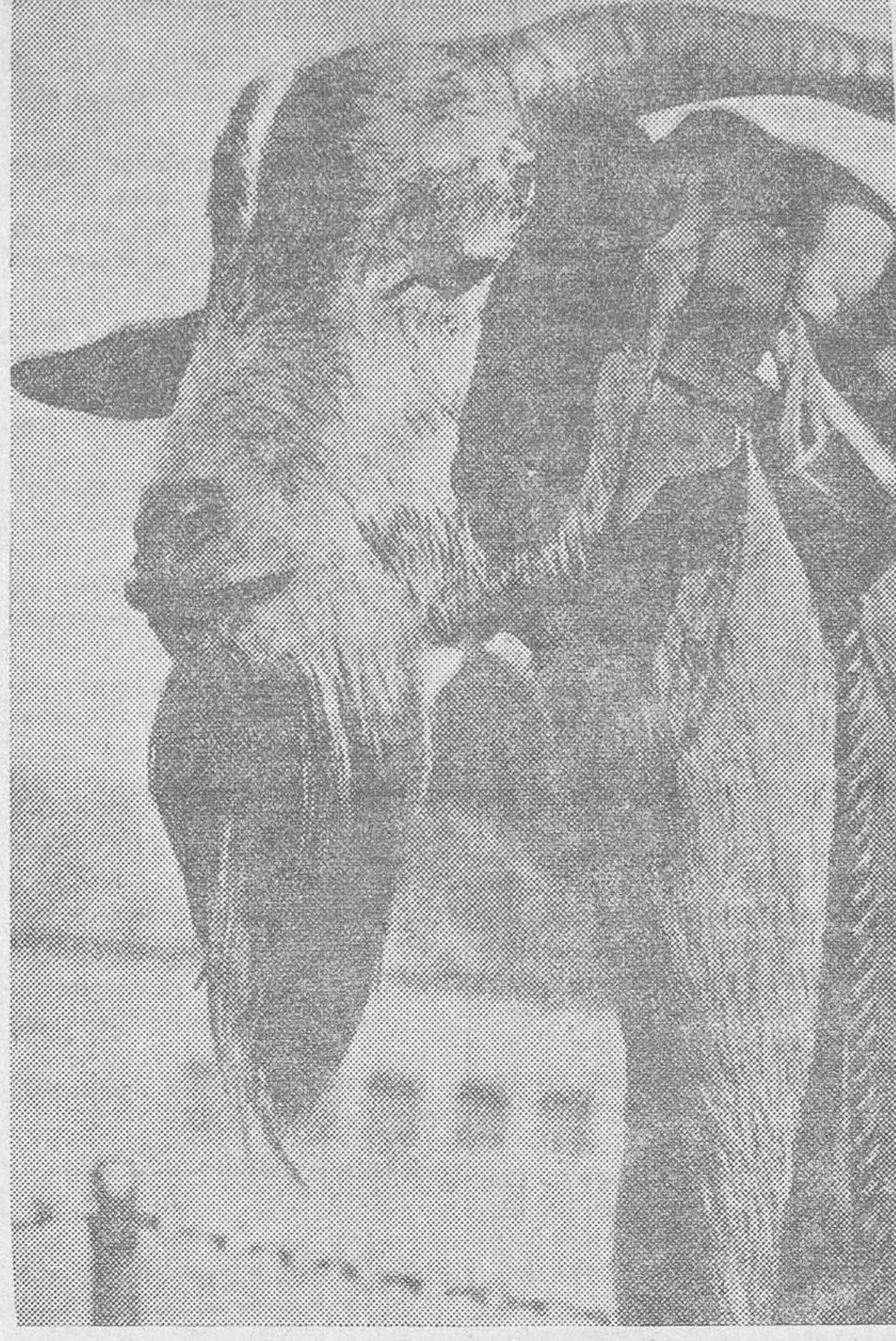
Se trata de una cabra montesa. Fue adquirida por el Secretario de los Estados Unidos, Henry Stinson, en Filipinas, y el ser trasladada a Nueva York, el departamento de Agricultura se opuso a su entrada en el territorio norteamericano alegando el temor de que pudiera ser una enfermedad contagiosa. Los jefes del departamento no respetaron que el animalillo fue e propiedad de tan alta personalidad y la cabra montesa, cuyo retrato publicamos, ha dado motivo a una serie de discusiones que han terminado para tranquilidad de la opinión norteamericana