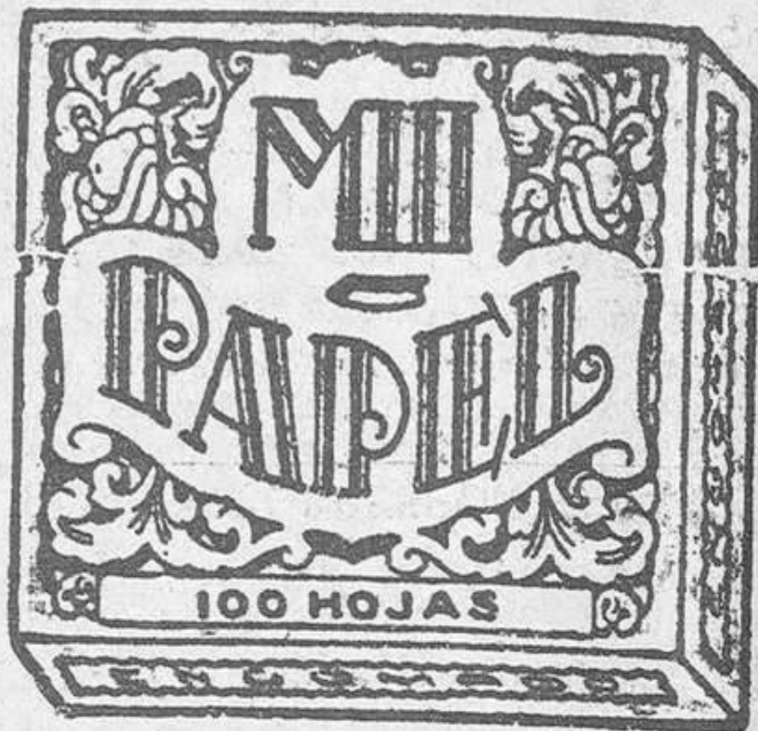
(MARCA DE FABRICA)