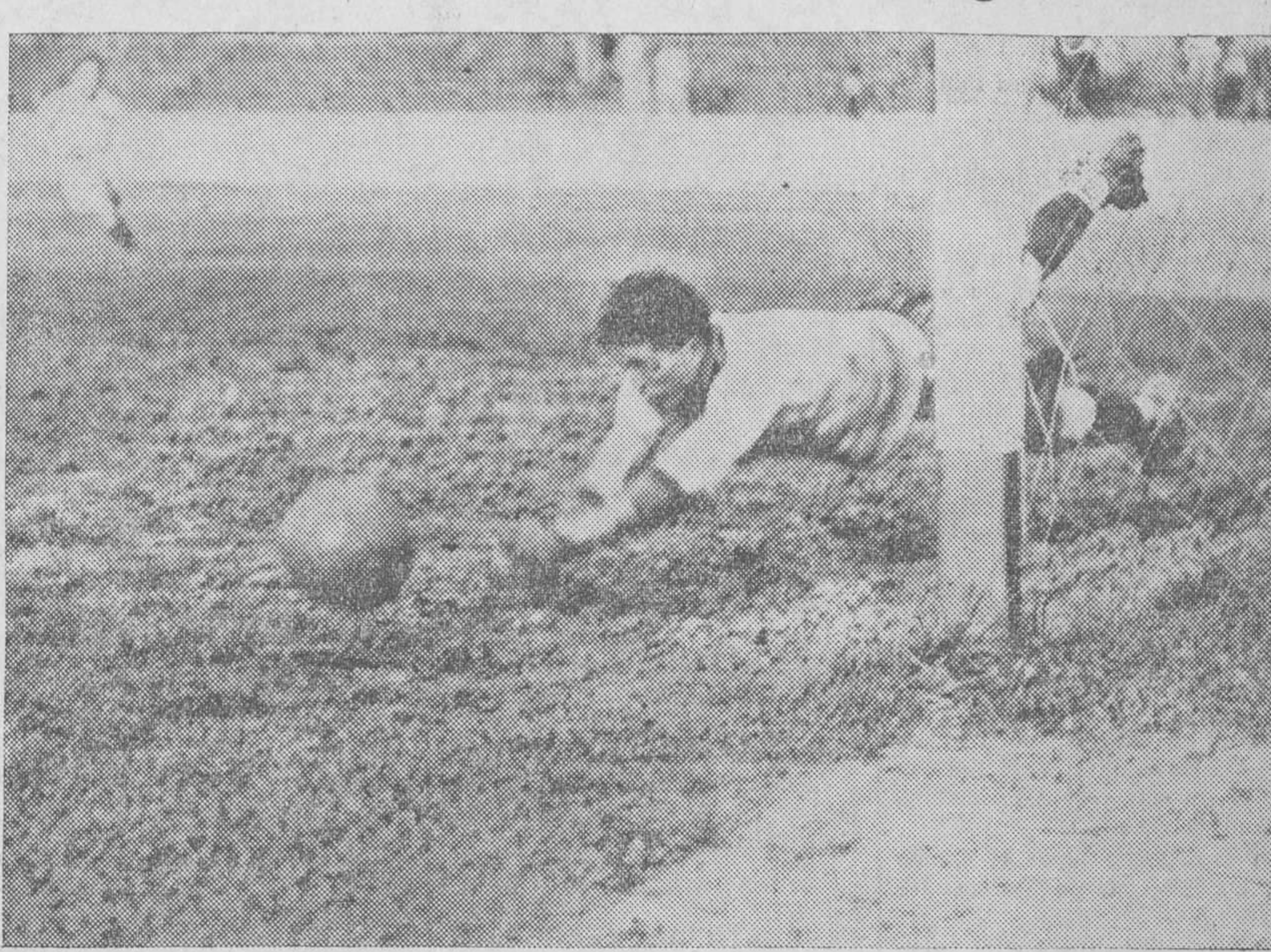
Lilo demuestra en esta jugada su relevante clase que ayer quedó bien patente

Justo, Abdón, Mieres, Chucho, Camarero, Urrutia, Barril, Tamarago.