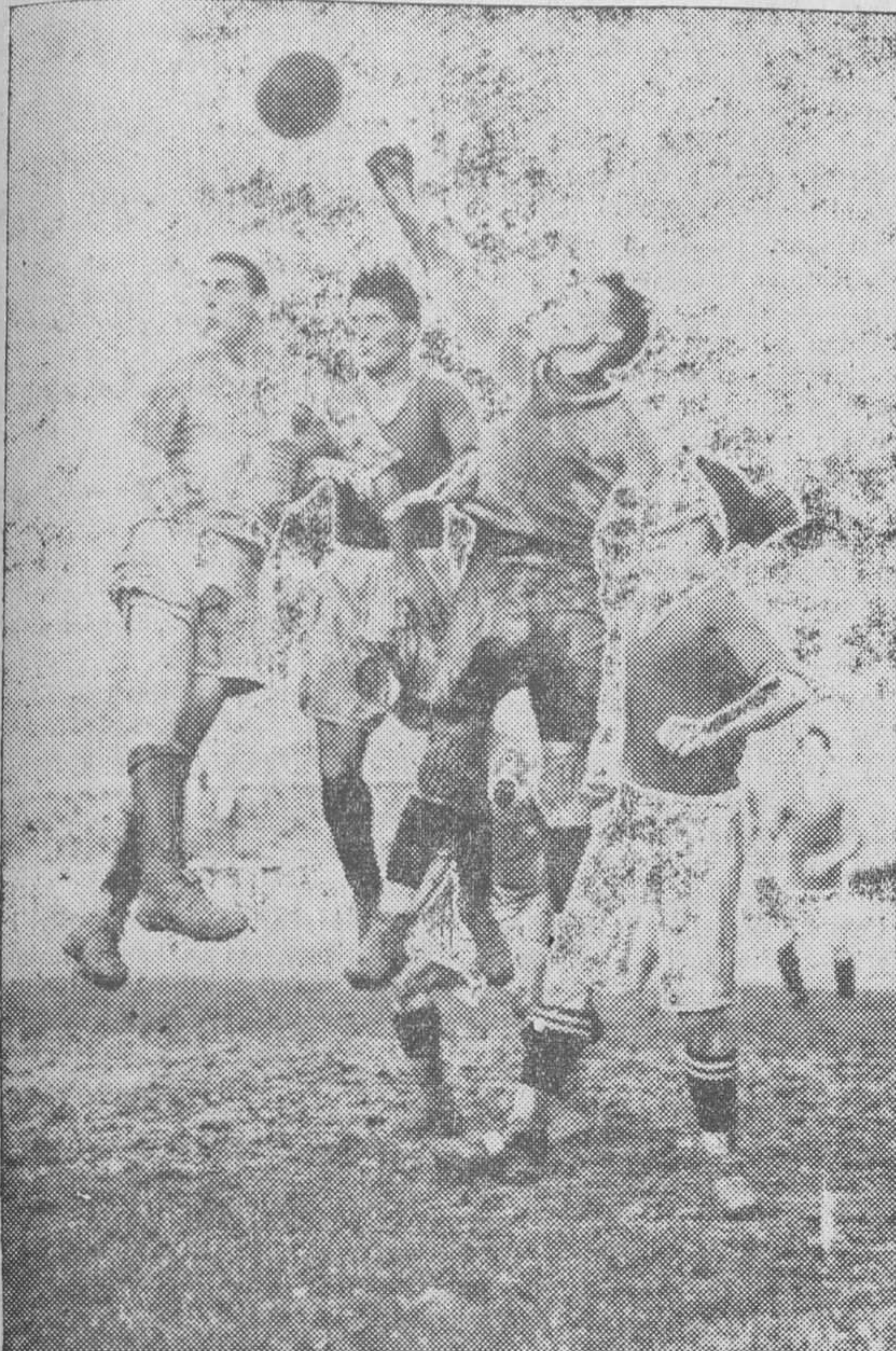
Una melée de jugadores y barro en la puerta del Celta

fué bastante aceptable, y el partido, más que distraído, incluso emocionante, con los sucesivos empates y el resultado mínimo que sólo en la última pitada tuvo consistencia.