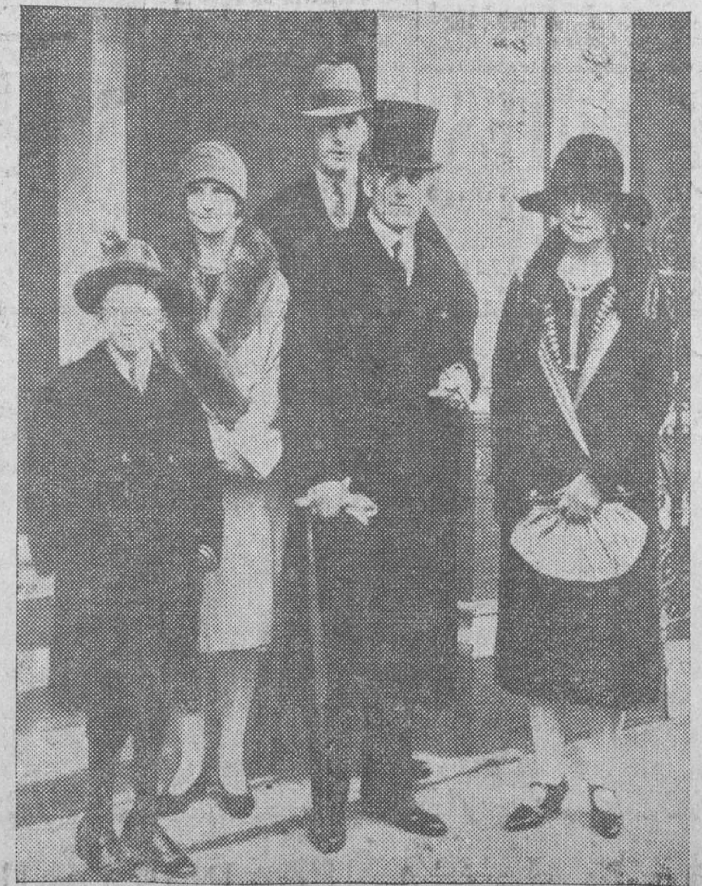
El célebre ministro de Negocios Extranjeros de Inglaterra con su familia antes de las ya discutidas elecciones electorales