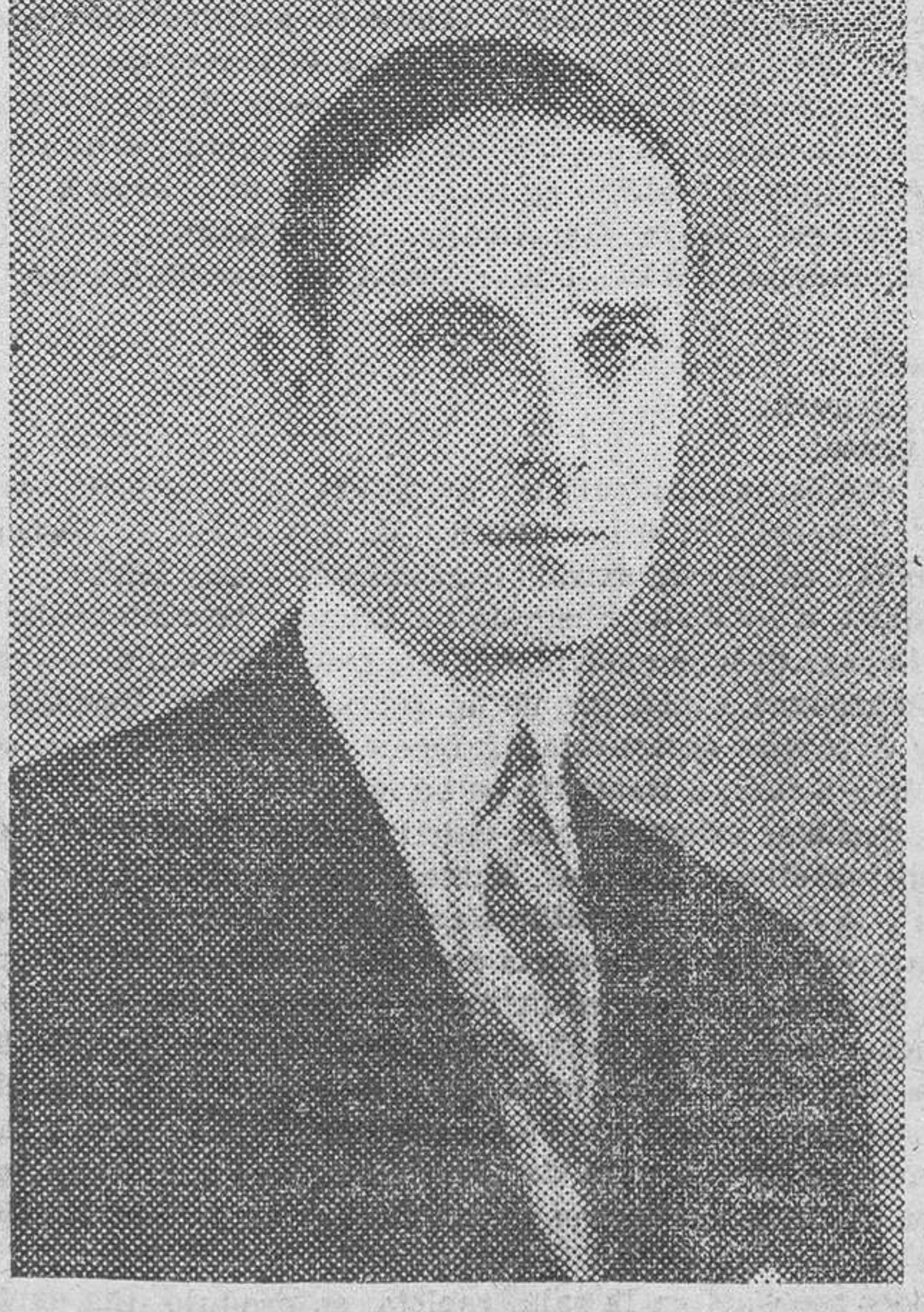
El príncipe Félix Yussupoff

Ivanof, el agente, iba enumerando los lugares de las habituales orgías de Rasputín.