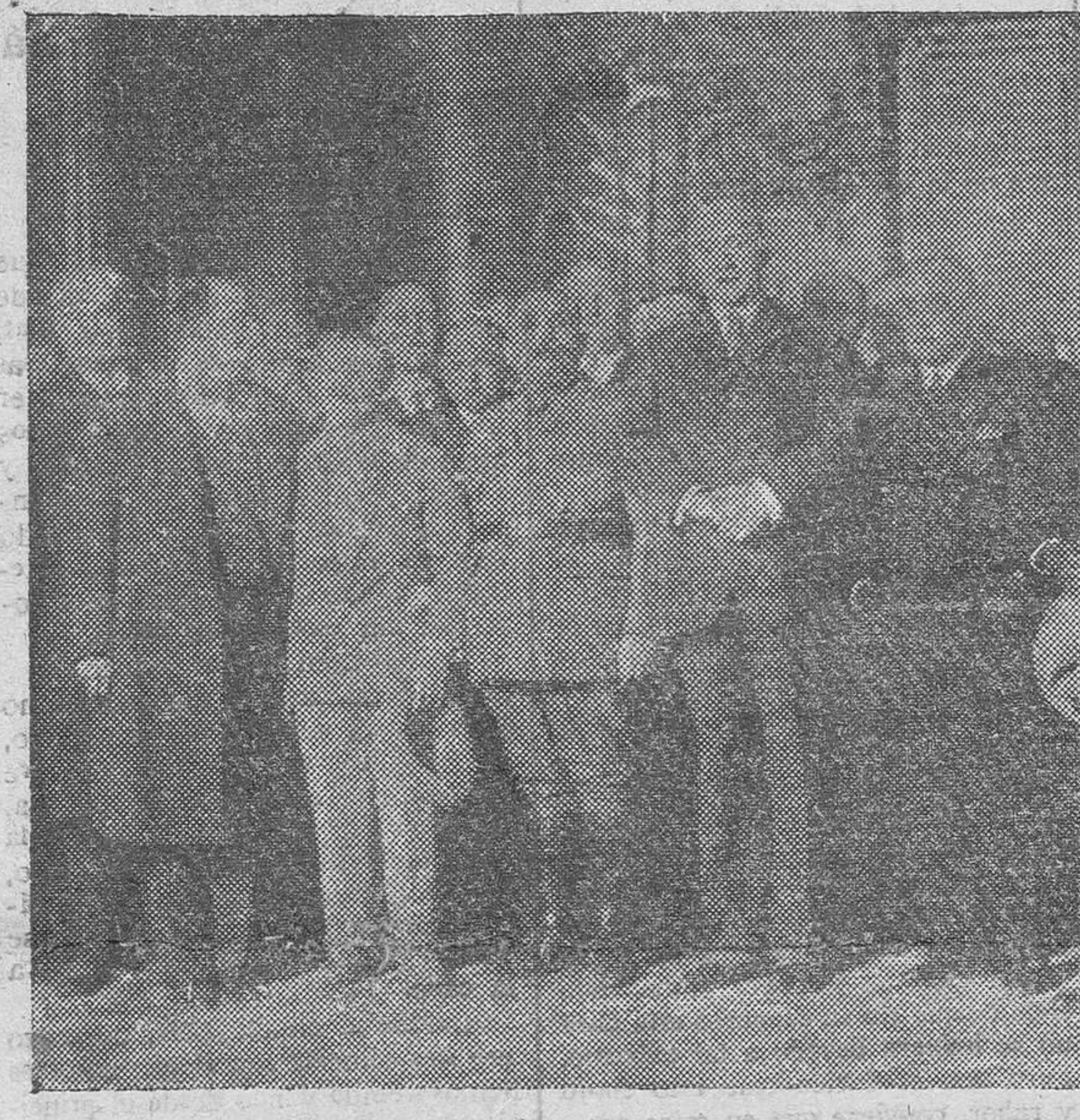
El jefe del Gobierno acompañado de las fuerzas vivas que han solicitado la pronta realización de la autopista Madrid-Valencia

La llegada del general Primo de Rivera fué saludada con grandes aplausos, mientras la Marcha Real sonaba. Después se reanuda el baile, que ya no se interrumpió hasta las diez de la noche.