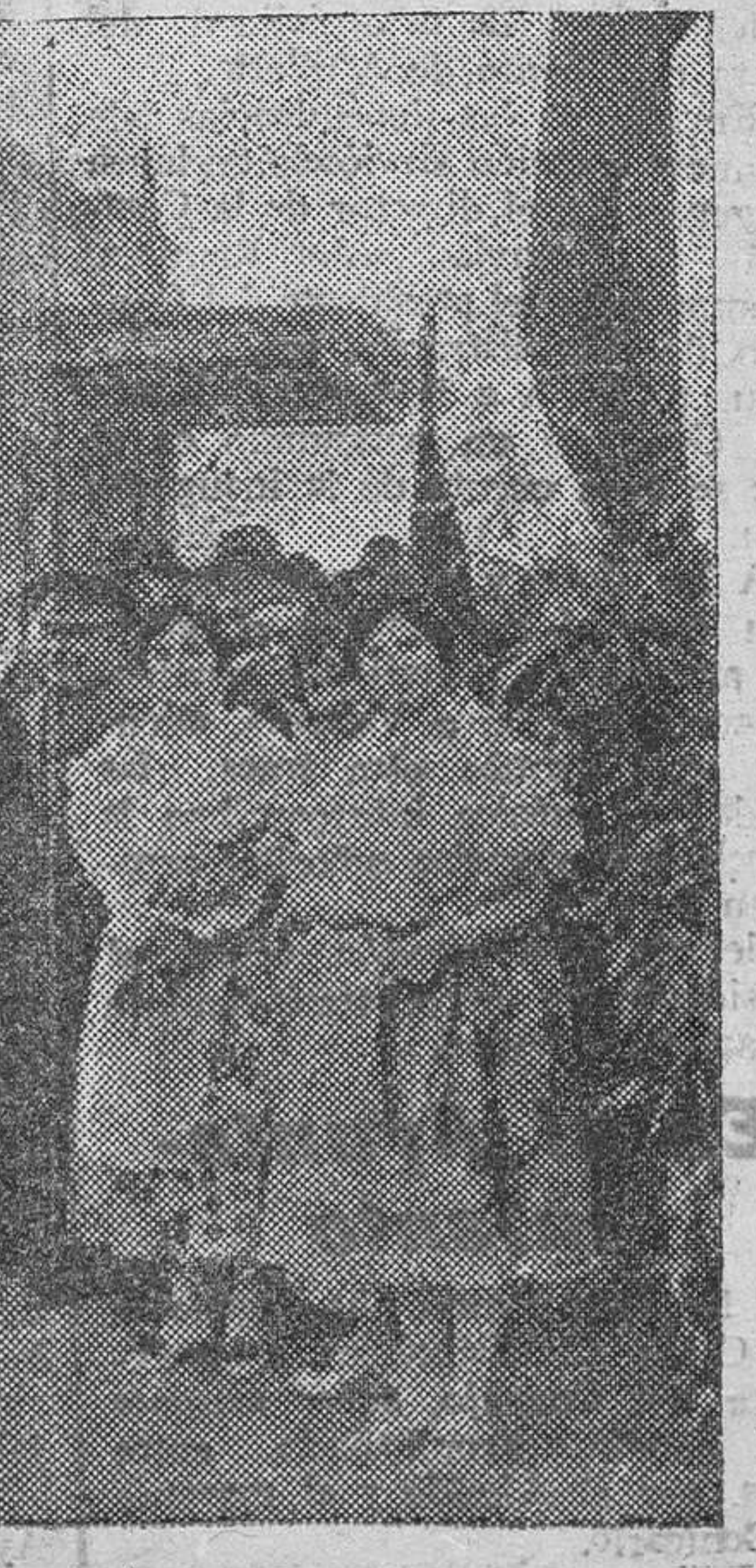
El general Primo de Rivera al inaugurar esta mañana la estación «Campamento de Paterna»