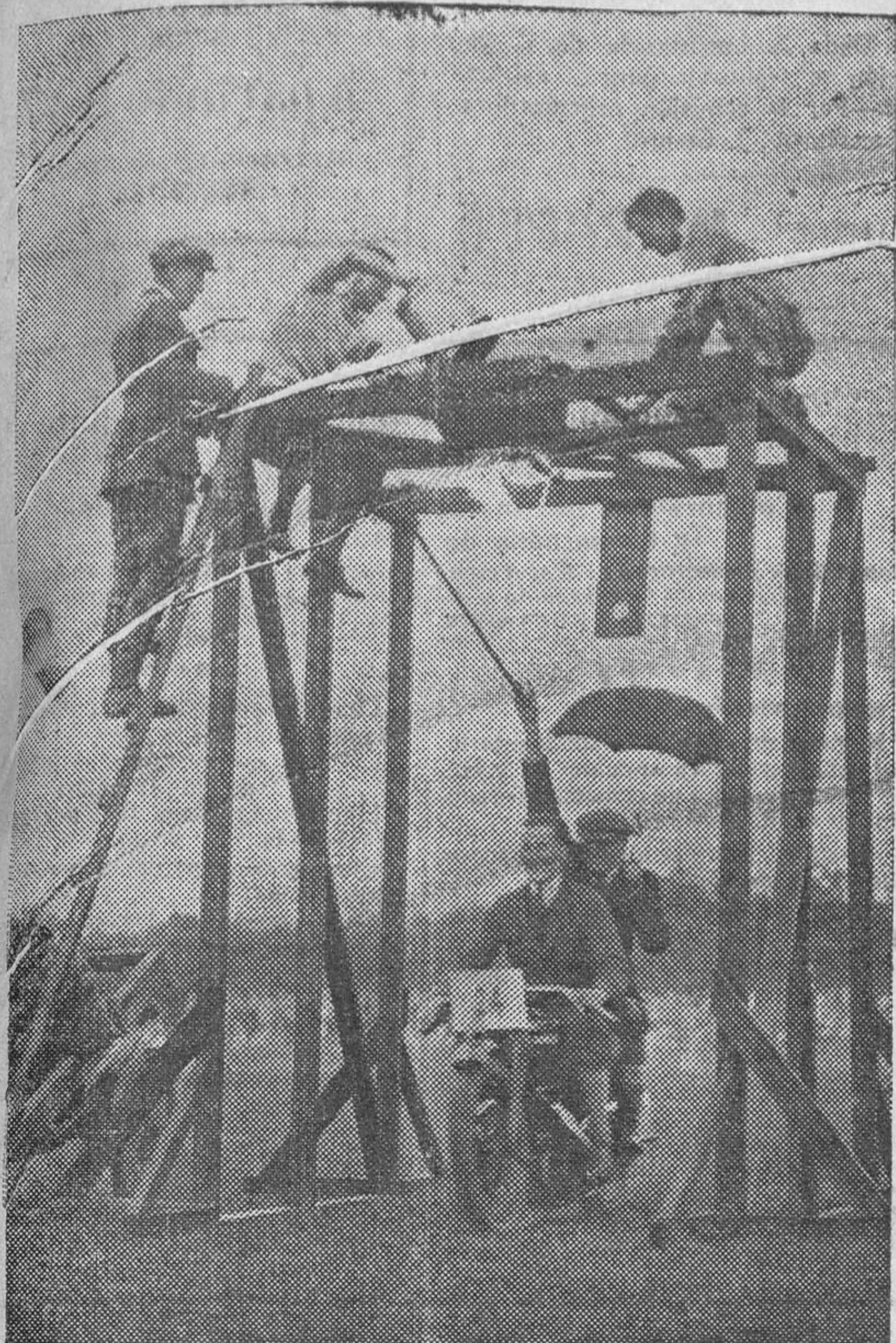
La consabida ducha de este género de pruebas motoristas destinada a refrescar las cabezas de los participantes poco rápidos