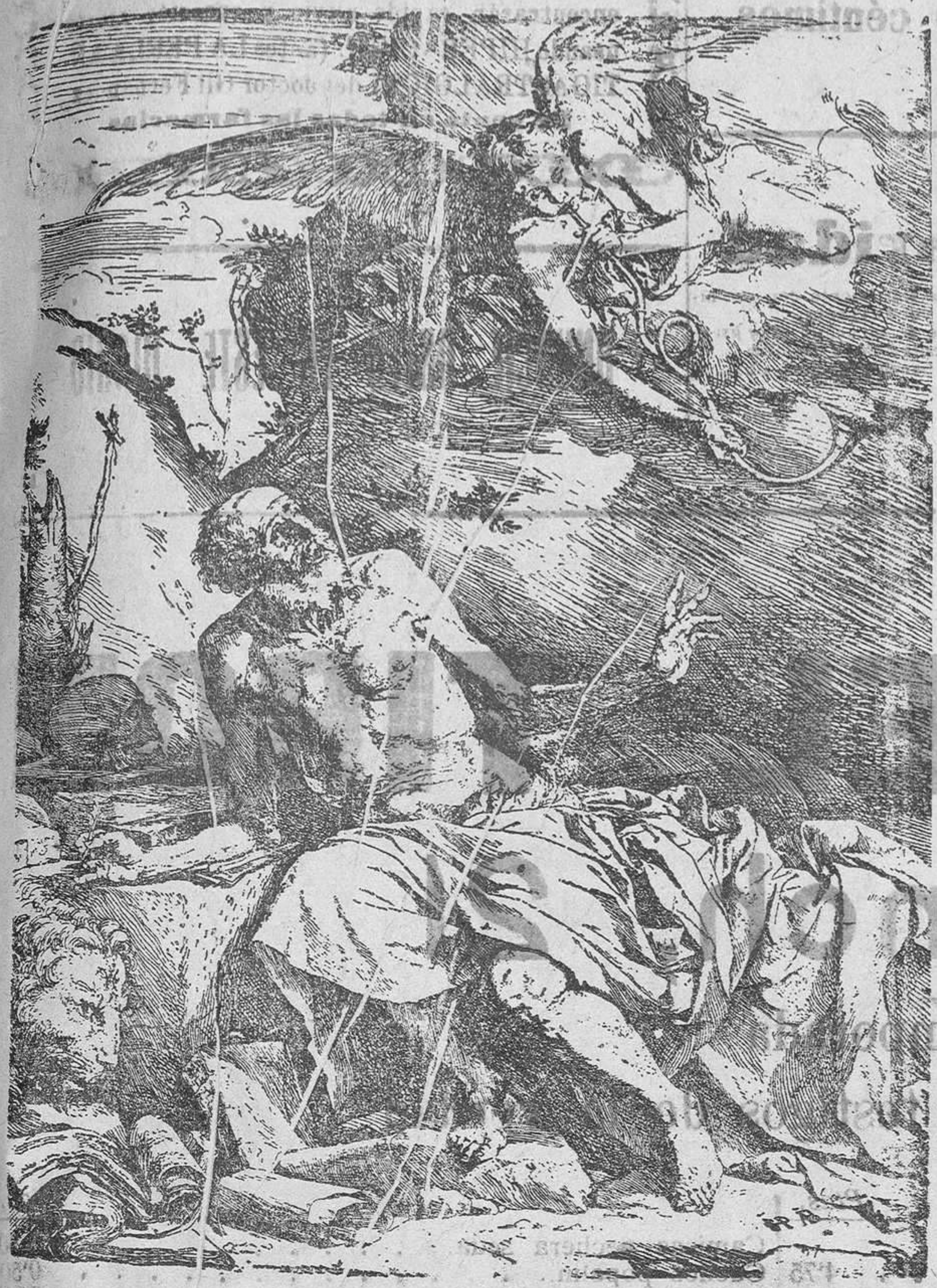
San Jerónimo escuchando la trompeta apocalíptica. En este aguafuerte de Ribera se ve su profundo dominio de los movimientos de la figura humana...