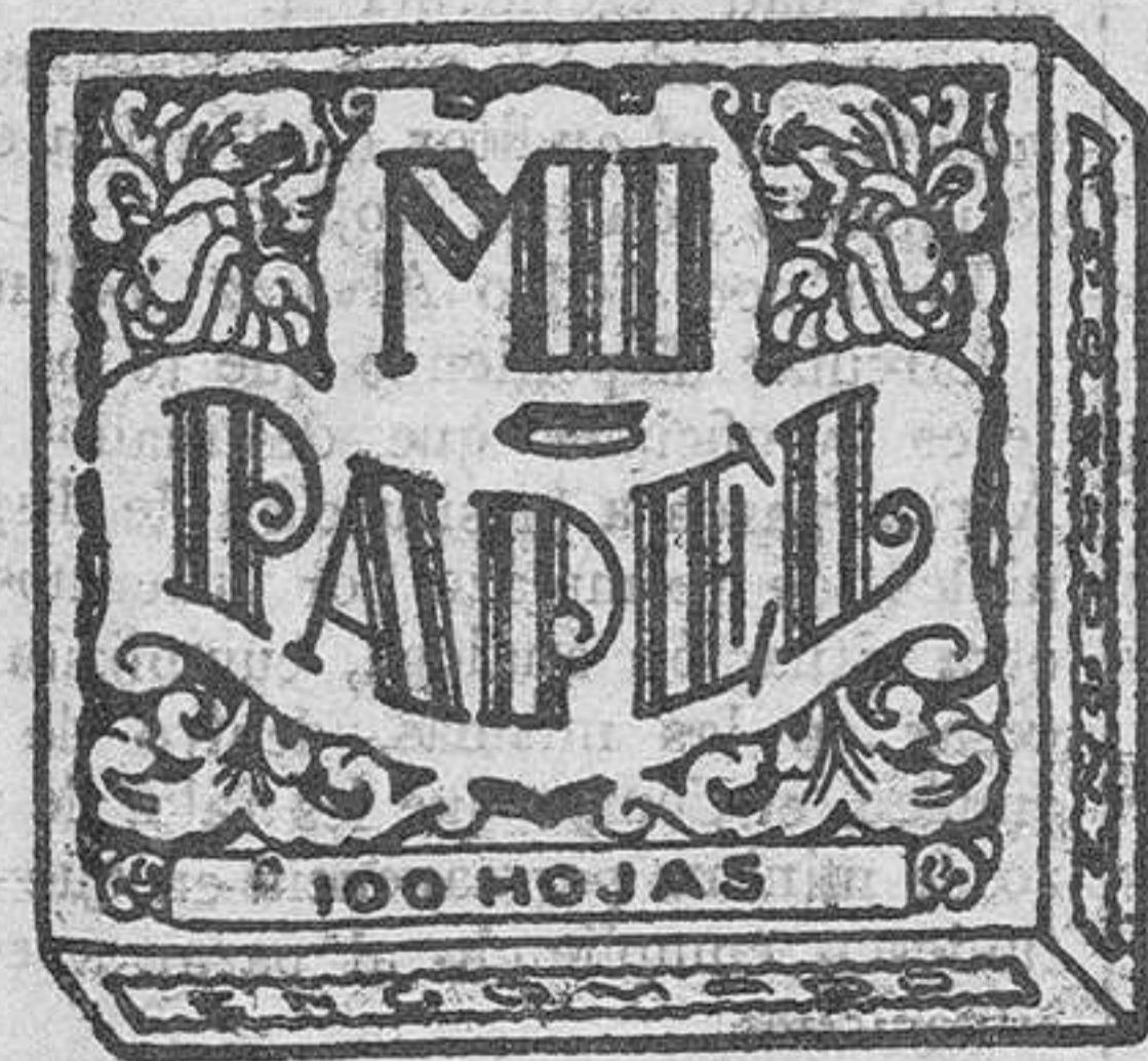
(MARCA DE FABRICA)

Para coleccionarlas, hay editados álbums especiales en cada serie.