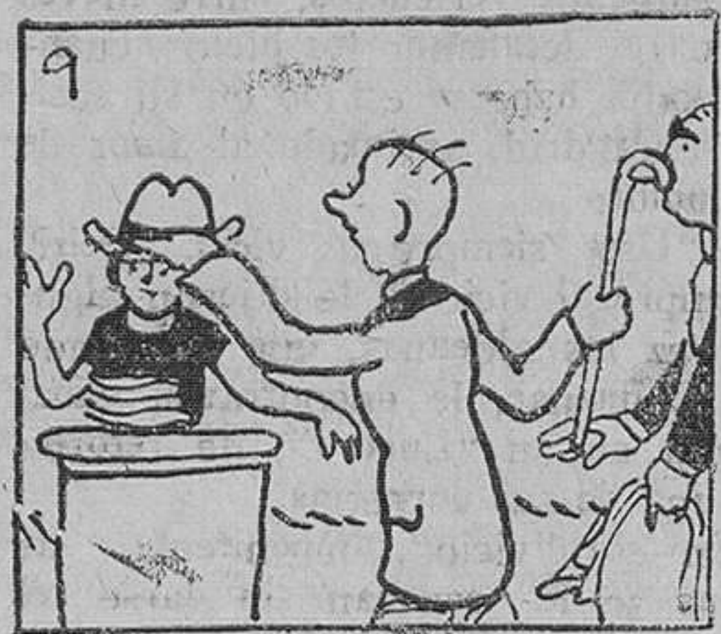
9. Al llegar de visita solía colgar el bastón de las narices del dueño, o colocaba su sombrero en la cabeza de la doméstica.

(Ver "La Correspondencia," del sábado anterior)