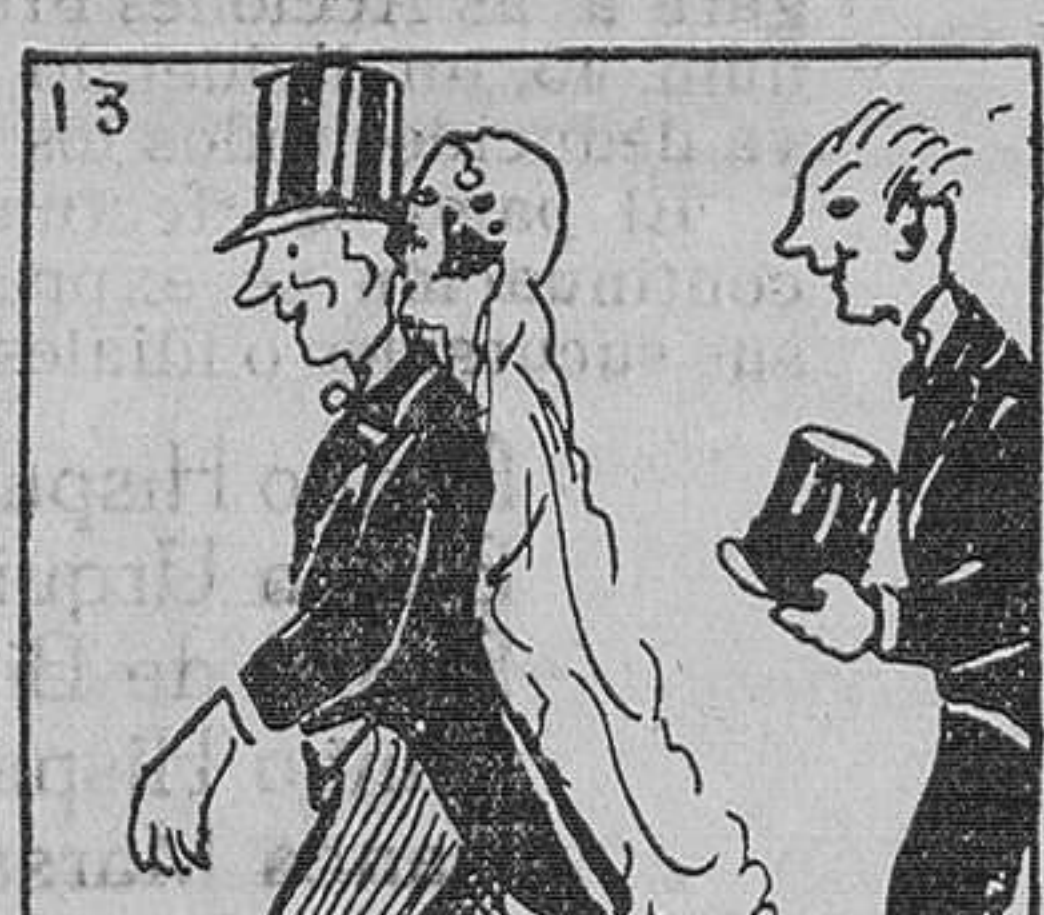
13. Ello hubo su compensación, otro día en que, yendo a un funeral, se incorporó a un cortejo nupcial.