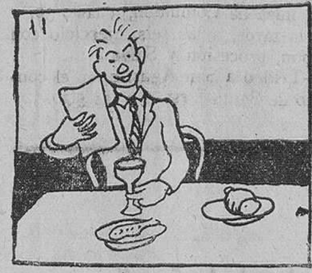
11. Las comidas comenzábalas al revés; y así empezaba por el café y solía terminarlal con los entremeses.