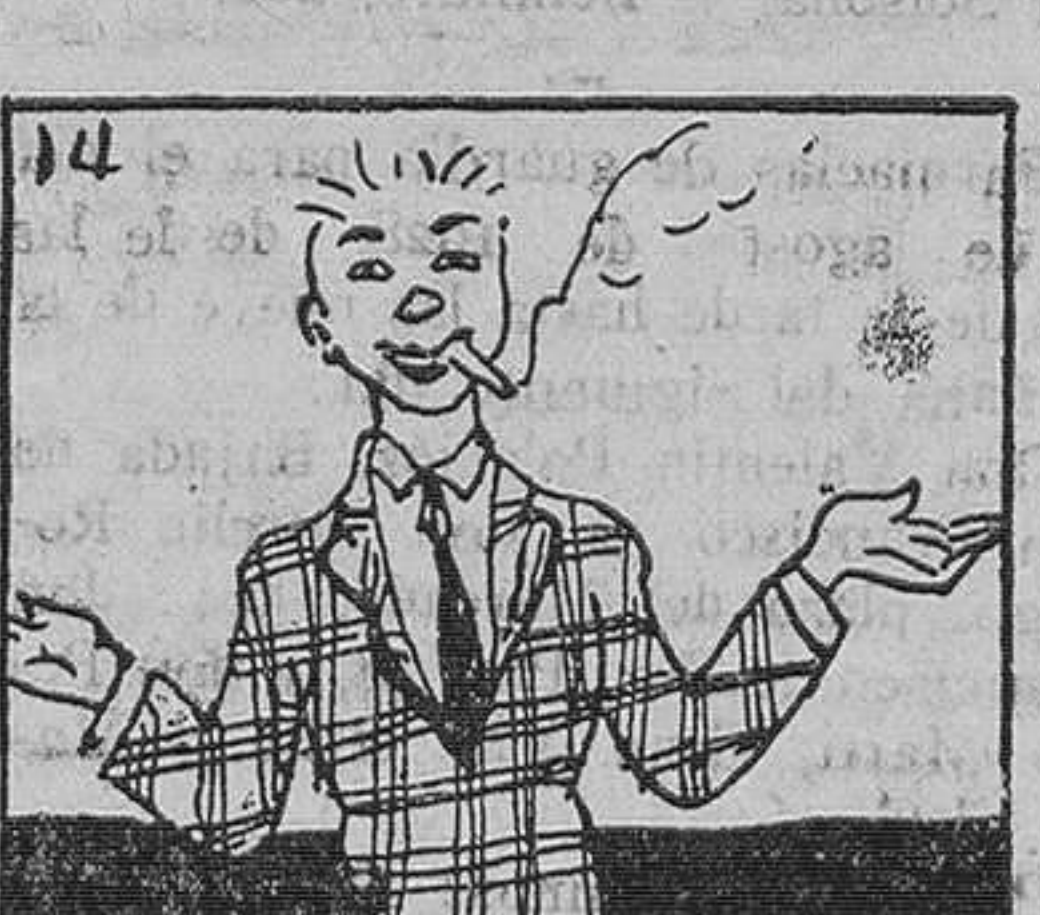
14. Y dice el infeliz que ha gozado de lo imprevisto.