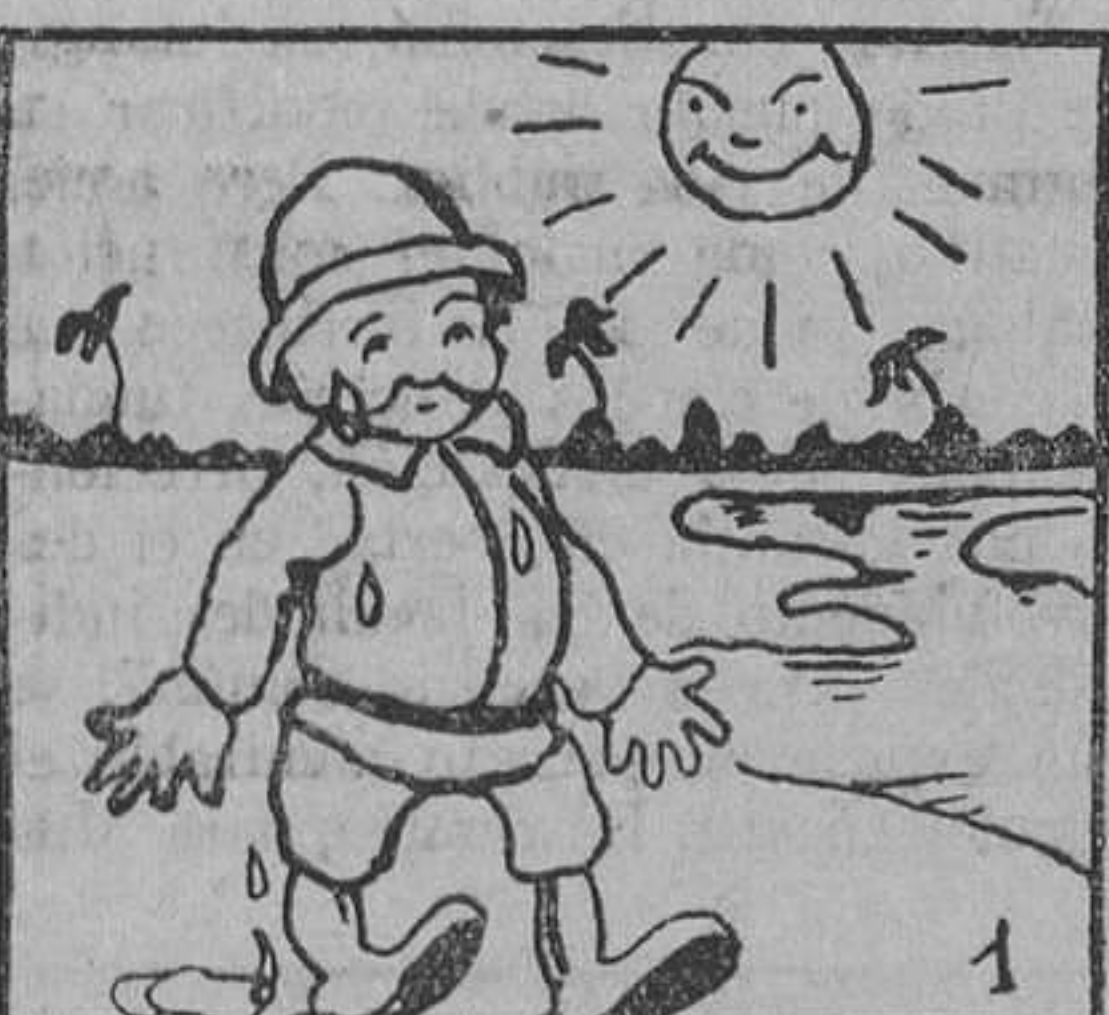
1. Un día que a orillas del Nilo se paseaba el doctor Thraphal-Hoty, según él mismo contaba, le sucedió lo siguiente: