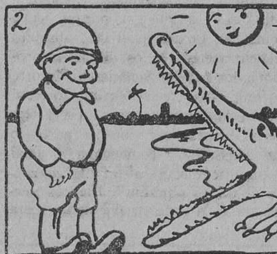
2. Surgiendo del río, saltó al encuentro un descomunal cocodrilo, que, al verlo, abrió sus fauces desmesuradamente.