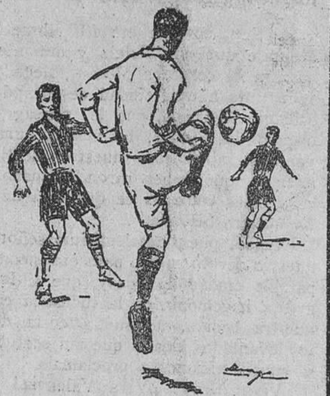
Cruz en un despeje

Al cabo de algunos minutos pitó el árbitro final del partido.