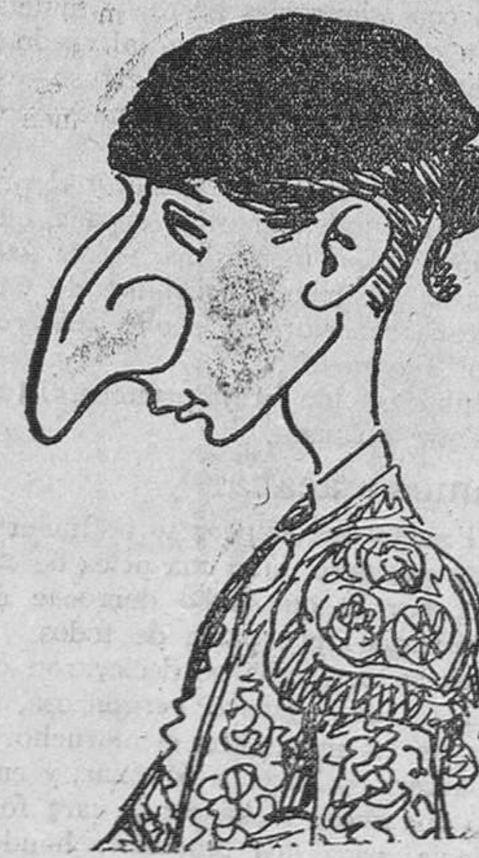
Este es el "hombrecito" Barrera, visto por un "enemigo"

En estas corridas se ofrecen el mercado como frutas verdes, pero como el público ha perdido su gusto por lo sazonado, será de temer que en un tiempo no lejano se organicen