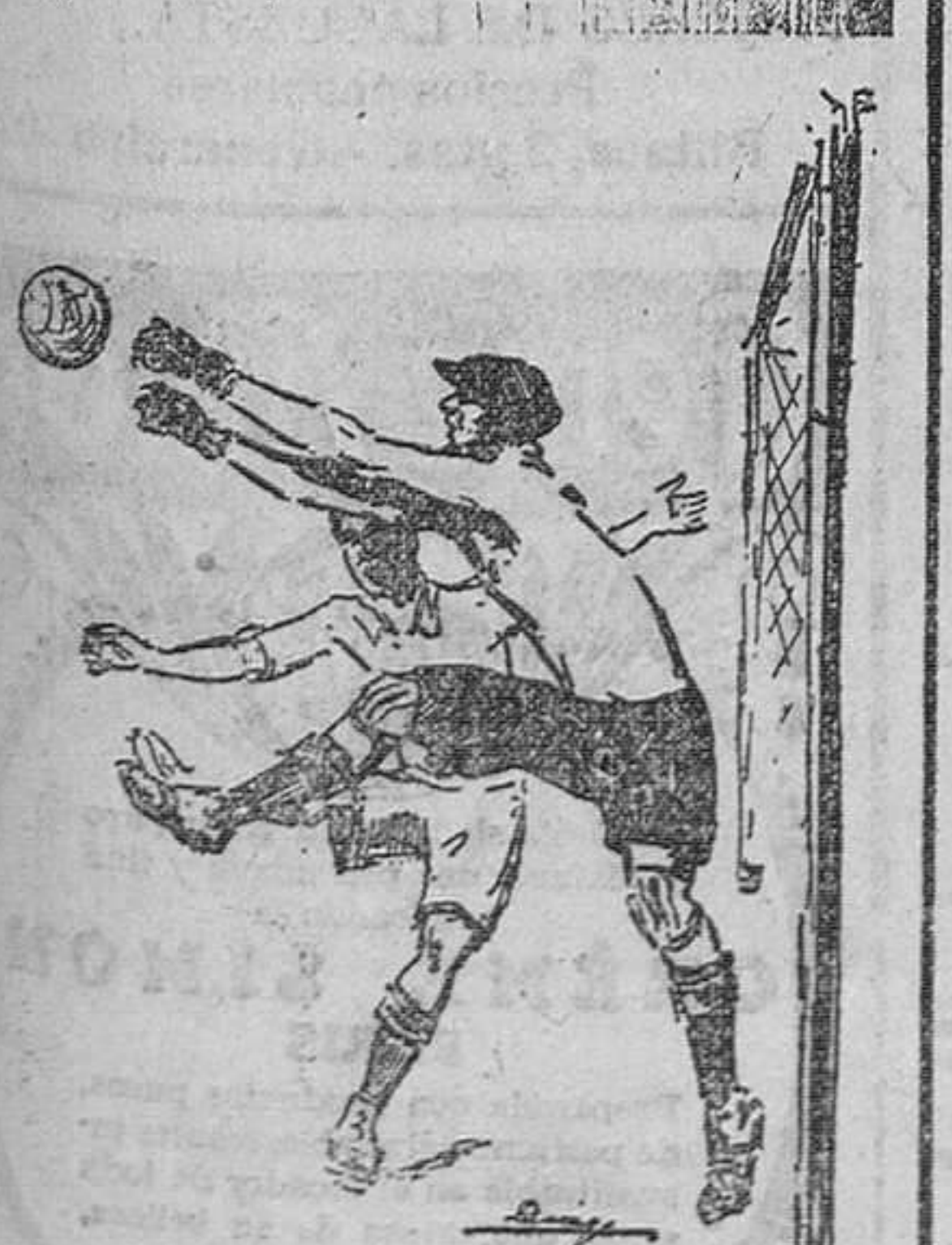
El guardameta del España despejando un corner