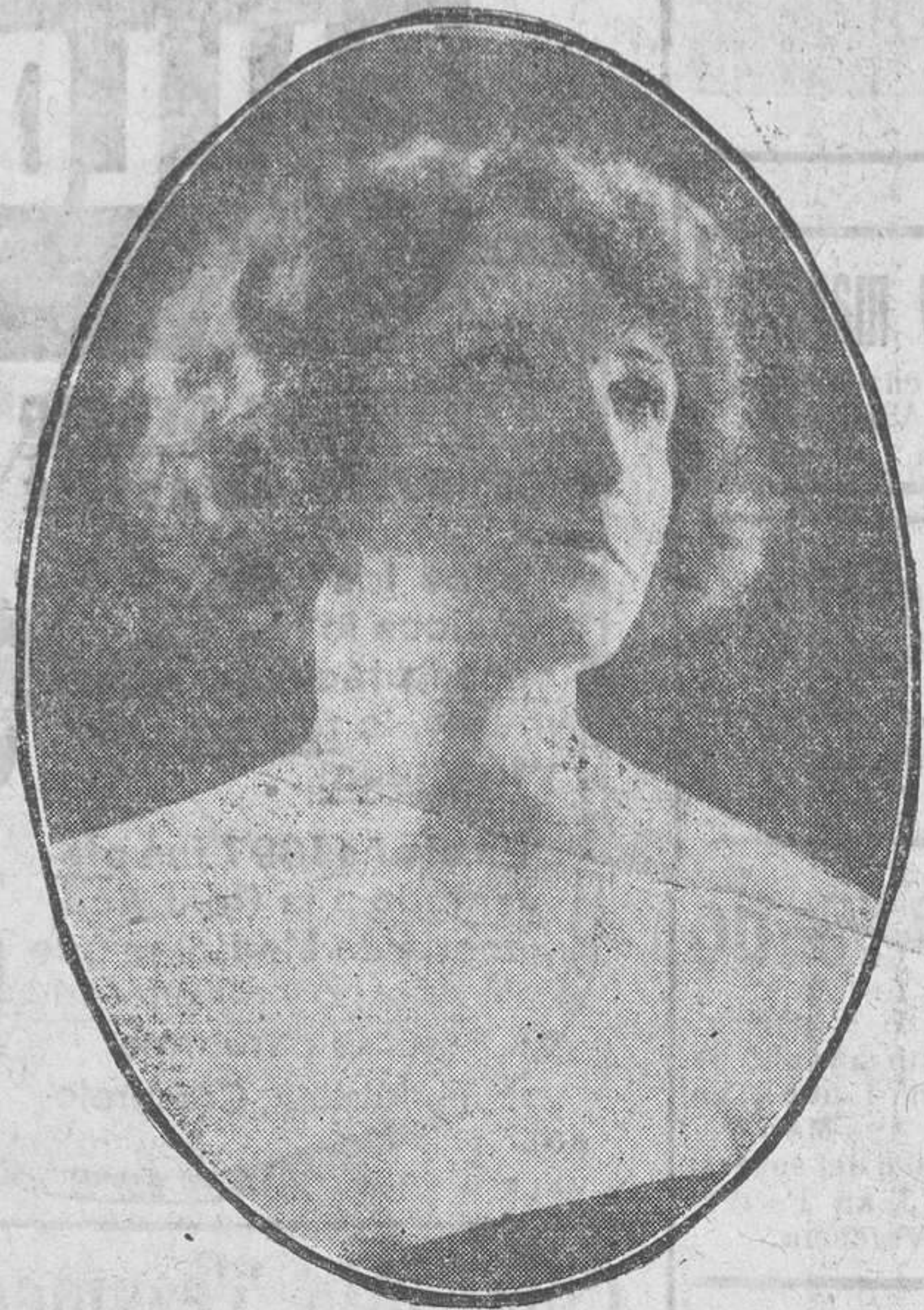
La encantadora artista que anoche celebró su beneficio en el Principal