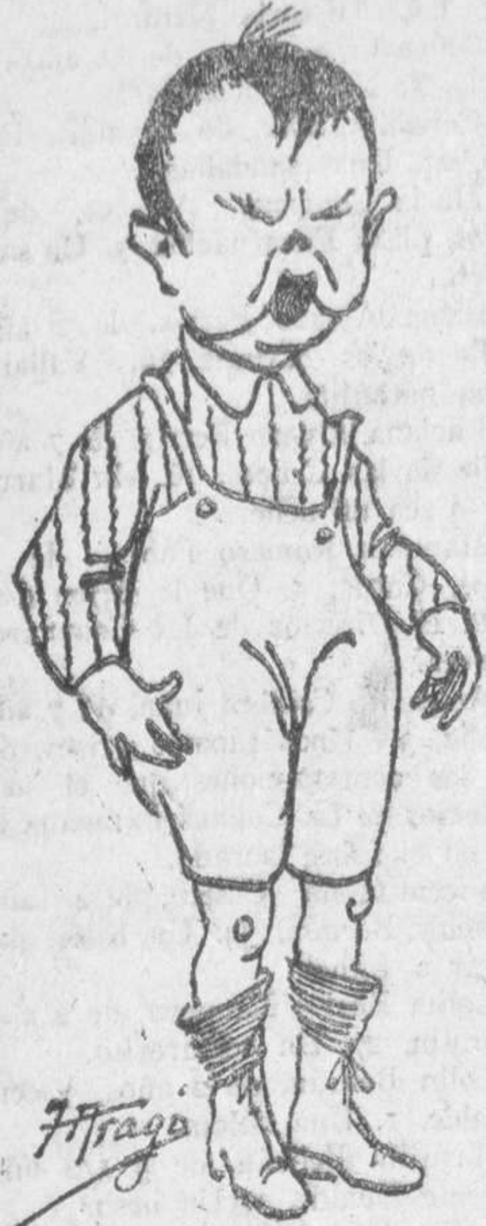
He aquí una inocente pregunta que hacemos a nuestros pequeños lectores:

La adjudicación de los premios la anunciaremos oportunamente.