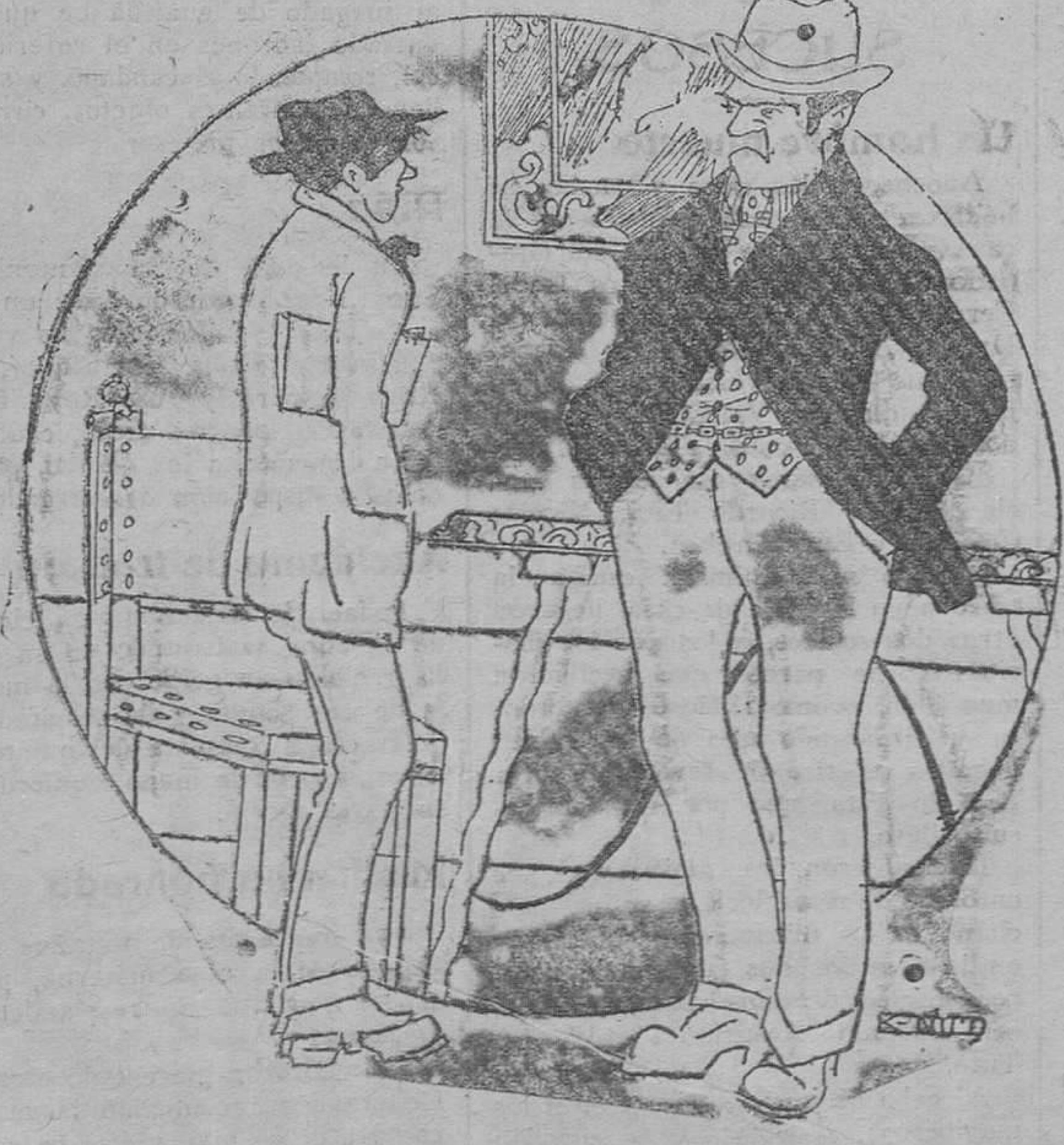
—No, joven, no. Escribir un drama contra el alcohol, en pleno triunfo del ANIS MARUXA, es exponerse a que le corten el pelo a rape.

Servicios englobados a precios reducidos de todas clases. Tarifa especial para los servicios que se utilizan por la clase media.