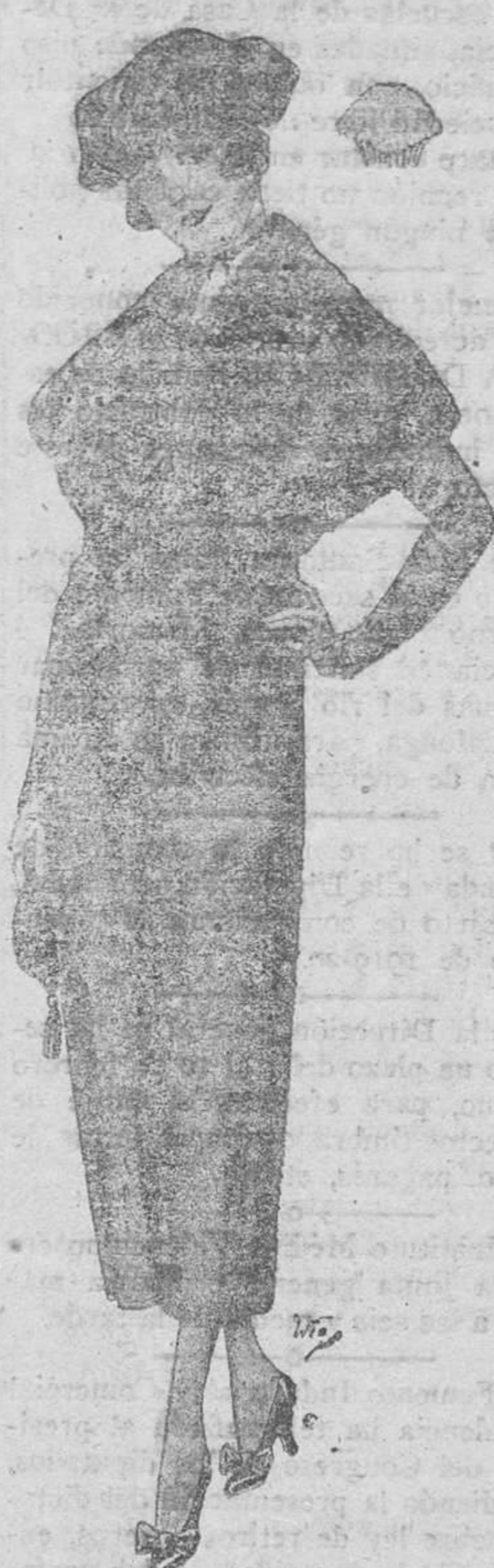
De 27 pesetas a 18'50 De 30 pesetas a 20'50