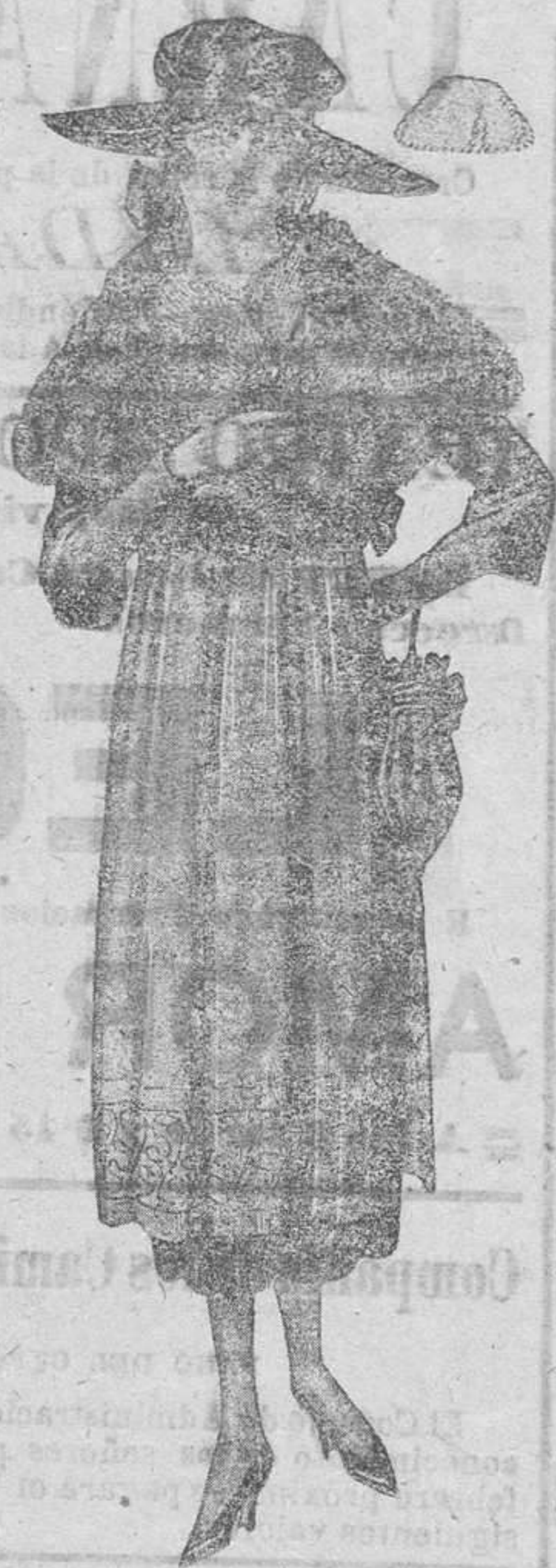
CUELLO De 17 pesetas a 11 MANGUITO De 40 pesetas a 26