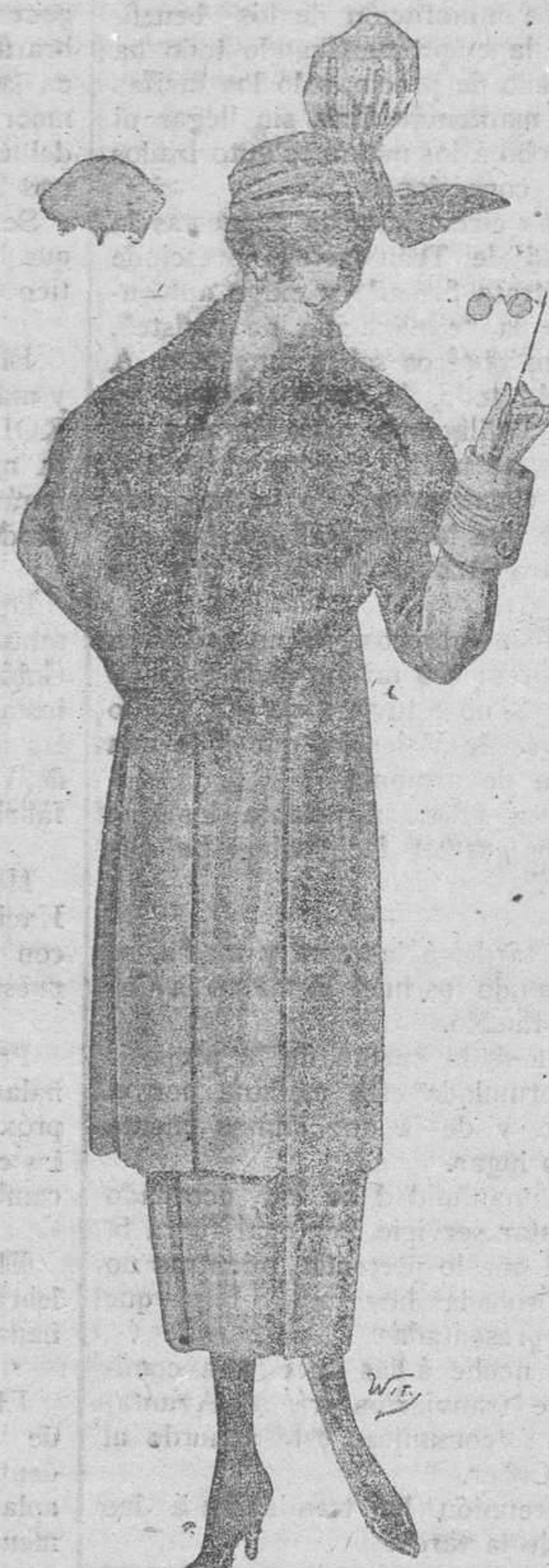
De 40 pesetas a 24