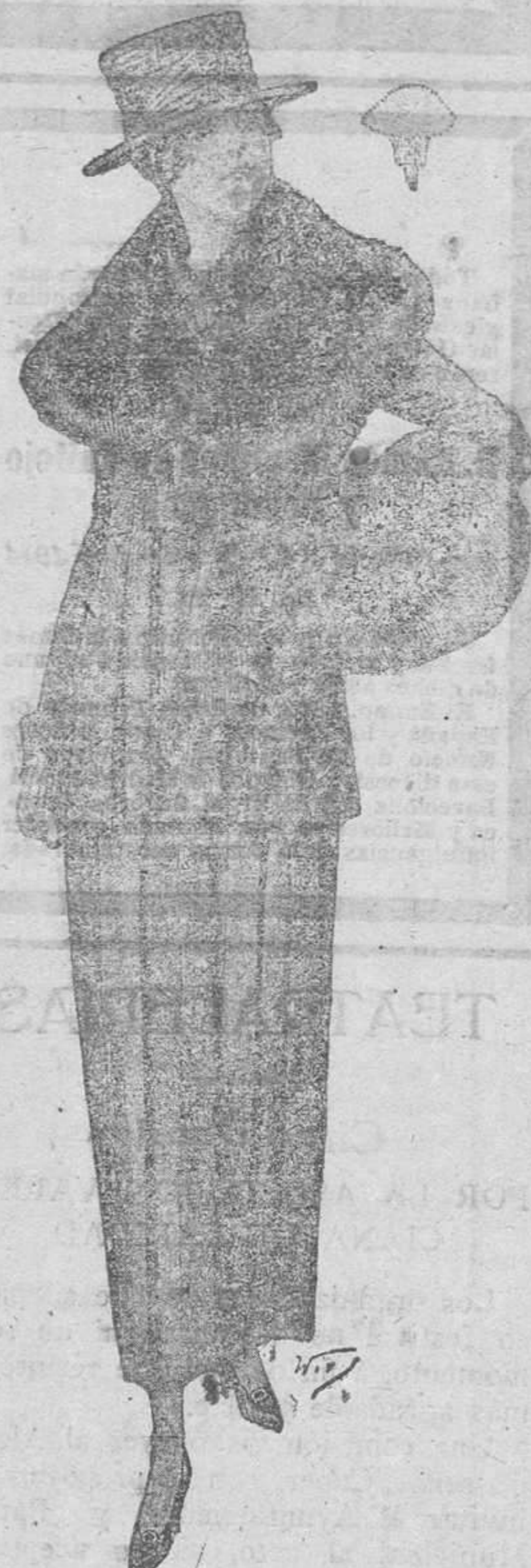
De 14 pesetas a 9'50 De 16 " a 11 De 18 " a 12'50 De 21 " a 15