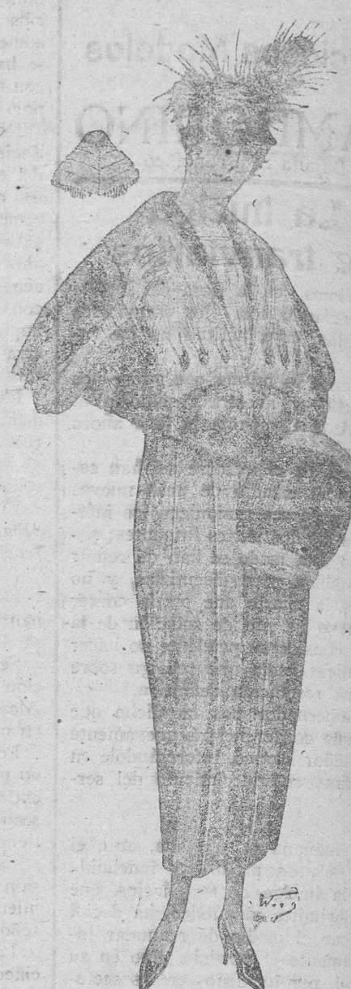
CUELLO De 130 pesetas a 90 MANGUITO De 35 pesetas a 23

NOTA. Anticipamos a nuestra distinguida clientela y al público en general que las mismas pieles para el invierno 1919-20 han tenido fuerte alza y conviene proveerse ahora.