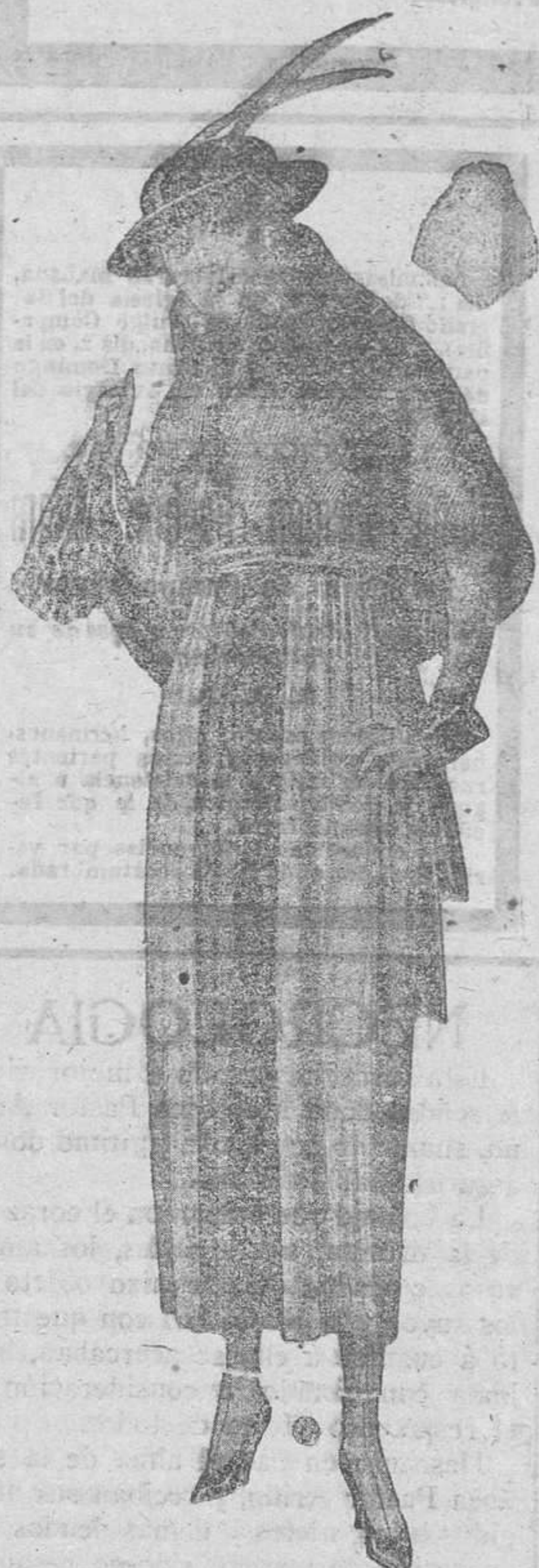
De 110 pesetas a 74'50