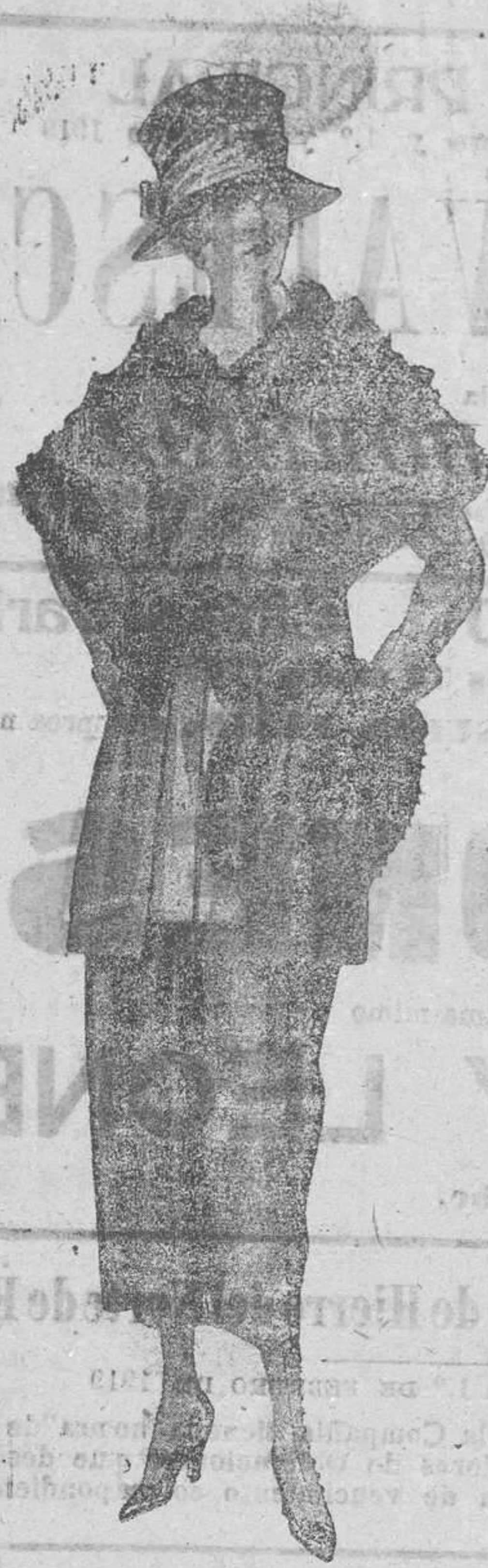
CUELLO Los de 75 pesetas a 47'50 MANGUITO De 38 pesetas a 25