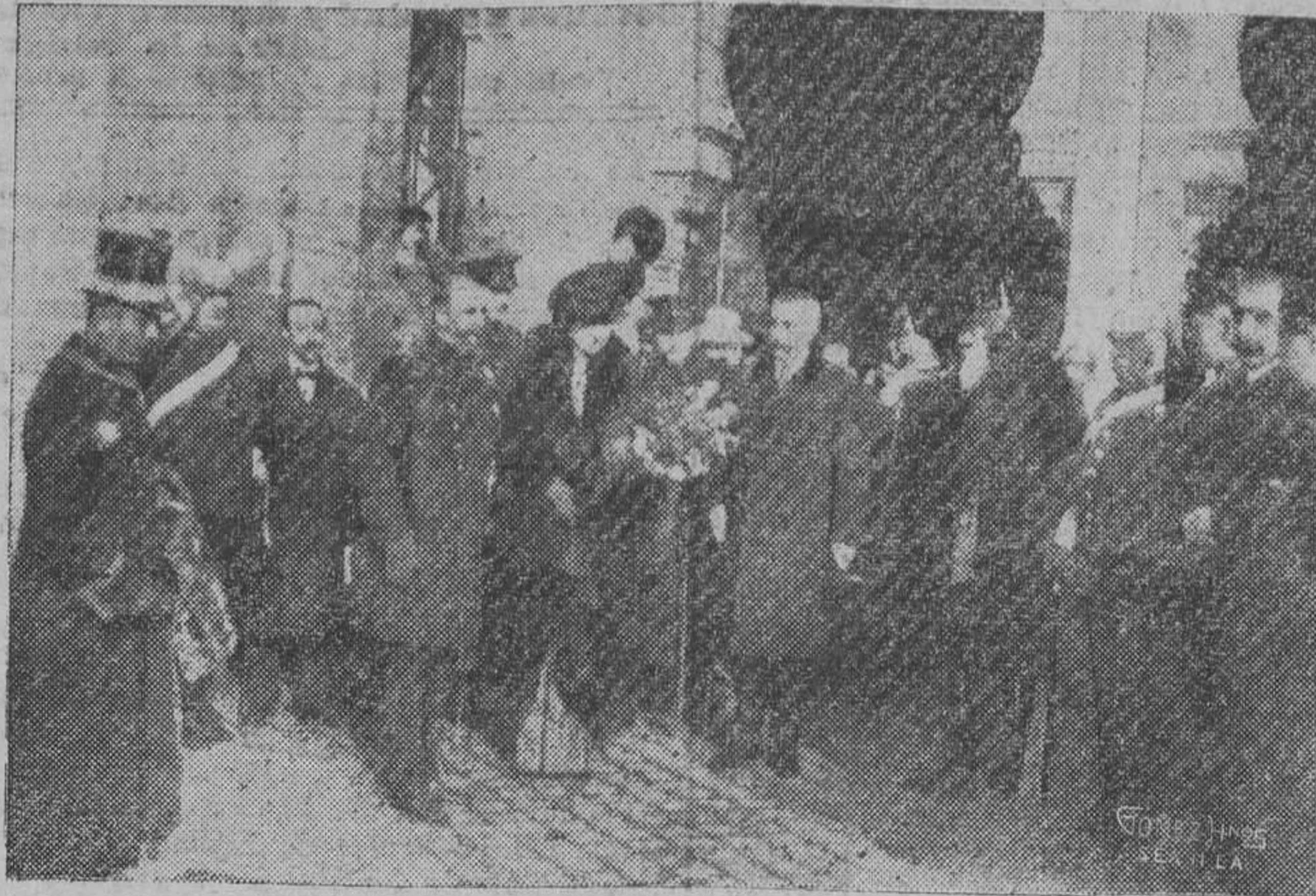
Salida de SS. MM. de la estación de Sevilla, acompañados de los Príncipes de Battenberg

guración del Círculo Liberal Democrático el Sr. García Prieto. Aunque muchos temen que hombre poco apto para la gran lucha política defraude las esperanzas, como ocurrió en el discurso que hizo en la tan anunciada y poco fecunda en éxitos Asamblea del Senado. Veremos si la adversidad por que después ha atravesado le ha hecho pensar en la necesidad de herir más hacia el corazón de Romanones, en cuyo caso, como el conde de picardía no anda mal, se prepararán debates interesantes entre ellos para cuando funcionen las Cámaras, pues ya es sabido que Prieto deja la senaduría vitalicia para venir diputado y poder contender en la Cámara popular con su adversario.—X.