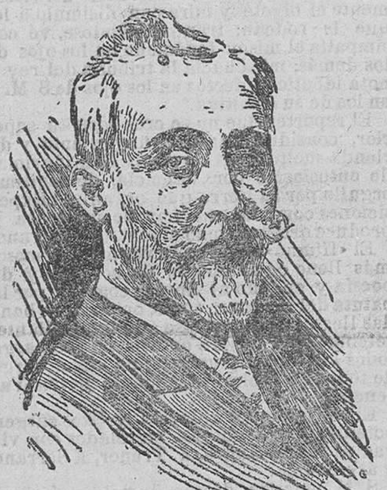
D. Antonio Maura PRESIDENTE DEL CONSEJO DE MINISTROS

En el trayecto A las once de la noche se retiró S. M. a descansar y se ha levantado esta mañana a las ocho, poco antes de llegar el tren real a Játiva, y por esta causa no pudo recibir el homenaje que en la estación se habrían dispuesto a rendirle las autoridades y el público numeroso. El Sr. Manra recibió a las autoridades, aplaudiendo el motivo por el cual S. M. no se hallaba presente, y ofreció que al regreso a Madrid se detendría el tren real en Játiva y podrían entonces cumplimentar a S. M. En la estación de Játiva estaban las bandas de música La Primitiva y La Nueva.