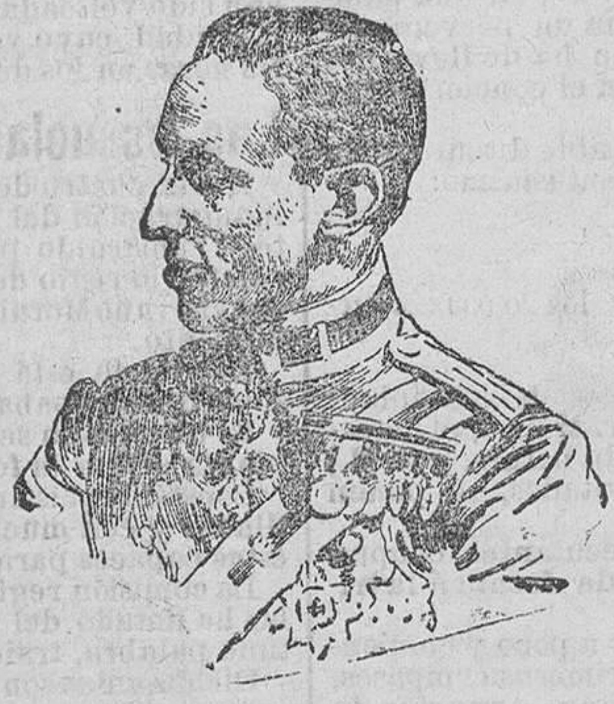
S. M. el Rey D. Alfonso XIII