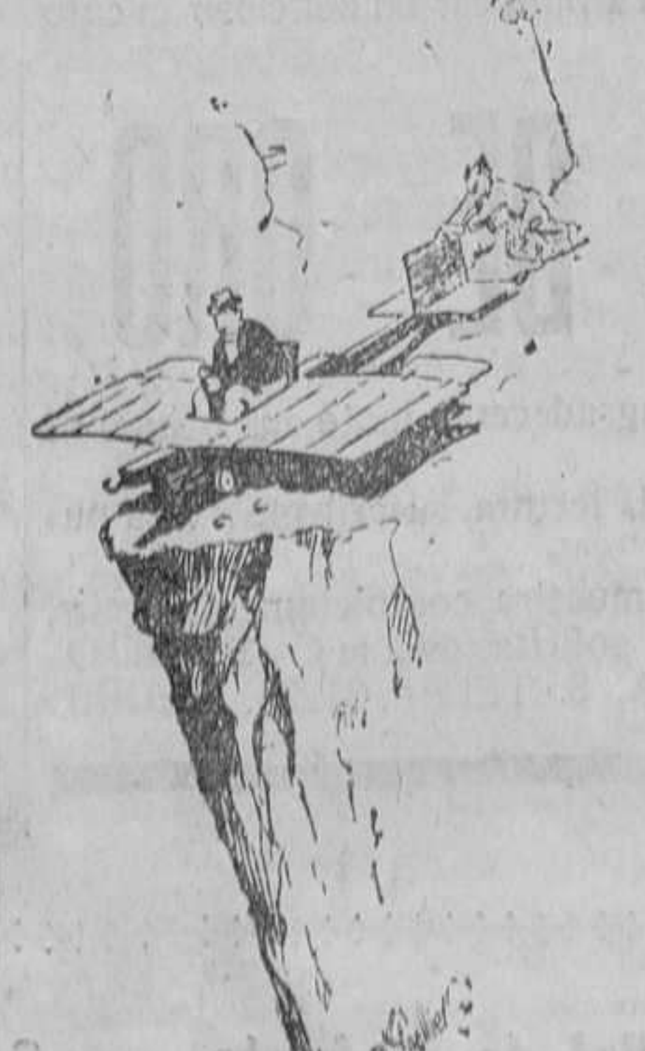
El constructor del planeador.— ¡U, dame un buen empujón, y veremos si vuelvo o no vuelvo en seguida.