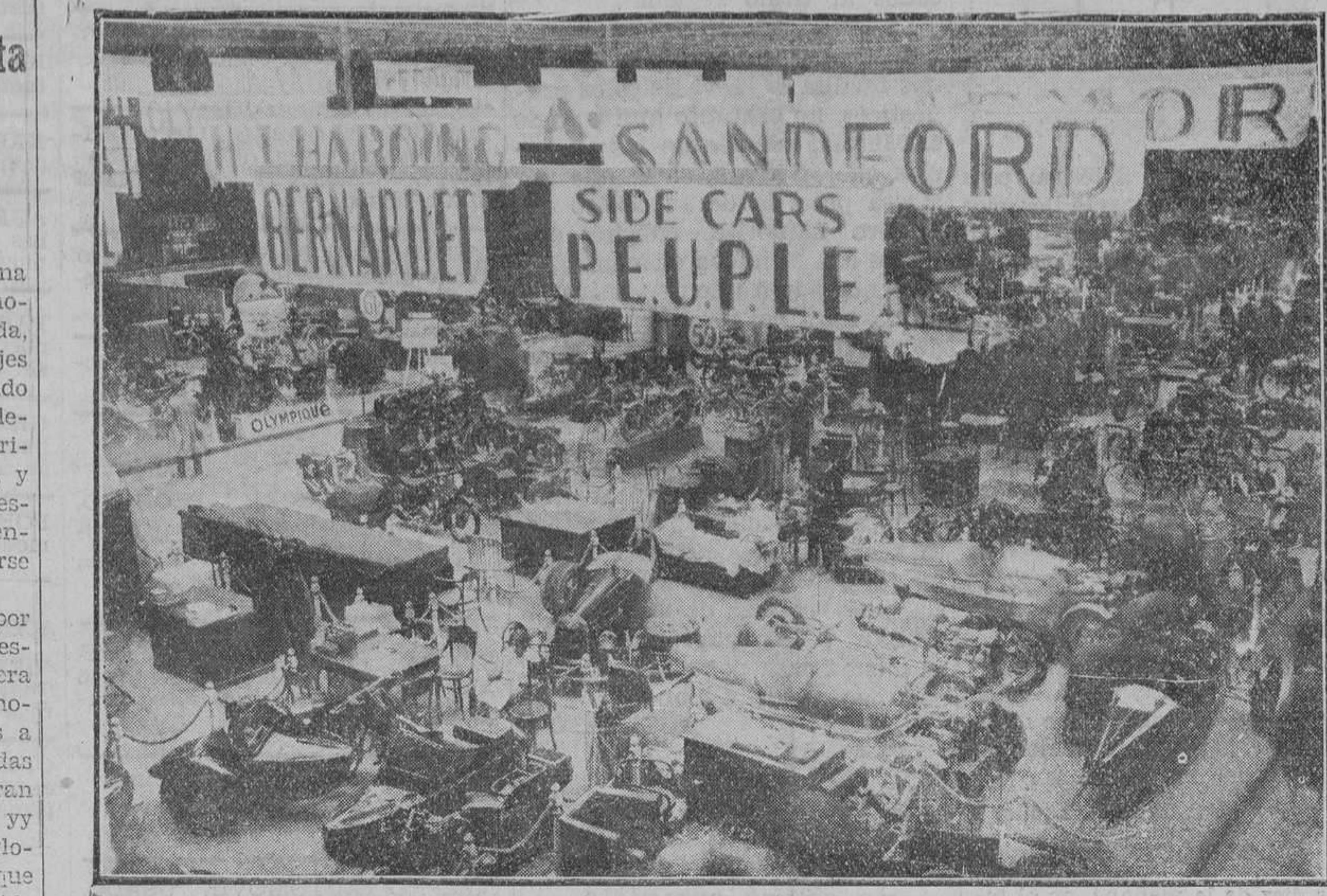
La acción de la moto y del ciclo, recientemente inaugurado.

que están en inmejorable condición física natural, llegarían en corto plazo a no cometer faltas en el campo y quedarse boquiabiertos cuando el árbitro les dice que "aquello" está castigado en el Reglamento.