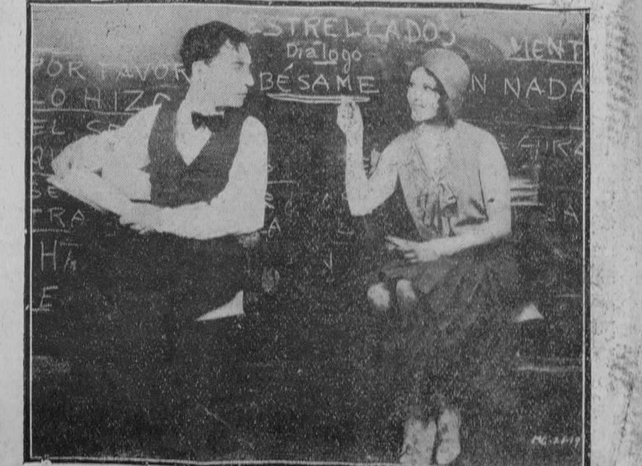
Raquel Torres enseña español a Buster Keaton. Ya veremos mañana el fruto de esos estudios en el film parlante "Estrellados", de la Metro-Goldwyn-Mayer.