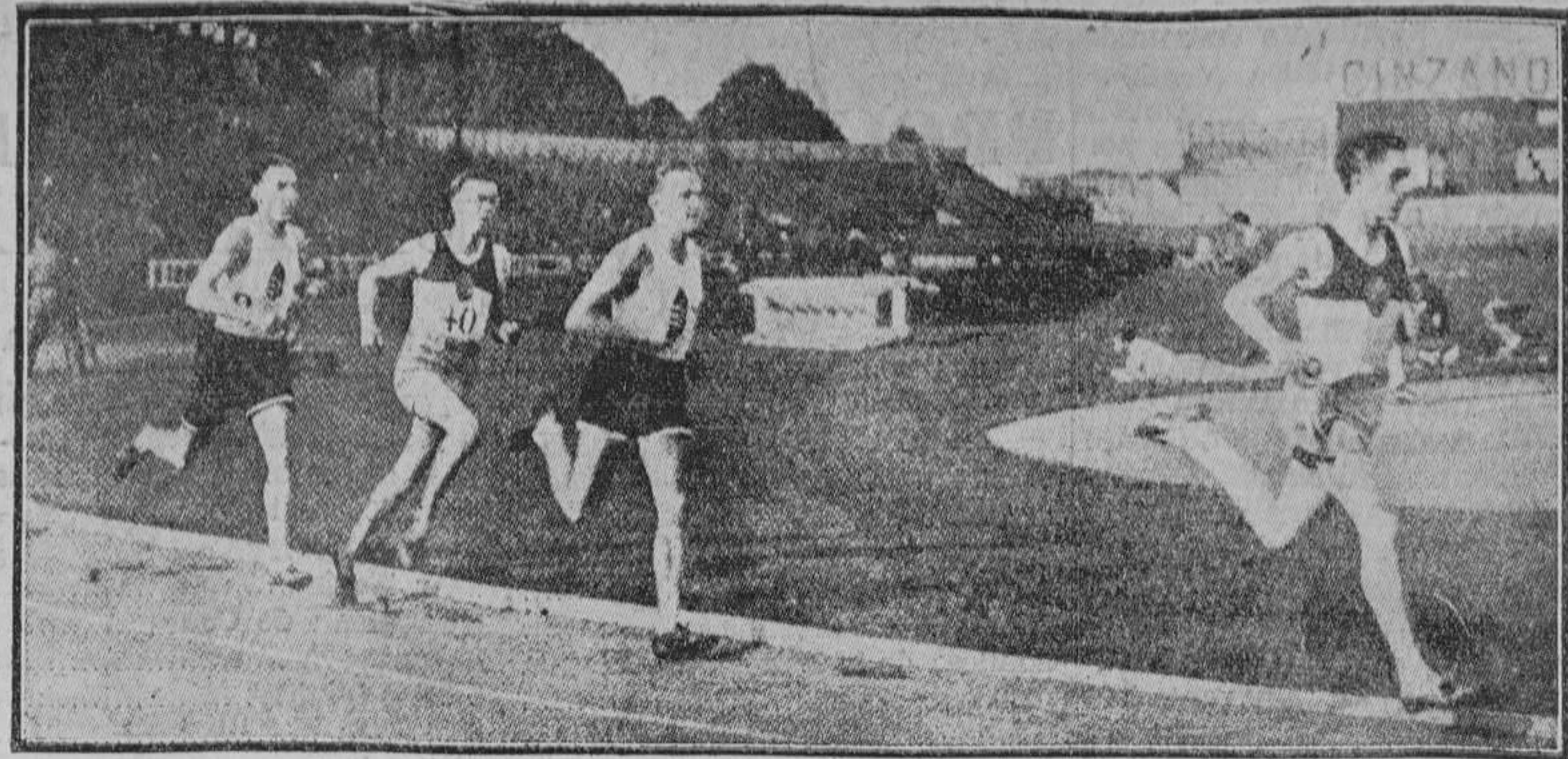
El magnífico estilo de Jules Ladoumègue—el "as" del momento—quedó bien patente en esta foto, marcando a la cabeza del grupo...

Los nuevos "tubos" balón Decíamos el día pasado que se ensayaban nuevos tubulares, unos tubulares balón propios para carreteras. El ensayo se efectuó. Ferdinand Drogo consiguió, sobre una ma-