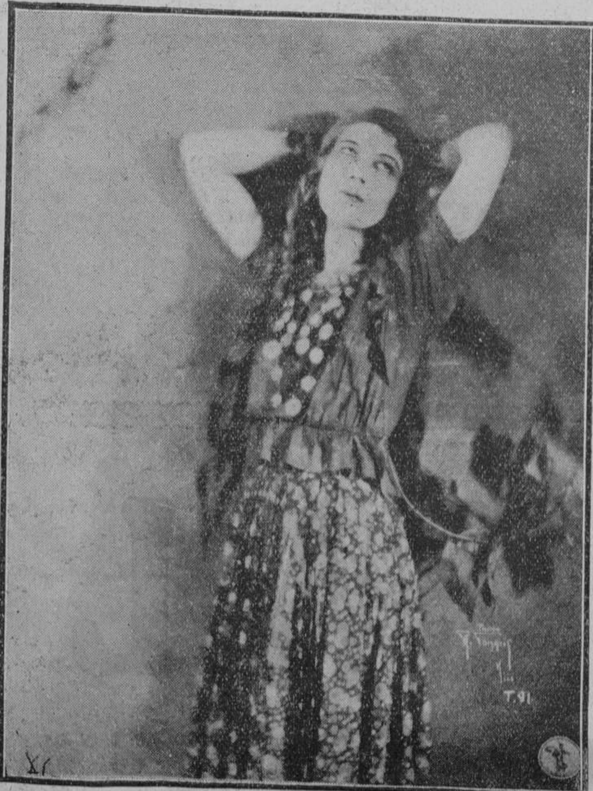
Thonny, protagonista del film sonoro ruso "Tarakanowa", de Renacimiento Films