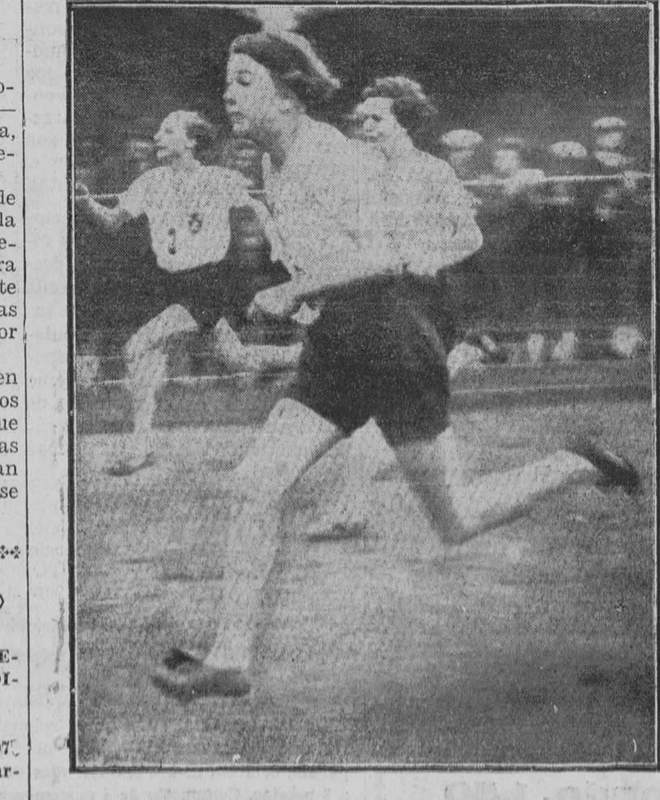
Atletismo femenino.—La llegada en unas bayonetas de los campeonatos ingleses.