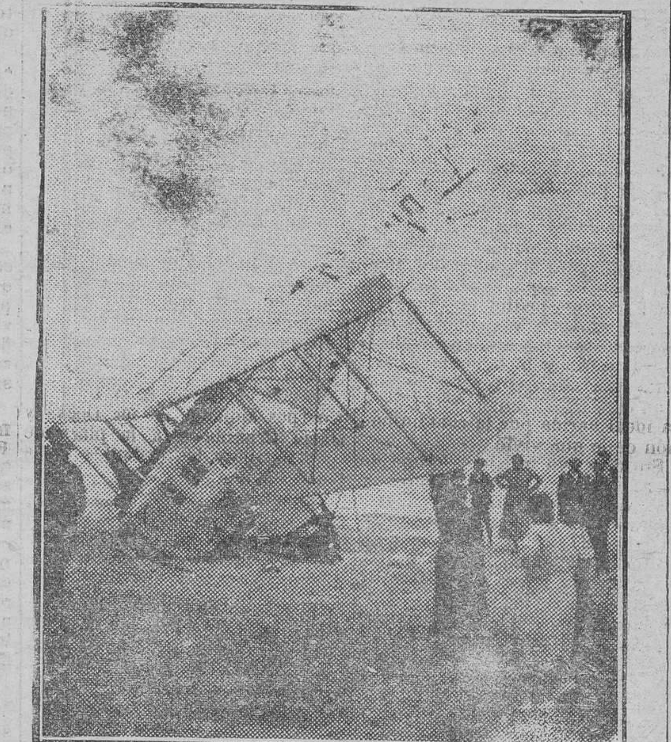
NOTAS GRAFICAS DE BARCELONA. Aeroplano de la línea Toulouse-Casablanca, que tuvo que aterrizar en la playa, cerca de Mataró (Barcelona), a causa de una avería del motor, y sin que, afortunadamente, sufrieran daño alguno sus tripulantes.