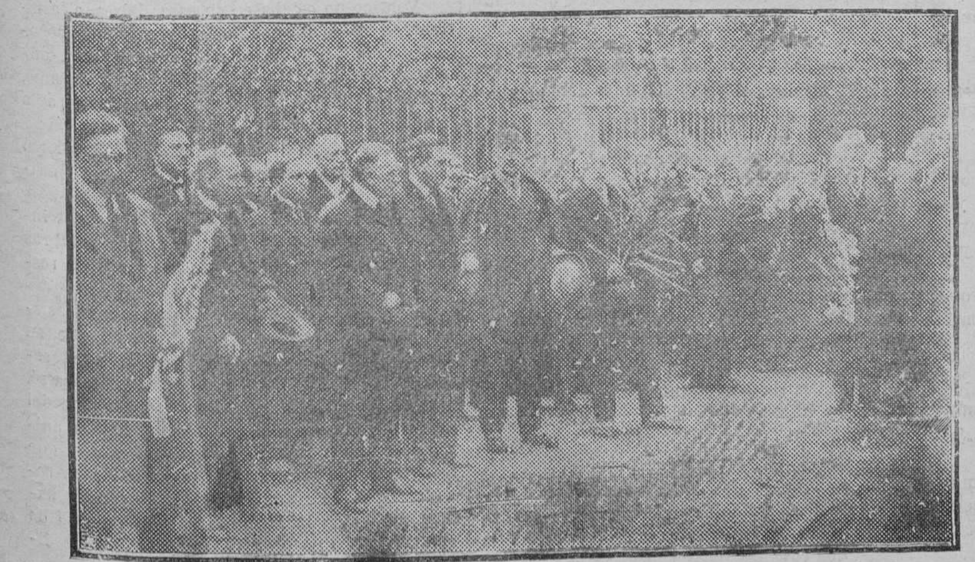
NOTAS GRAFICAS. Aniversario del armisticio, celebrado por la columna francesa.—Grupo de las autoridades francesas ante el monumento de la guerra, viendo colocar las coronas

dió el mundo debe leer diariamente LA OPINION, y en su sección de anuncios por palabras encontrará siempre asuntos que pueden convenirle