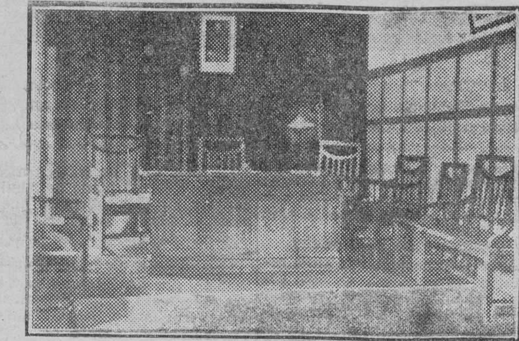
Sala de un Tribunal para niños, español.

Funciona ya la institución en ocho capitales españolas: Santander, Valencia, Barcelona, Murcia, Bilbao, Almería Zaragoza y Tarragona; tienen ya en función el Tribunal para menores incurso en toda suerte de delitos y faltas, y las observaciones concretas y prácticas realizadas por los encargados de su aplicación no hacen sino confirmar día tras día la importancia y trascenden-