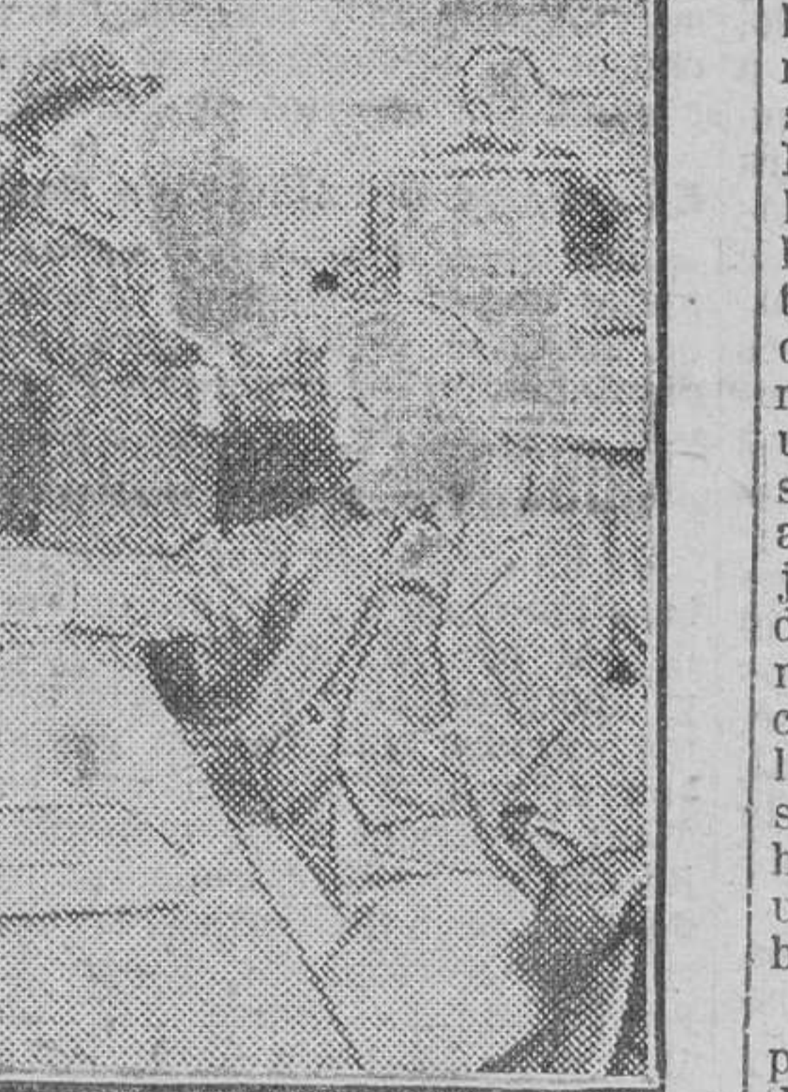
Un Tribunal de niños en Norteamérica.

hay tiempo sobrado para que nuestra sociedad olvide los mejores propósitos. Por ello, y sin trahora de las ventajas de la ley, queremos hacer hincapié en uno de sus aspectos, el que más importa a nuestra modesta propaganda de hoy: la función social de los visitantes e ins-