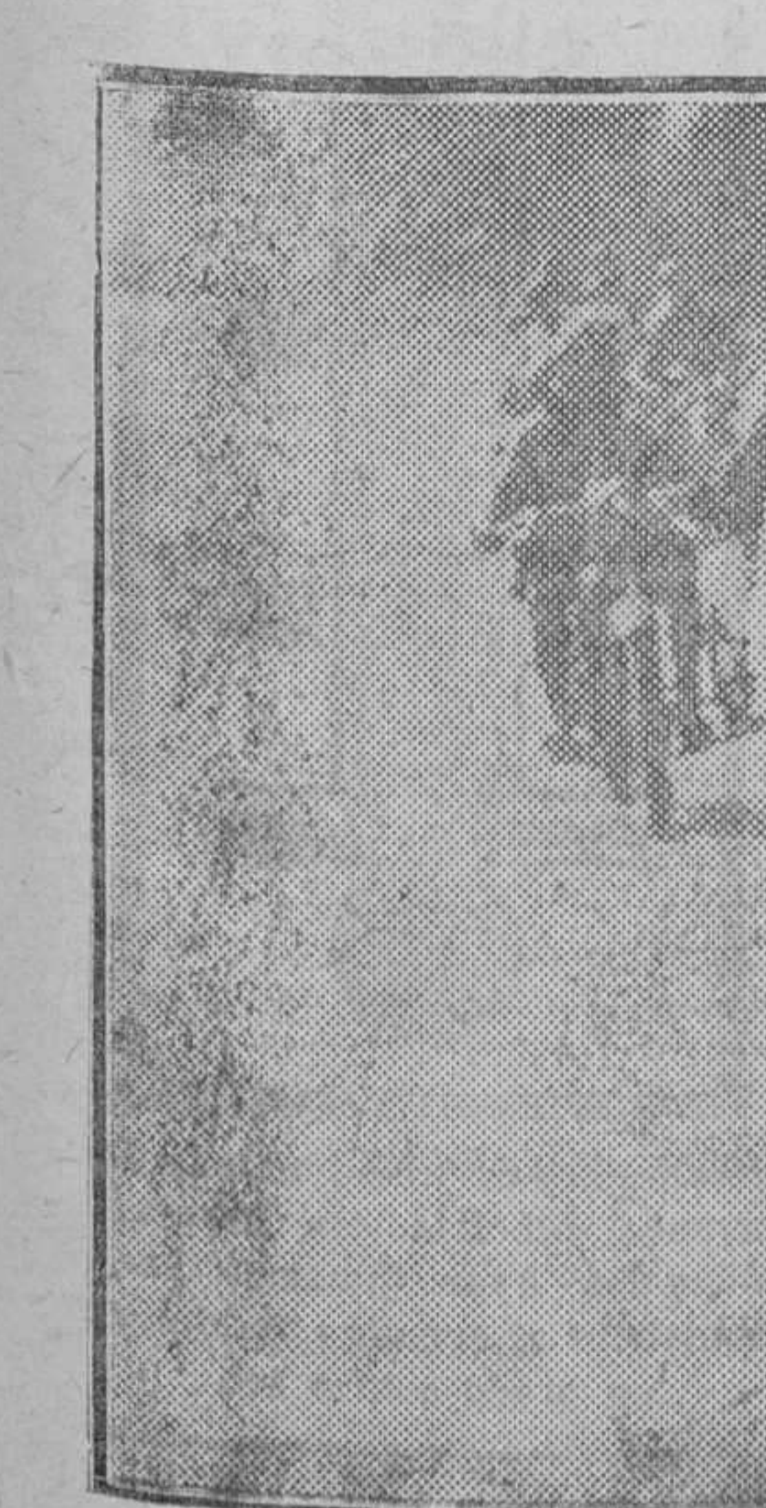
Mussió y Jener se destacaron en las costas de San Pol y marcharon juntos durante kilómetros...

Todas las noches registrarán los precios de a diario: 5 pesetas la butaca.