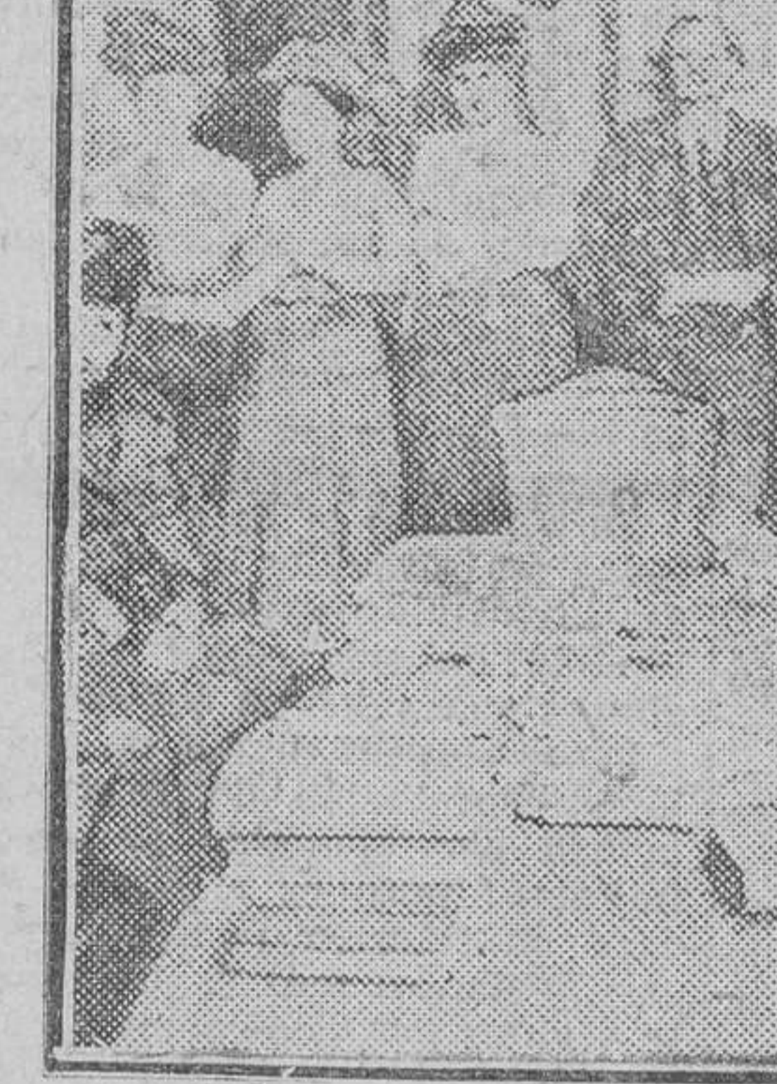
Un Tribunal de niños en Norteamérica.

hay tiempo sobrado para que nuestra sociedad olvide los mejores propósitos. Por ello, y sin trahora de las ventajas de la ley, queremos hacer hincapié en uno de sus aspectos, el que más importa a nuestra modesta propaganda de hoy: la función social de los visitantes e ins-