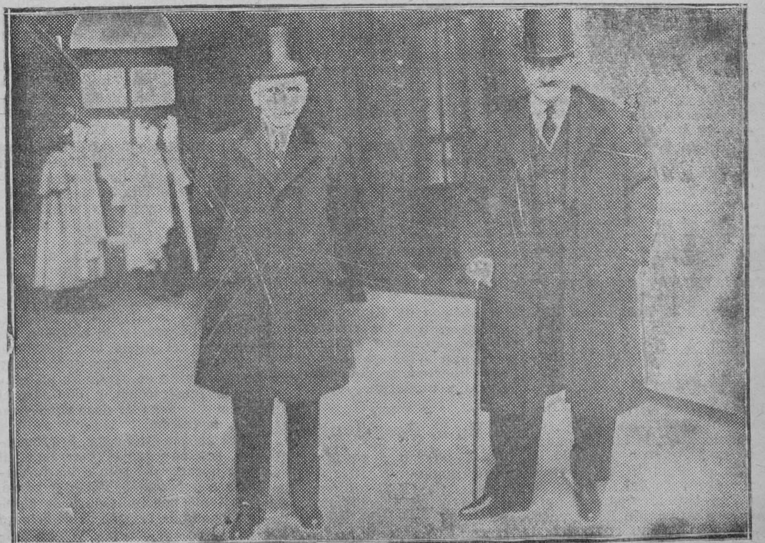
El conde de Romanones y D. Melquiades Alvarez saliendo de Palacio, después de haber hecho entrega al Rey del documento que publicamos en otro lugar del periódico.

En igual período del año 1922 las importaciones ascendieron solamente a 218.176.000 francos y las exportaciones a 311.046.000 francos.—E.