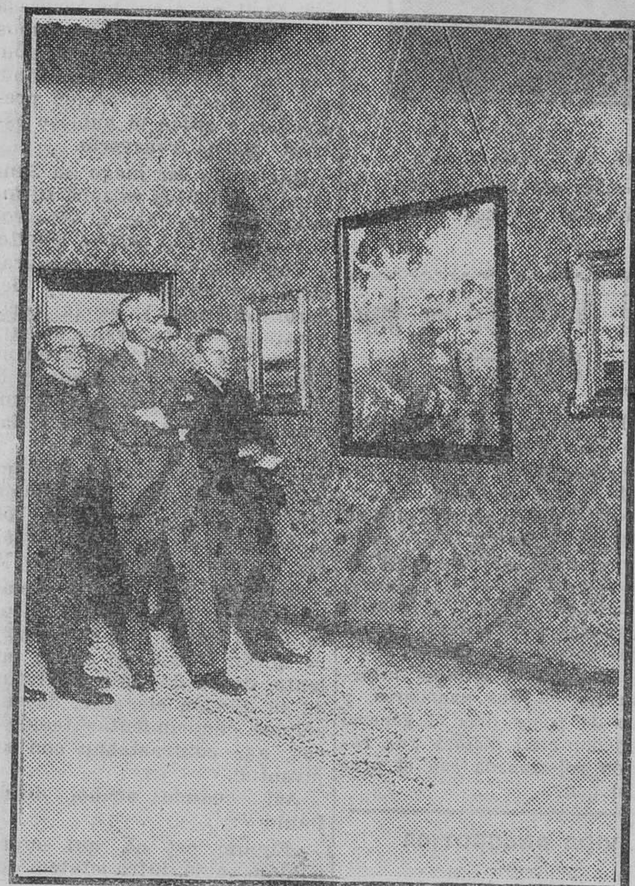
La Exposición Meifren, en el Circolo de Bellas Artes.

En resumen: un arte probo, tranquilo, que nada aporta, pero que ocupa un lugar muy decoroso; un arte que no asusta a los tradicionalistas vueltos hacia el convencionalismo de la escuela, y que, a la vez, puede ser contemplado sin irritación por los que guardan en la retina visiones más sutiles y más hondas. Un arte al que perjudica desde luego el recuerdo de los paisajistas arriba citados, pero que queda muy por encima de las incursiones pictóricas de los que se dedican a pintar paisajes porque no saben dibujar una nariz de per-