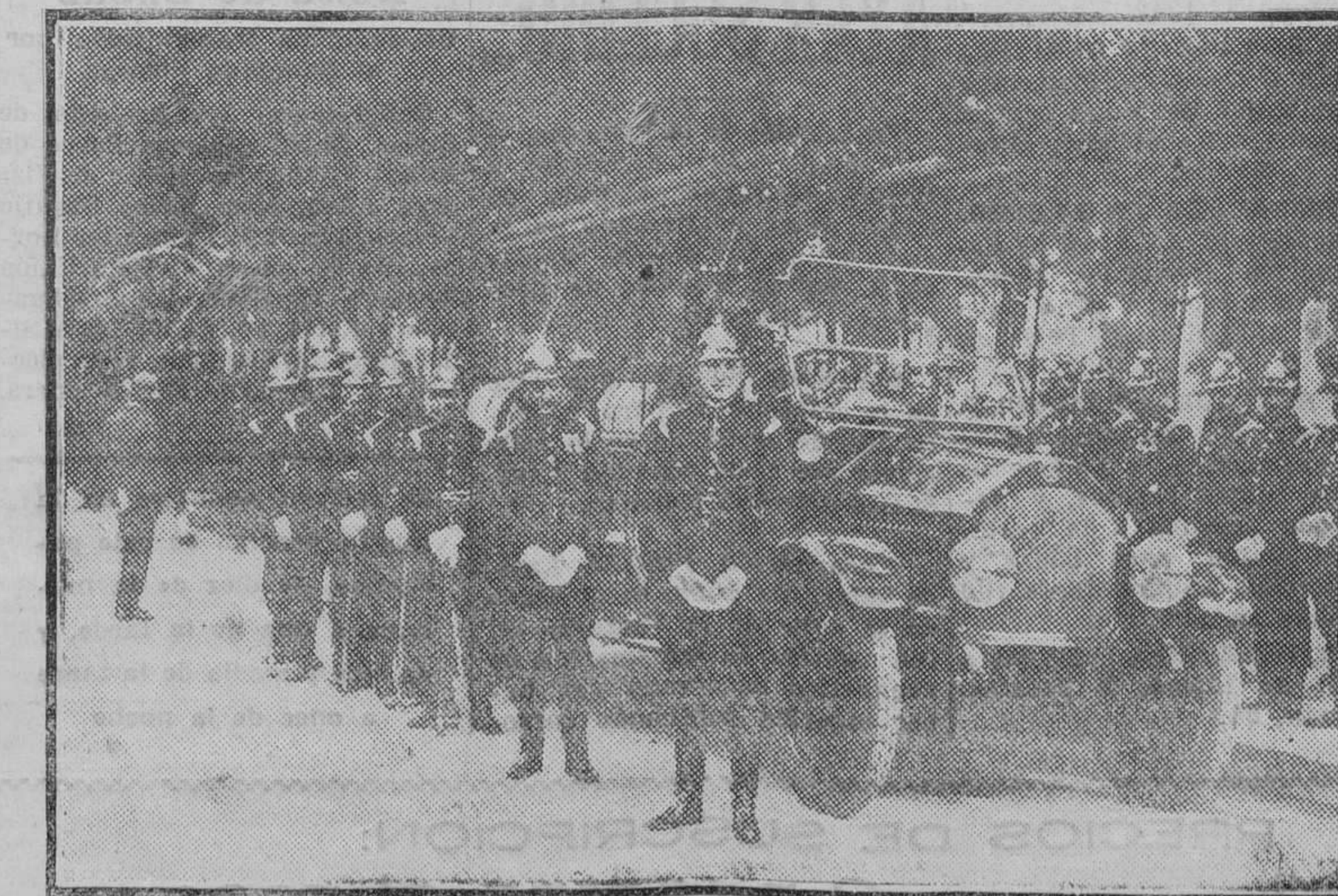
Una de las secciones del Cuerpo de Bomberos formada para ser revista por el alcalde.

No hay negocio sin publicidad. Si administras bien tus intereses, anúnciate en LA OPINION y centuplicarás tus ganancias