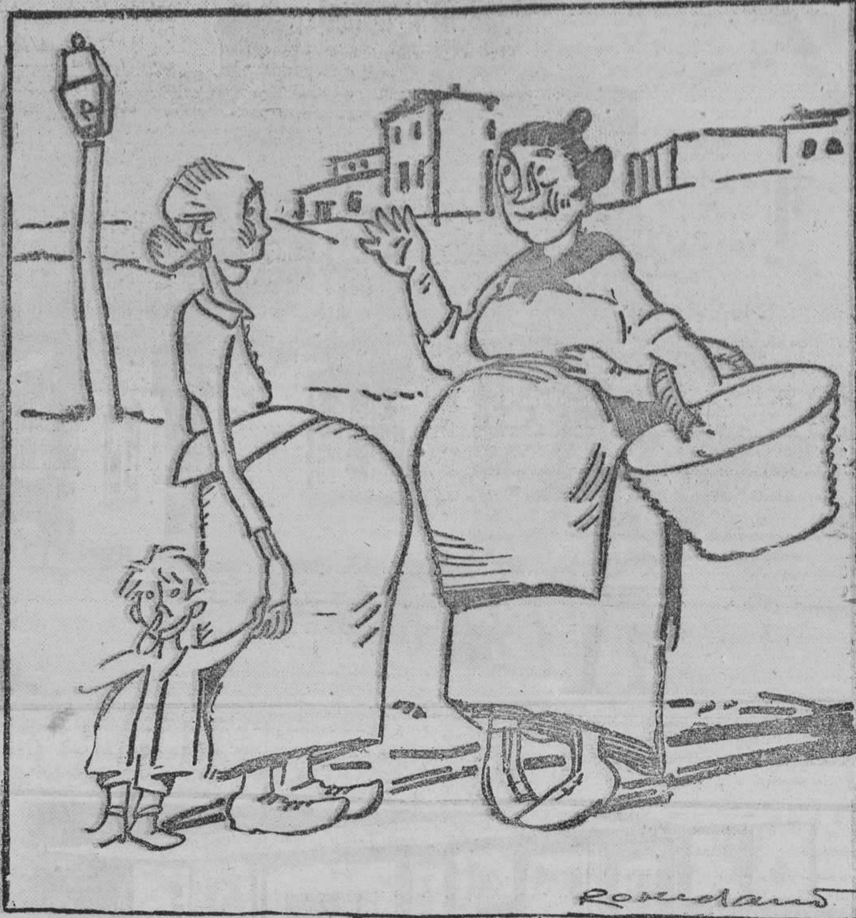
UNA VOZ INFANTIL (Dentro).—Oye: he oído decir a mis papás que me van a comprar un traje con las 50 pesetas que traeré. Y a ti, ¿qué te compran?

fil. Un arte tal vez un poquito "pasado", precisamente cuando pretende rejuvenecerse. Pero, en lo que a nosotros atañe, siempre estimaremos en lo mucho que vale ese, buen deseo. Margarita NELKEN Teléfono 30-85 M.