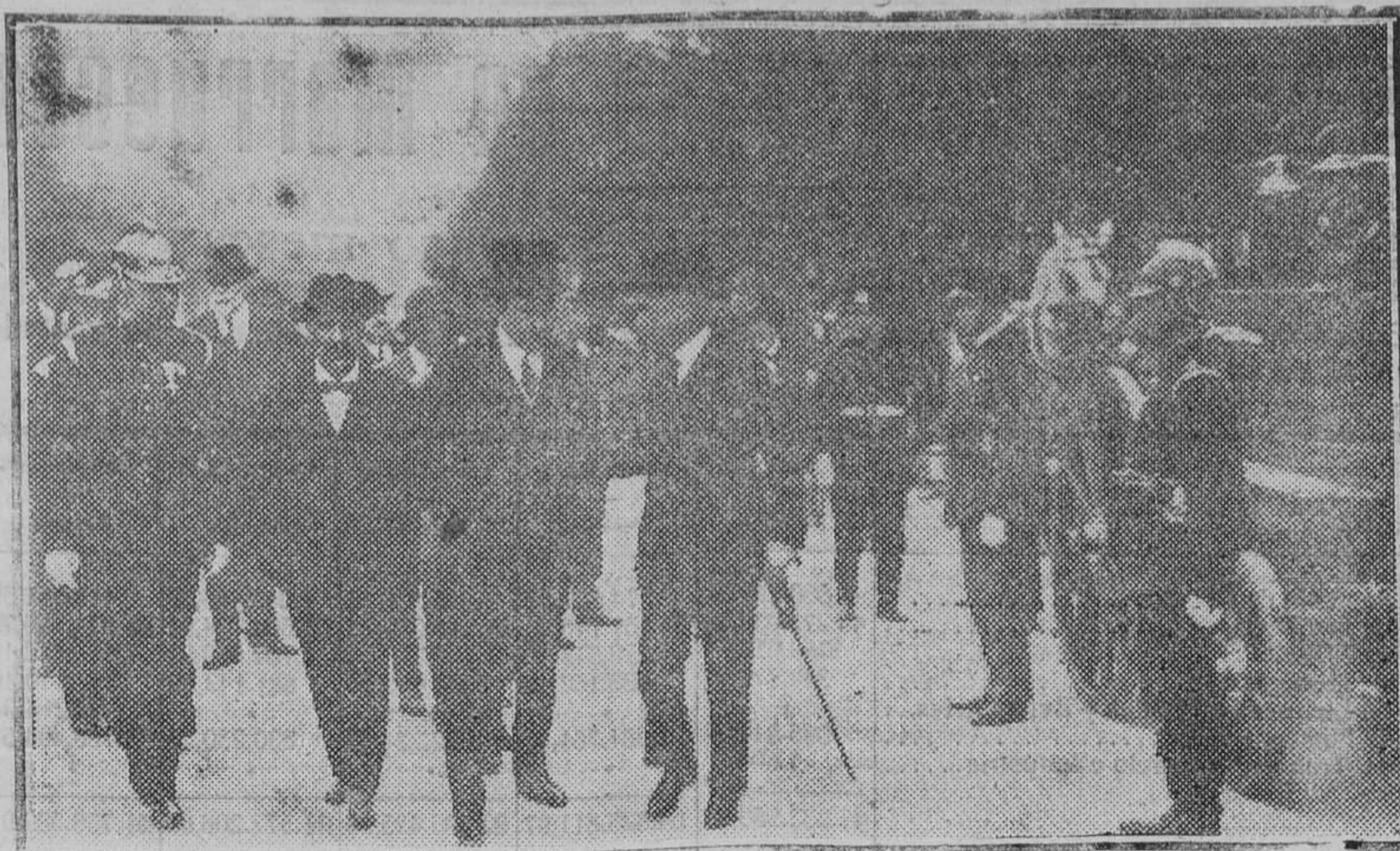
El alcalde de Madrid pasando revista al Cuerpo de Bomberos en la Castellana.

¿Sabrán algunos lo que escriben? Juan DEL HUERTO