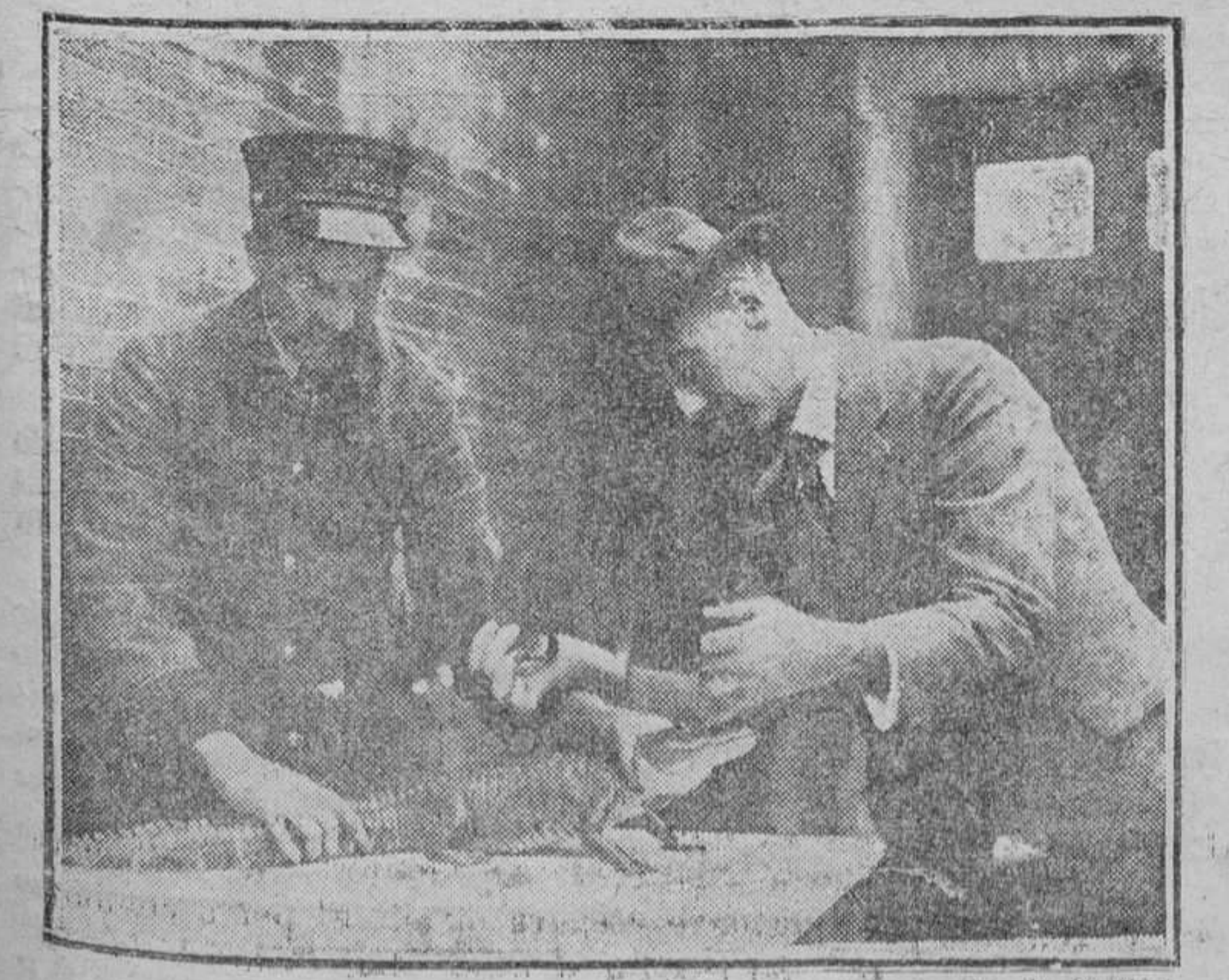
Con un vulgar lagarto se puede fabricar, como lo demuestra la fotografía, un terrible monstruo antediluviano para exhibir en cintas cinematográficas. El método ha sido ideado por el doctor Dittmars, conservador del Parque Zoológico de Nueva York.