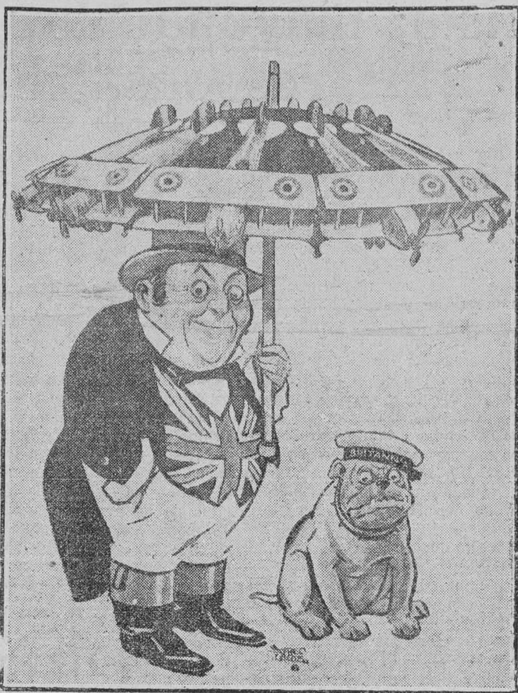
JOHN BULL.—La seguridad es lo primero. ("London Opinion", de Londres.)