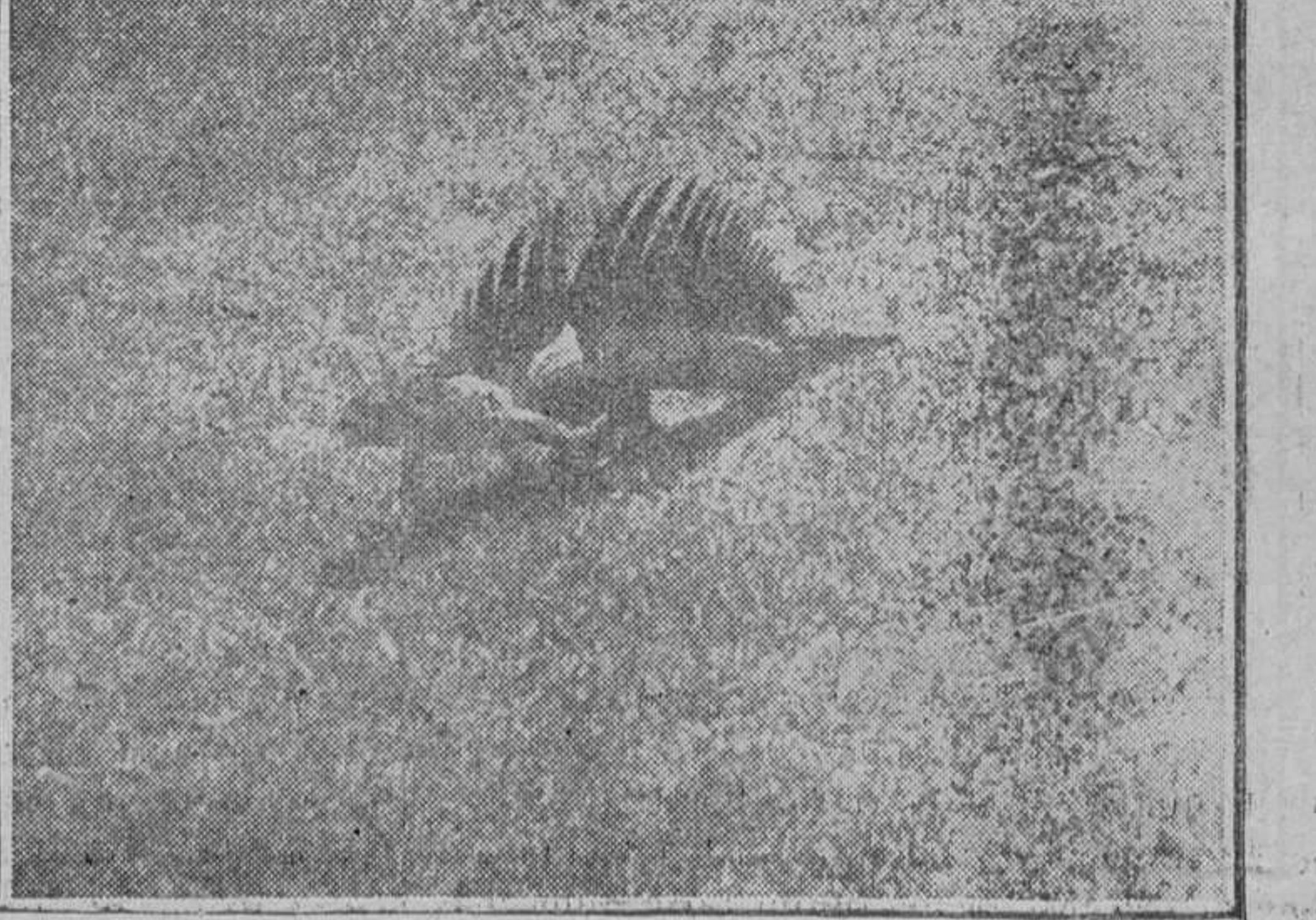
El infeliz lagarto convertido ya en terrible monstruo antediluviano. Aumentado en la pantalla, el inofensivo animal se aparece a los espectadores como un espantoso dinosaurio de un tamaño de 90 pies.