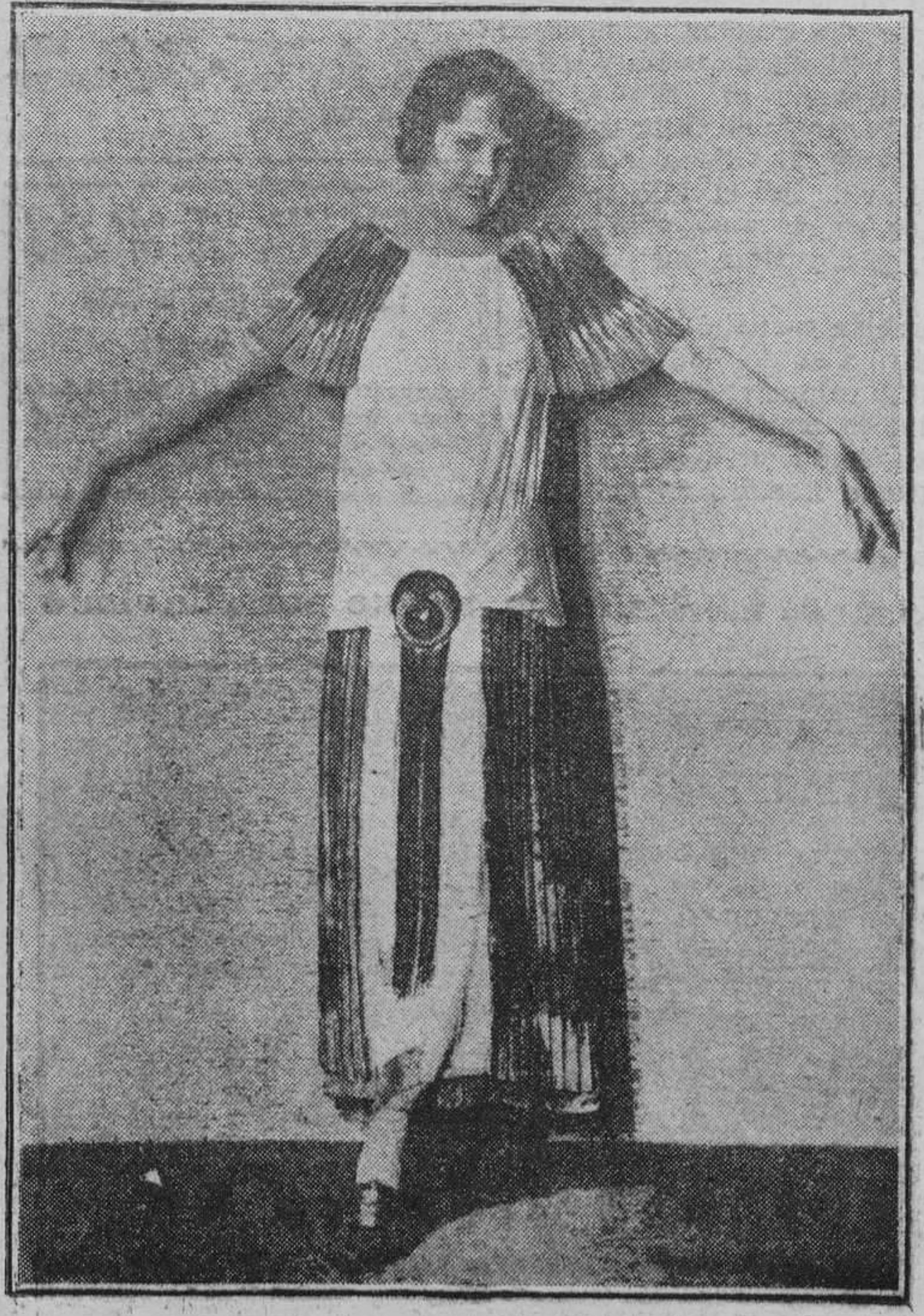
MODAS.—Precio de tarde para señora. Los paneles de la esclavina son de colores brillantes, metálicos. El resto del traje es de crepé Roshanara blanco.