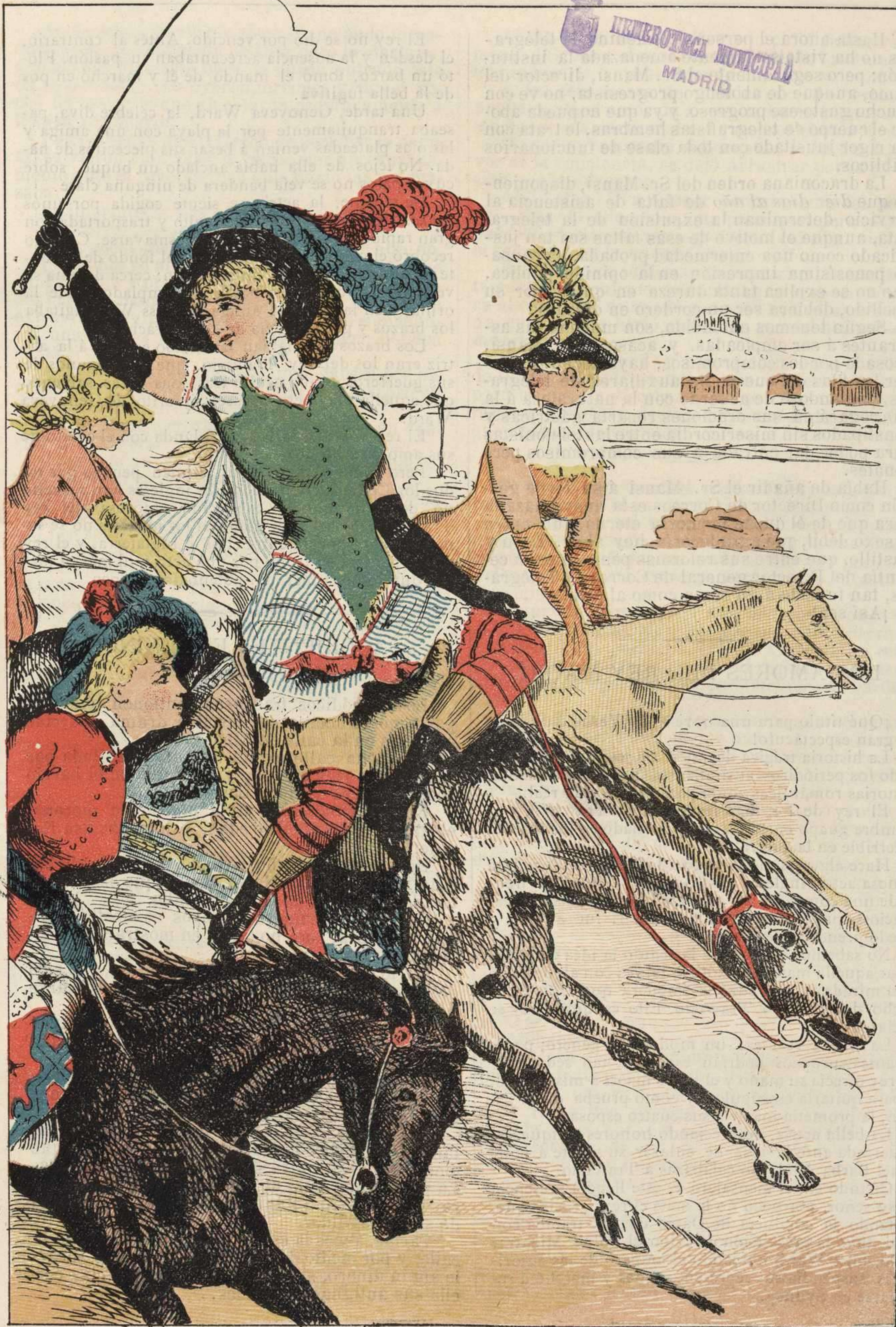
EL HIPÓDROMO DEL PORVENIR