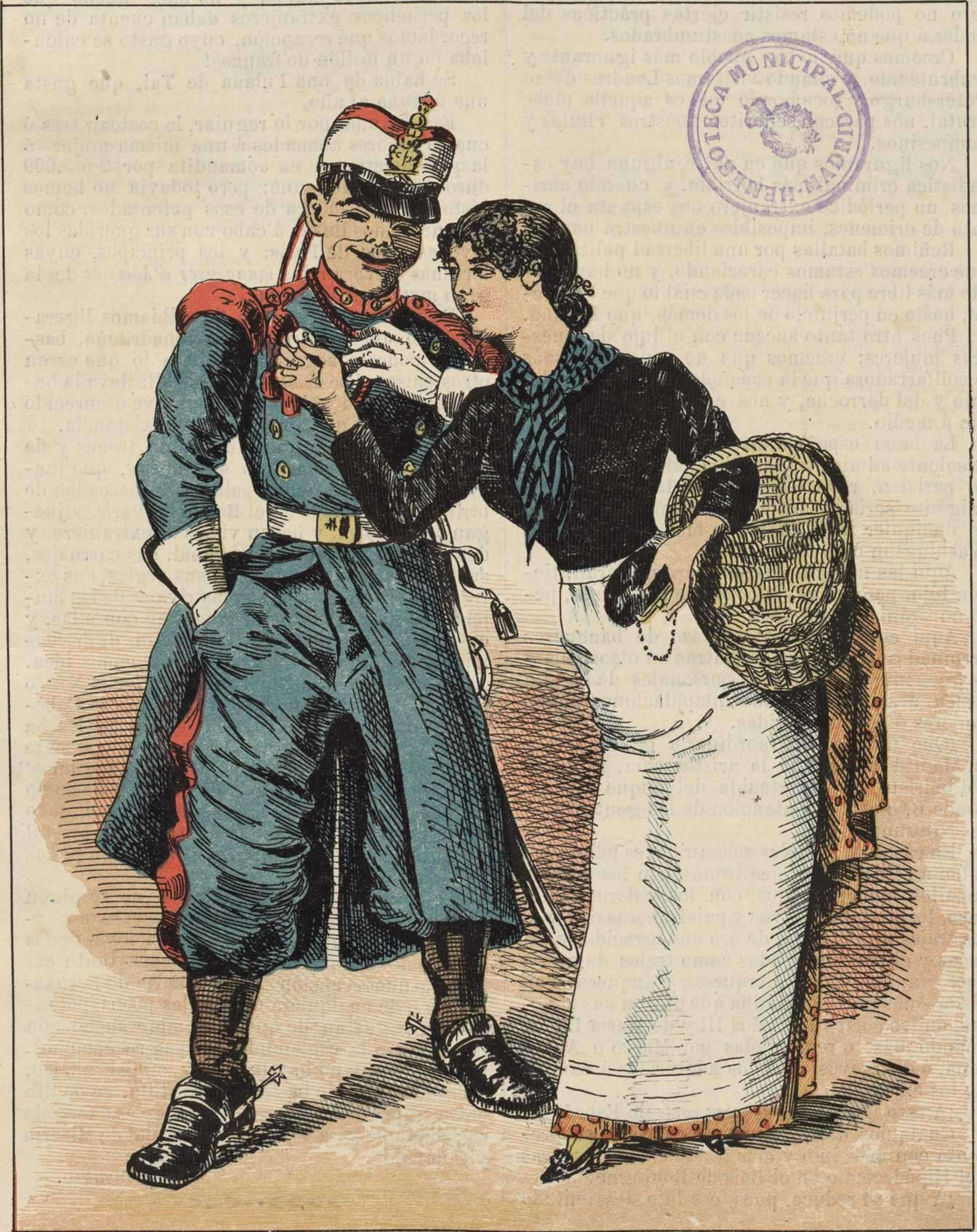
Y lo que me sobraba me lo guardaba un militar.