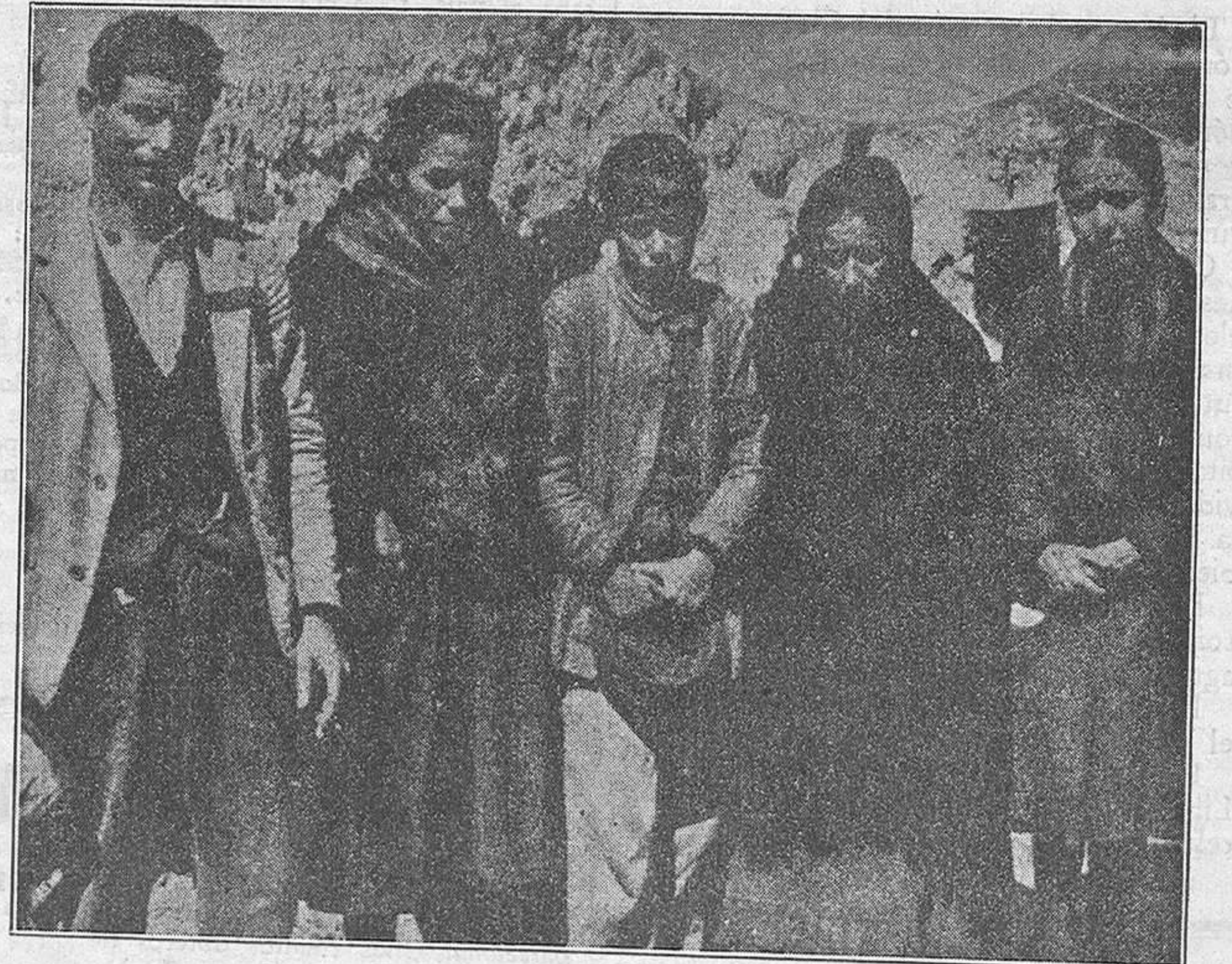
Las familias de las víctimas del crimen gubernamental de Pinos Puente.

¡Pero hay mucha hambre, mucha rabia, muchos muertos invengados en España! ¡Pero hay un pueblo devorado por una bandada de cuervos que roe sus entrañas! ¡Legalizar al hambre, al dolor y al coraje, no se les ha ocurrido aún a los socialistas!