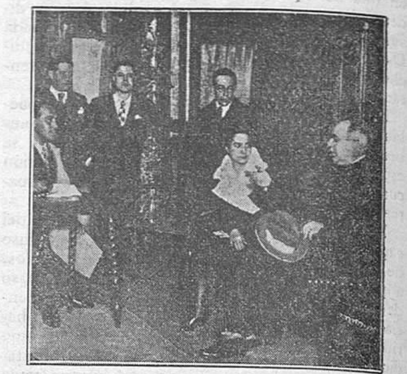
El excelentísimo señor Presidente ante la Xirgu y cómicos de su compañía.

lor al juego de la gallina ciega, que siempre manosea, digo picotea, los mismos huevos y que luego de tanto ser manoseado, digo, picoteado, para nada sirven.