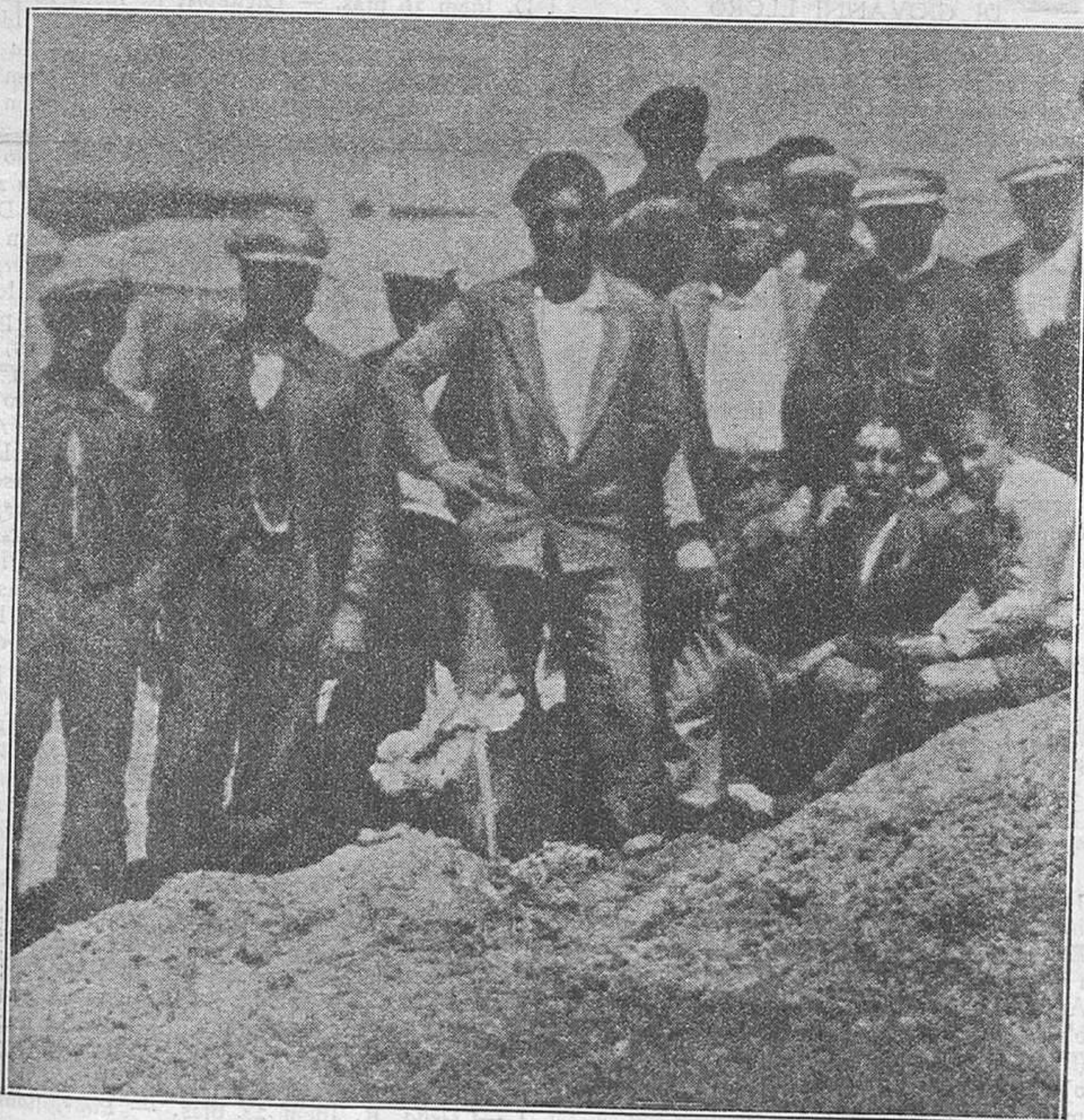
Lugar del cementerio donde ha sido enterrada la pobre niña muerta por los sicarios de la República en Pinos Puente.

centes han caído. Mujeres, niños. Una criatura de pocos años asesinada por los cosacos de la República.