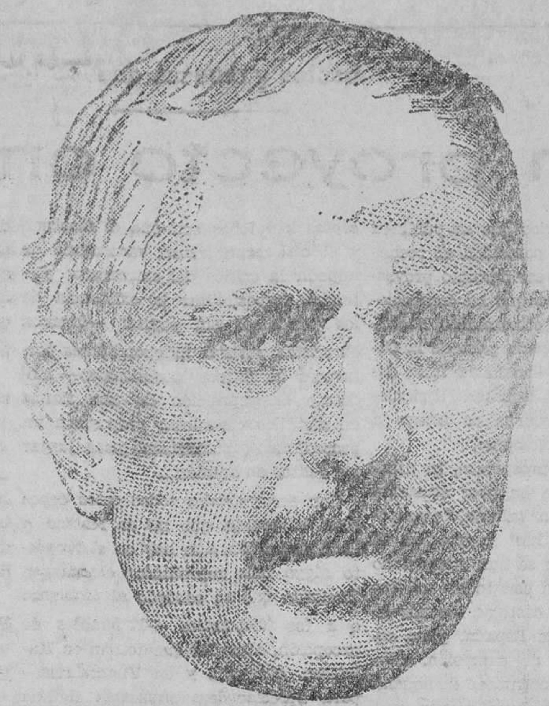
Estanislao Figueras, primer Presidente de la República de 1873