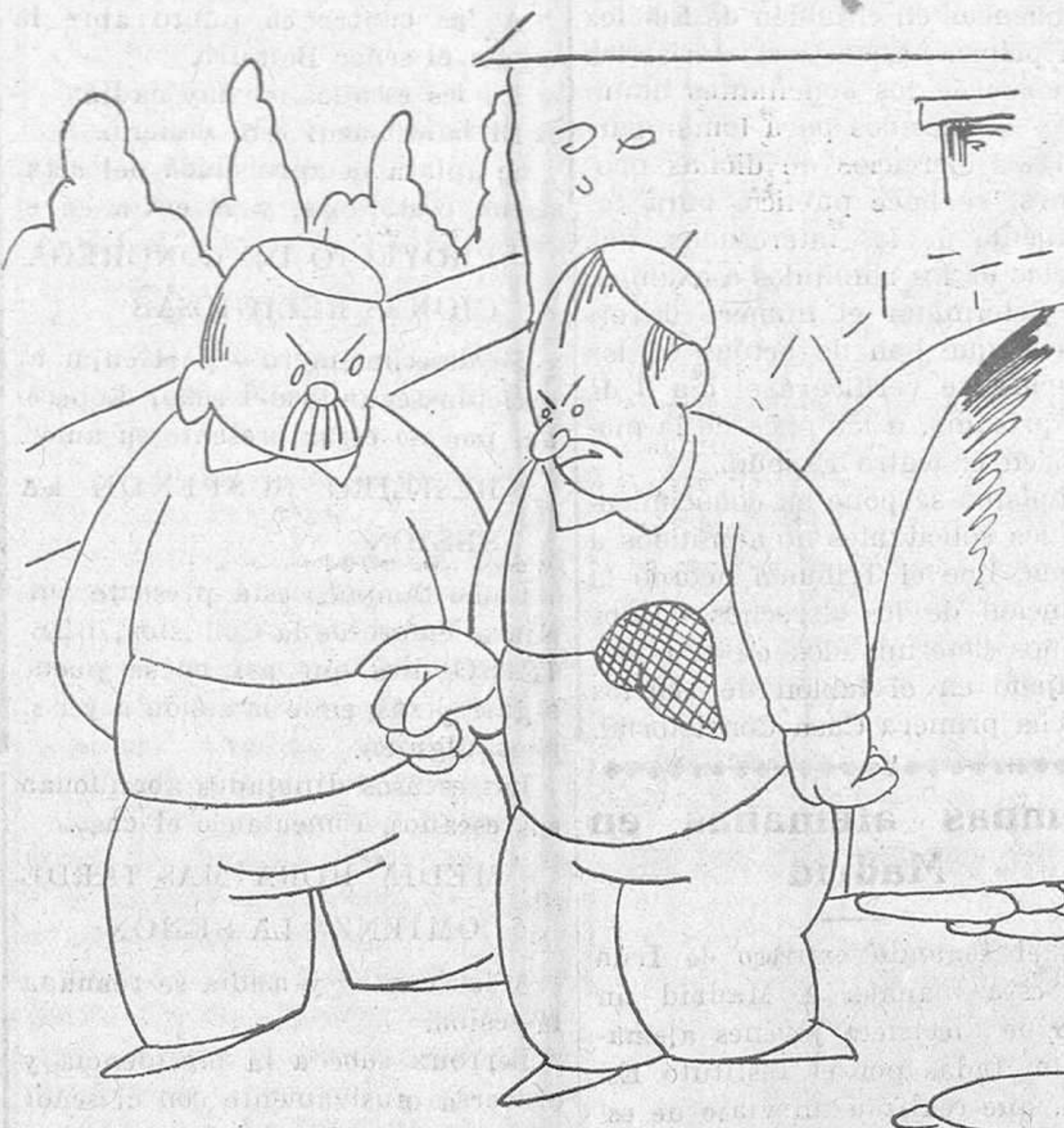
—Cuando yo era muchacho conocí a una muchacha que me volvió tonto. —¿Parece mentira, lo que dura la influencia de las mujeres!

—En efecto, hoy, día 30 de marzo actual, el juez de Instrucción, número 9, aún no ha resuelto...! Y eso que, en su providencia del día 23, ¡dos fechas anteriores...! a las que preceptúa la ley, nos cita el