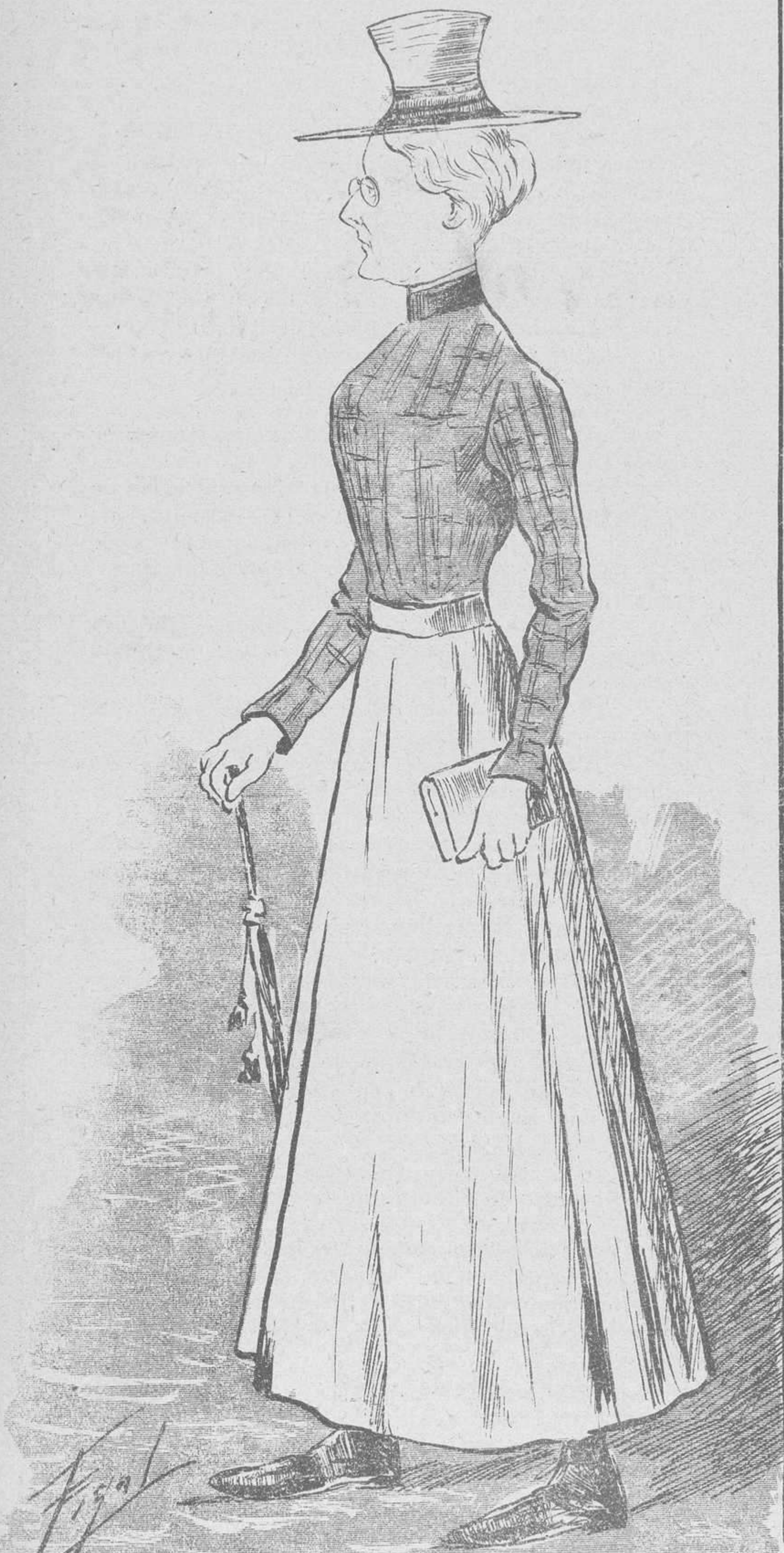
¿Recuerdan Vds. este tipo tan resalao?