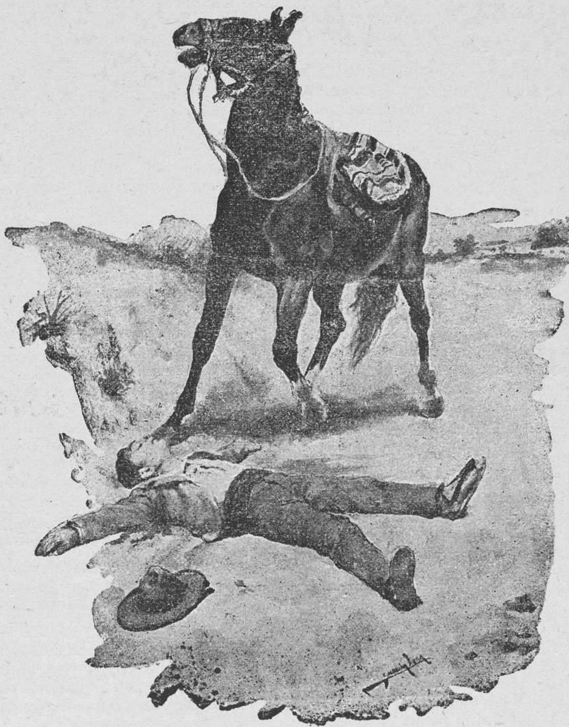
LA CAIDA (CUADRO DE MEDINA VERA)