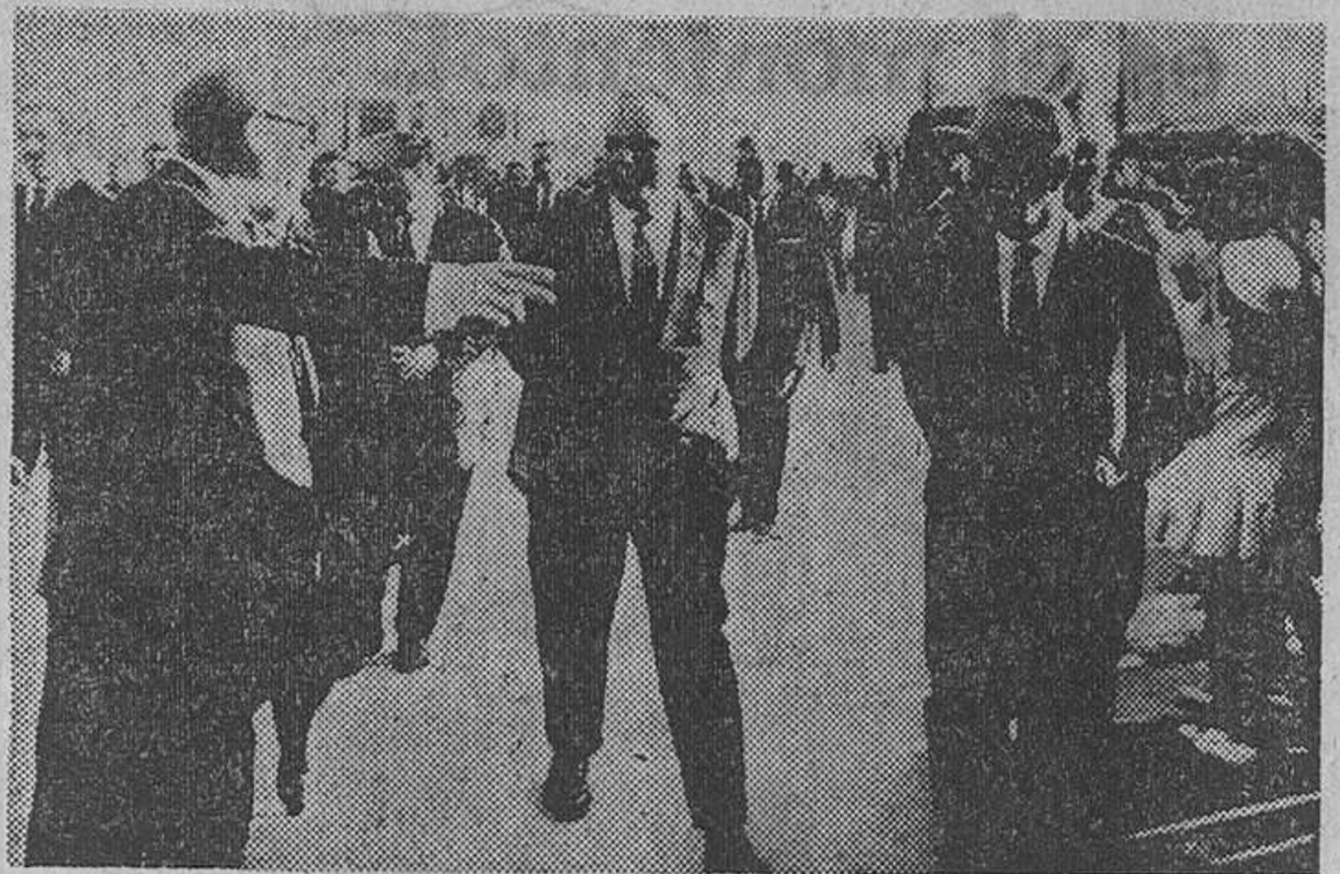
El Ferrol del Caudillo. — El ministro de Información y Turismo, señor Fraga Iribarne, ha clausurado la Feria del Noroeste en esta ciudad. Un momento de la visita girada por el ministro, acompañado por las autoridades locales.