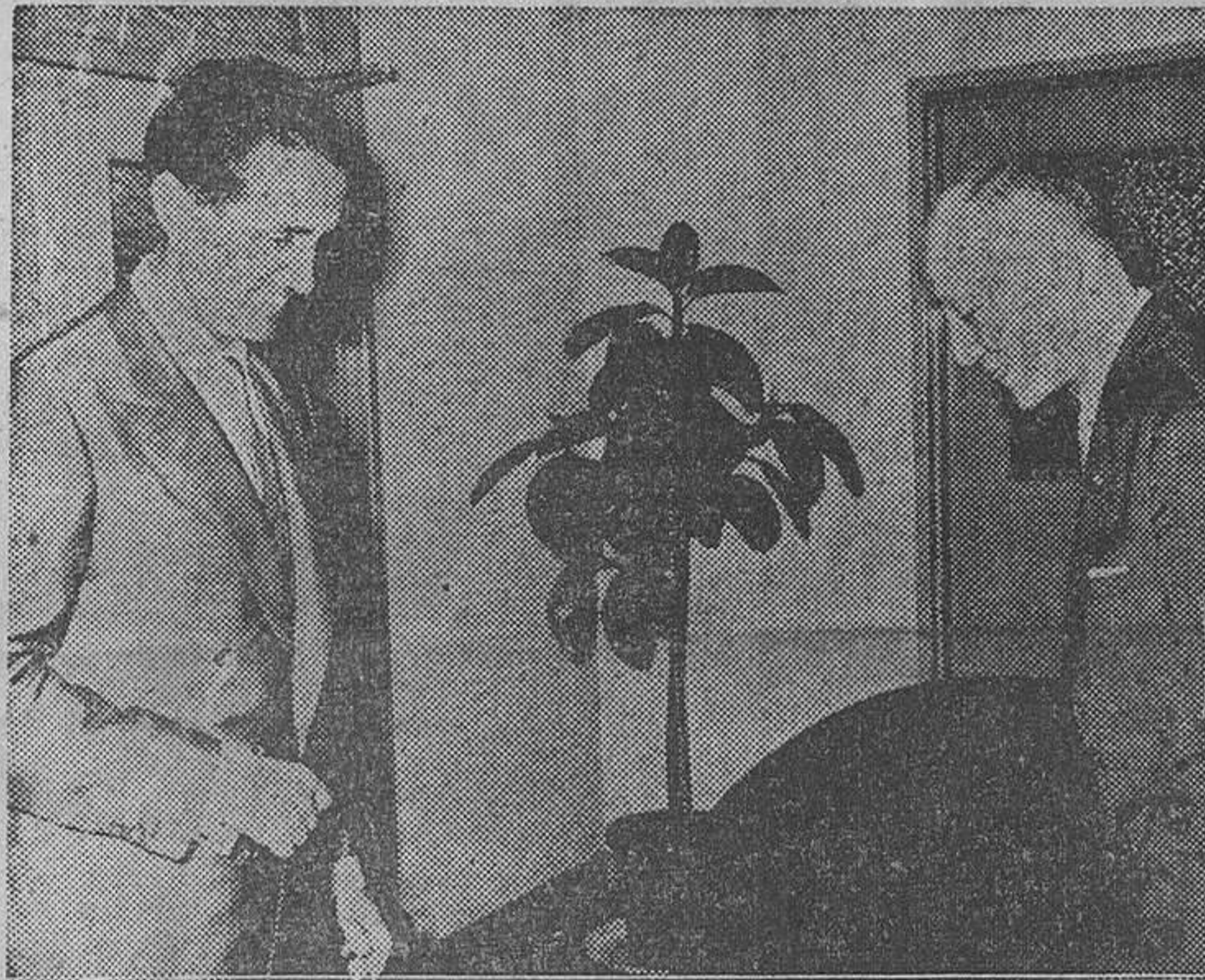
Tokio. — El ministro de Industria, señor López Bravo, visita a su colega japonés, señor Yoshio Sakurachi, durante la visita que el ministro español realiza al país nipón.