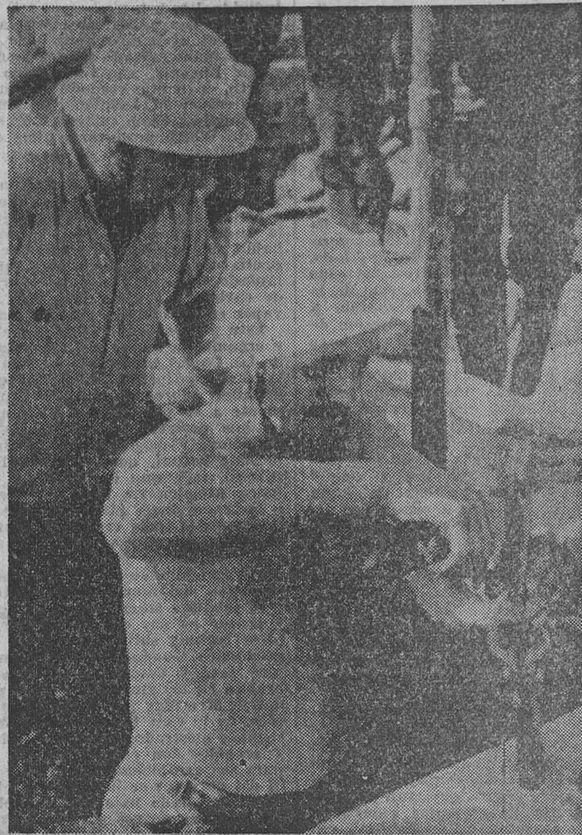
Champagnole. — Con cascos protectores, los hombres de los equipos de salvamento trabajan febrilmente en la excavación del segundo túnel, donde será colocado un nuevo tubo de comunicación.

Champagnole (Francia), 2. — La Radio y la Televisión francesas han lanzado esta noche llamamientos dirigidos a aquellas empresas en posesión de compresores de aire de gran potencia, rogándoles que se pongan inmediatamente en contacto con los responsables de las operaciones de salvamento en esta localidad.