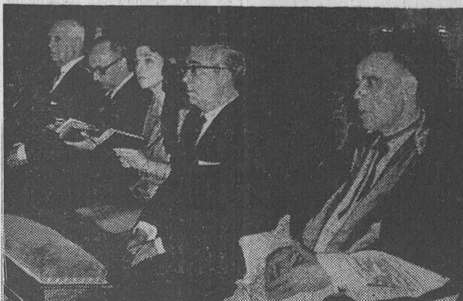
Las representaciones eclesiásticas y municipal en la Fiesta del Descenso en la Basílica de la Merced.

Celebróse ayer el solemne oficio votivo, con gran concurrencia de fieles