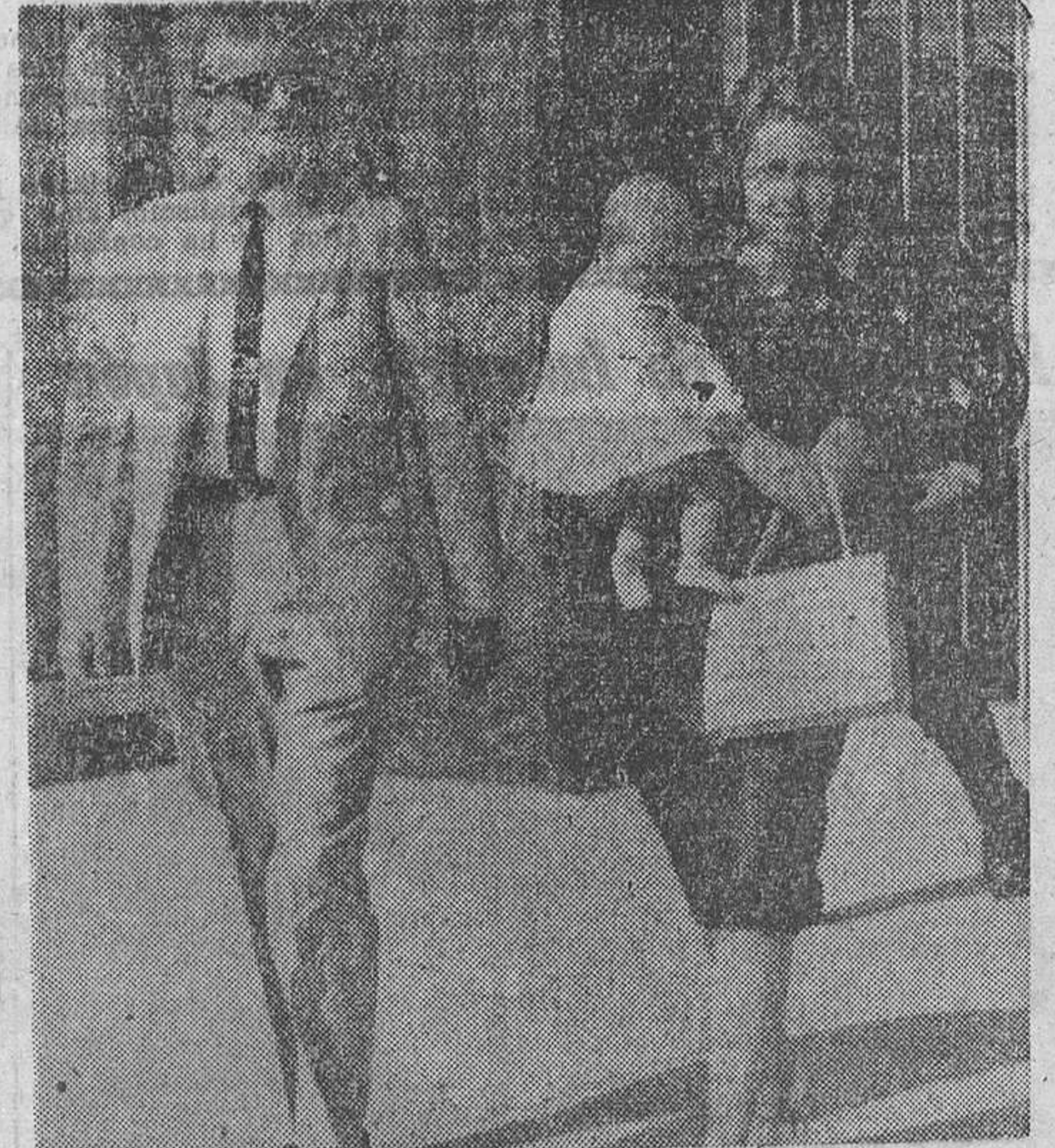
Madrid. — Han salido para Atenas los príncipes Juan Carlos de Borbón y Sofía de Grecia. En la fotografía, los príncipes dirigiéndose al avión con la pequeña princesa en brazos de su madre.