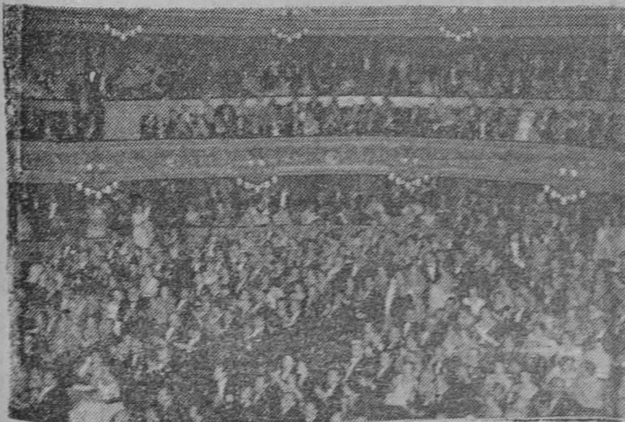
Aspecto de la platea y anfiteatro de nuestro primer coliseo, en el transcurso de la función del sábado. — La salida del público, tras la primera representación de los Festivales Wagner en el Liceo.

durante dichos festivales, rogamos reserven su mesa con anticipación.