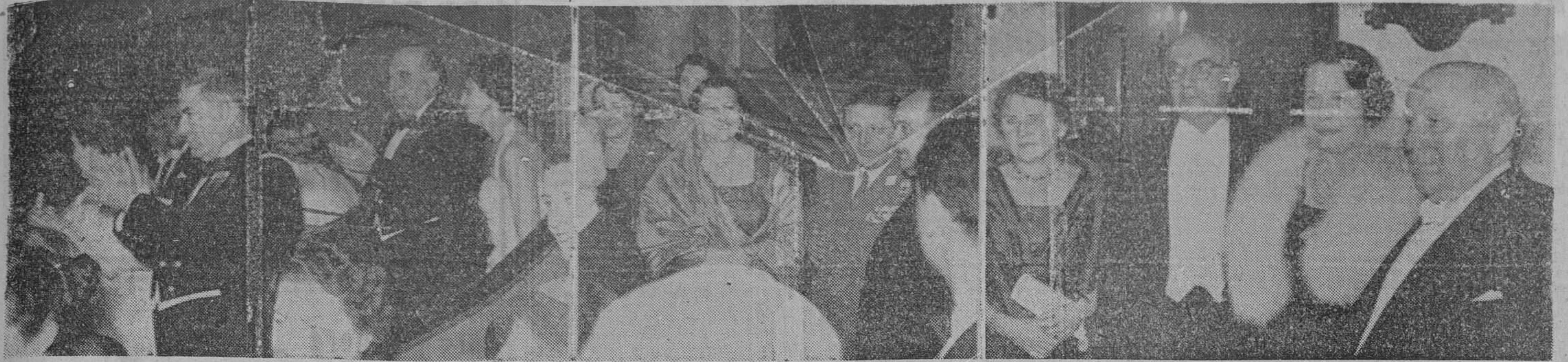
El Ministro del Aire, con el Gobernador civil de la provincia, durante la representación memorable de anteanoche. — El Capitan general, con su distinguida esposa y otras personalidades, en el salón de descanso del Gran Teatro del Liceo. — El Embajador de Alemania y el Cónsul general en Barcelona, acompañados de sus esposas, durante uno de los entreactos