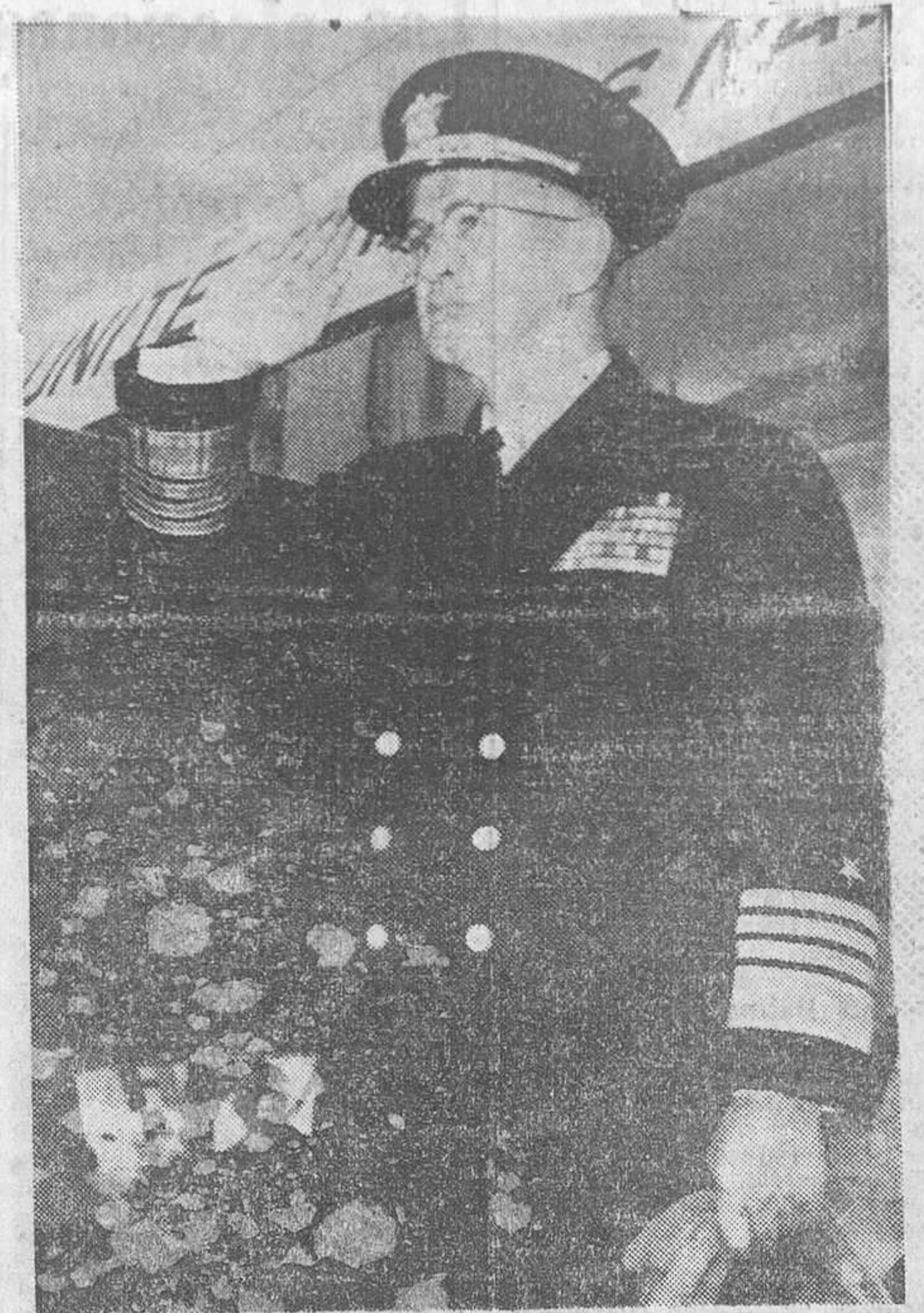
El Jefe de Operaciones Navales y miembro del Estado Mayor conjunto de los EE. UU., Almirante Robert B. Carney, saluda a las personalidades y público que le esperaban a su llegada al aeropuerto de Barajas.