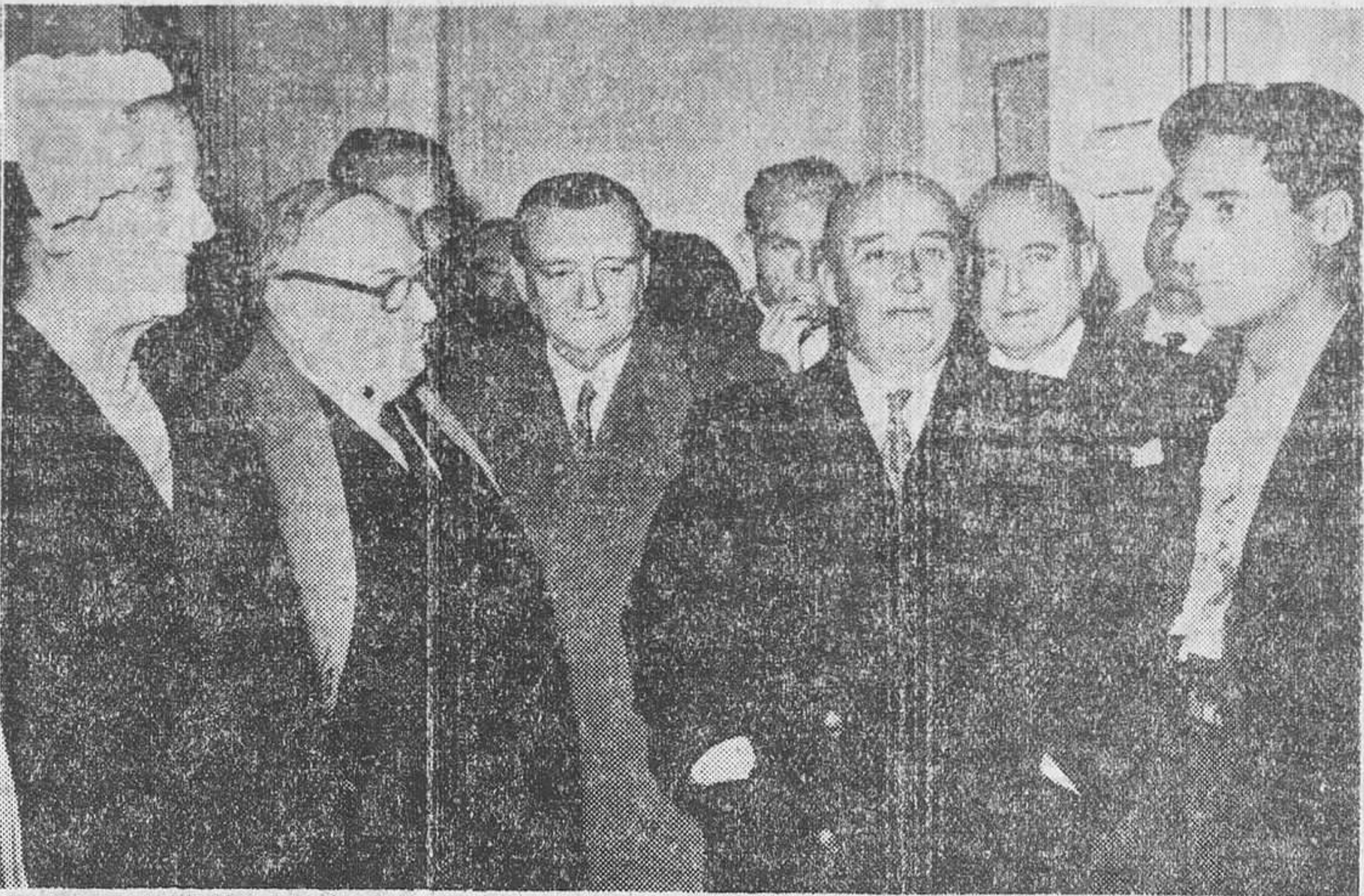
Madrid. — S. E. el Jefe del Estado recibe, en el palco de la plaza de las Ventas, a los diestros que tomaron parte en la corrida benéfica celebrada con motivo de la campaña de Navidad

EL CAUDILLO, EN LA CORRIDA A BENEFICIO DE LOS NECESITADOS MADRILEÑOS