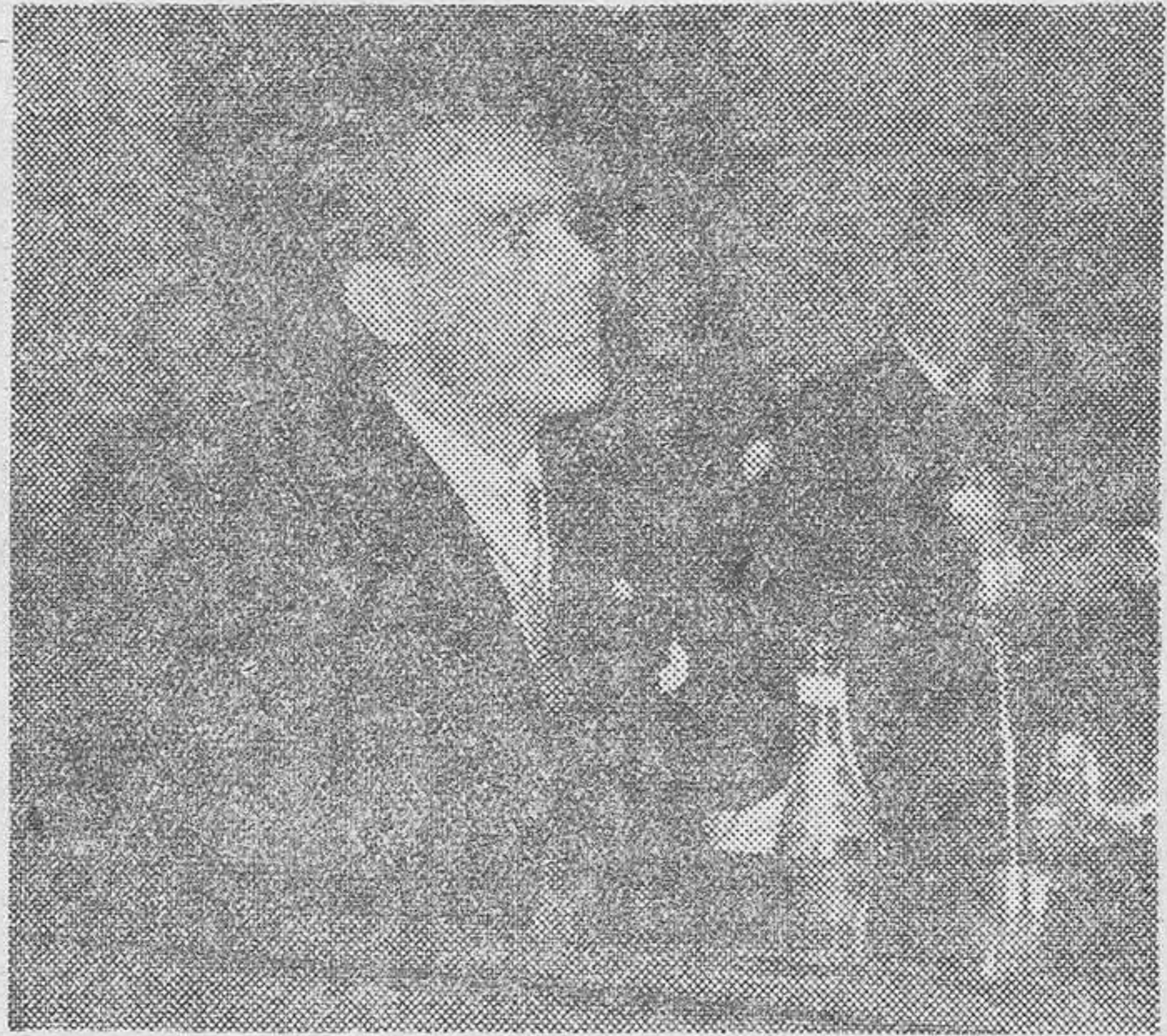
El señor Buxó, Marqués de Castell-Florite, durante su discurso

El señor Buxó pasa revista a la accidentada historia de nuestras Haciendas locales, que al principio —dice— no constituyeron verdadero problema para el Estado, pues cubrían sus necesidades fundamentales a base