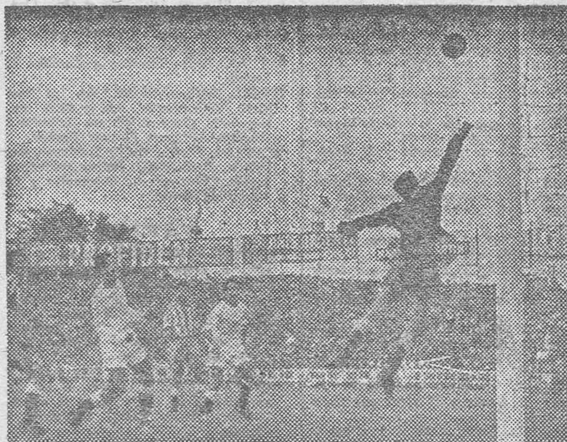
Una magnífica intervención de l guardameta españolista Trias, al despejar con el puño un saq ue de esquina madridista