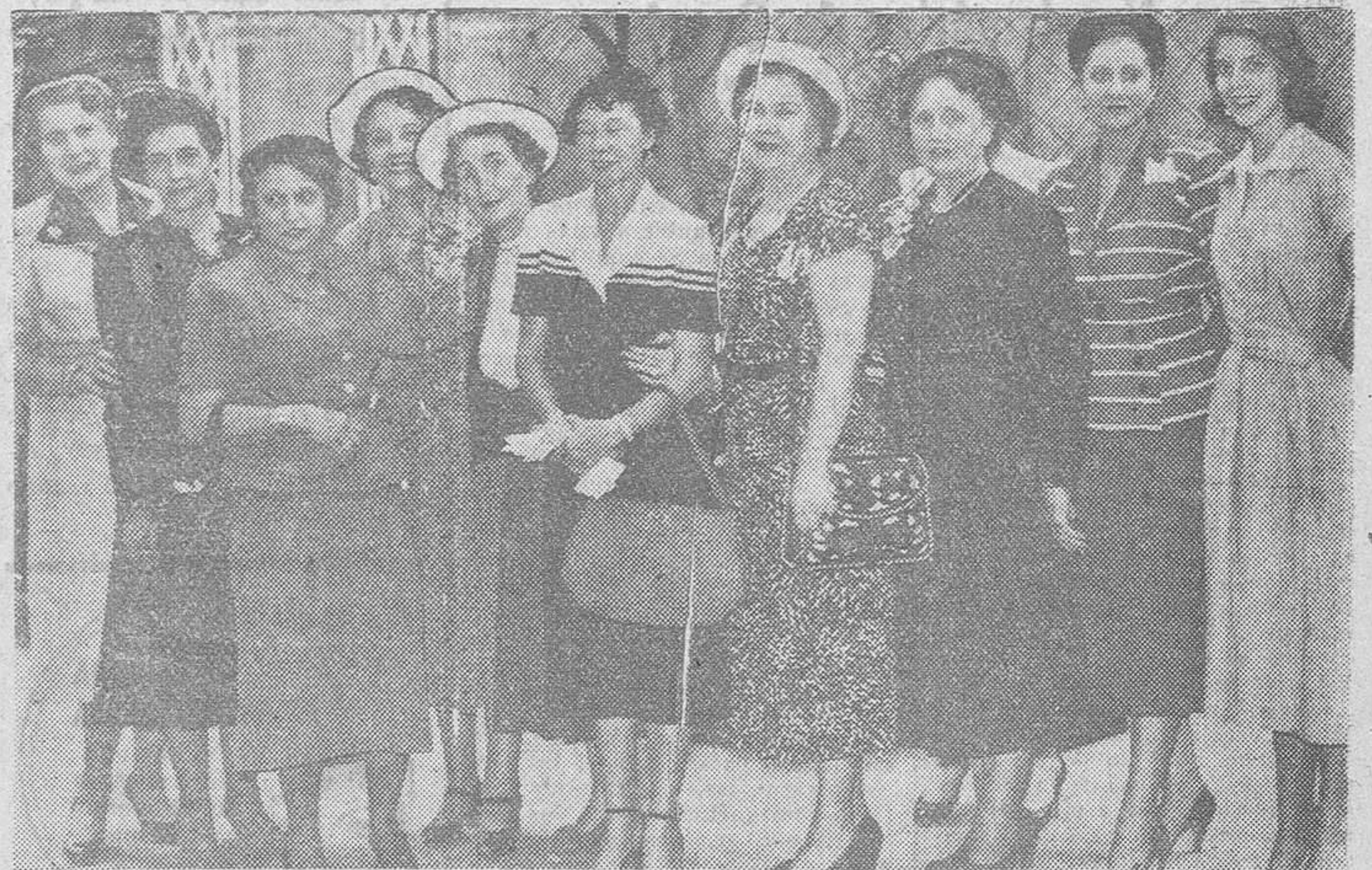
Grupo de damas norteamericanas, representantes de diversas asociaciones, que, de viaje por Europa, llegaron ayer a Barcelona

Nueva York, 12. — Alejandro Kerensky, jefe del Gobierno provisional ruso en 1917 y residente desde hace muchos años en los Estados Unidos, ha salido, en avión para la Alemania Occidental, donde quiere coordinar las actividades de los diversos grupos de emigrados rusos en la Europa del Oeste y lograr la creación de un centro de actividades antisoviéticas.