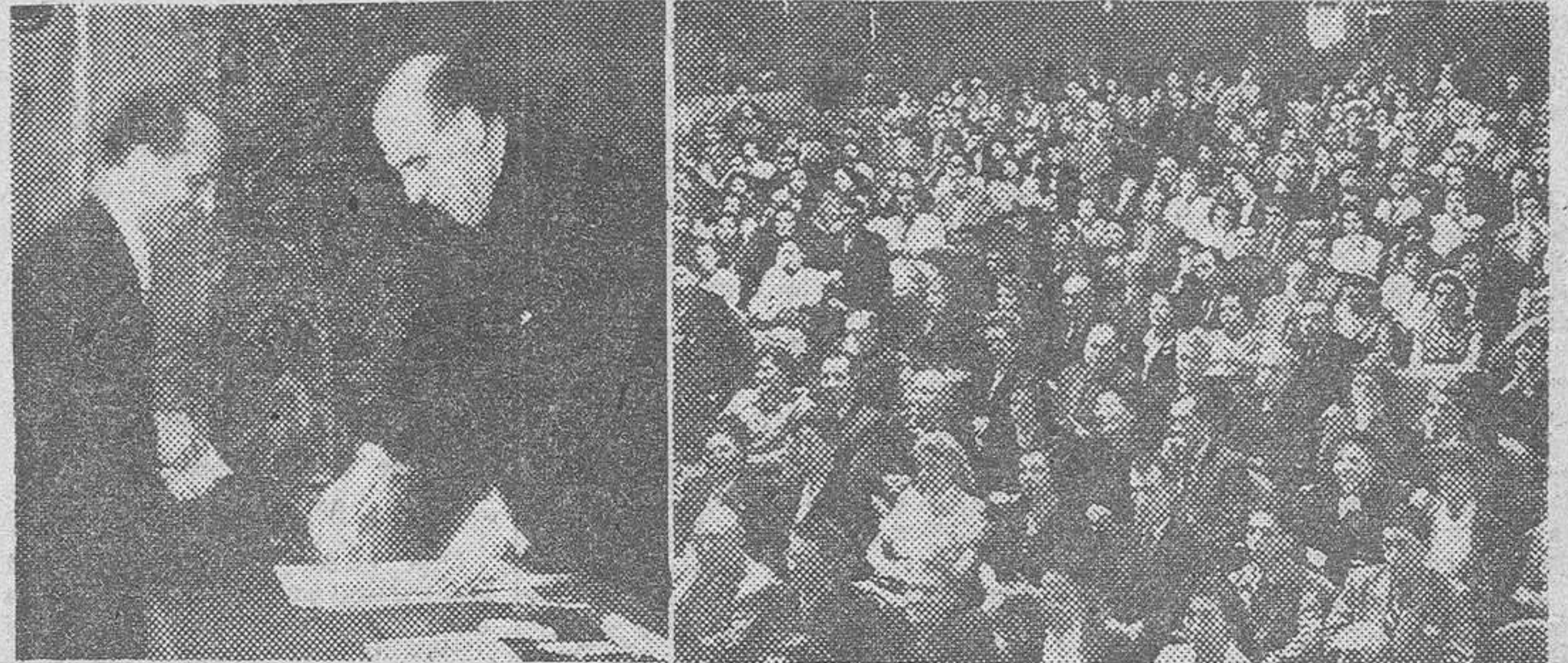
El Gobernador civil entregando uno de los premios, y aspecto de la platea del Teatro Barcelona.