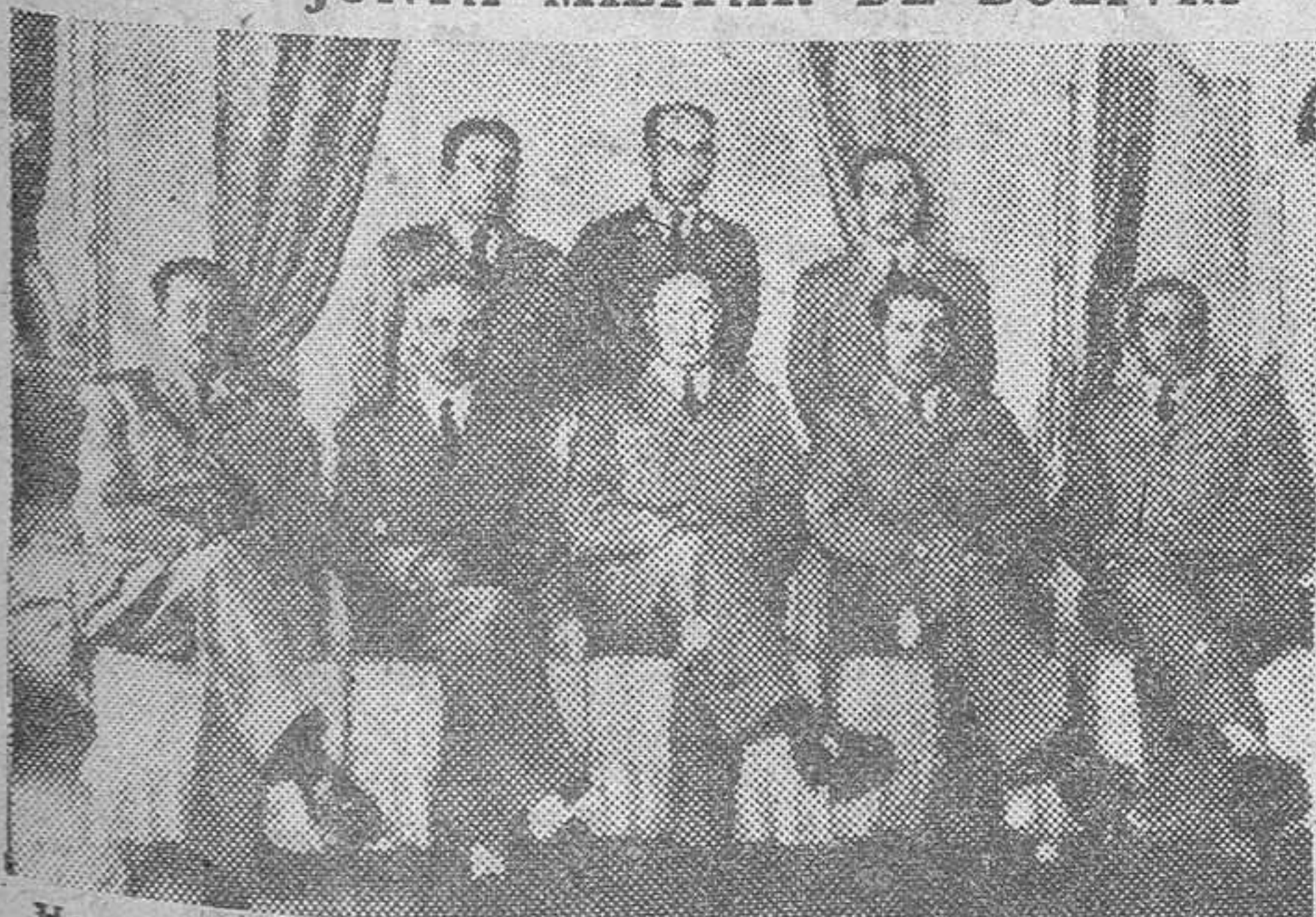
He aquí la nueva Junta Militar de Bolivia. En el centro, el Presidente, General Hugo Ballivián.