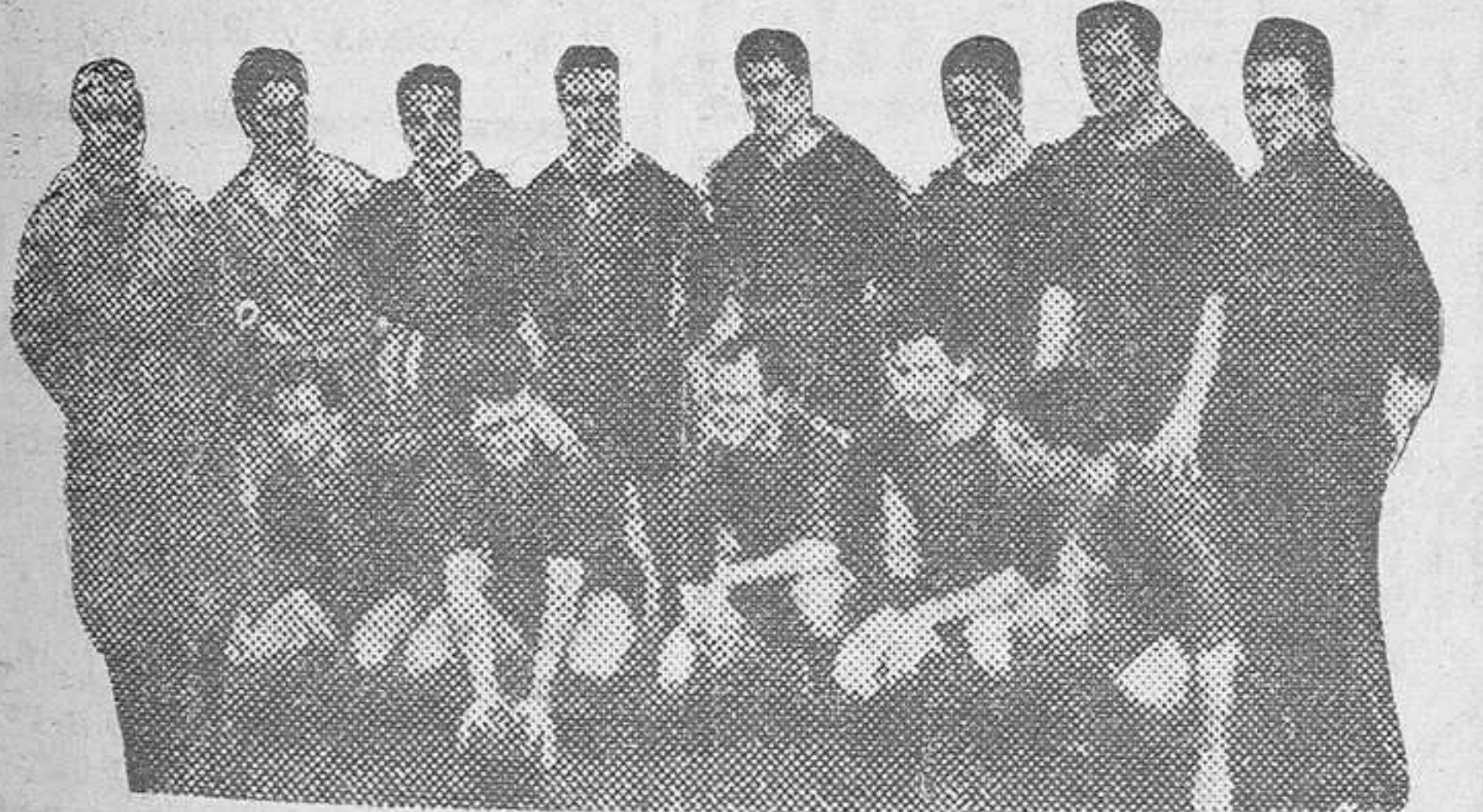
El once del Barcelona que se adjudicó la Copa de S. E. el Generalísimo