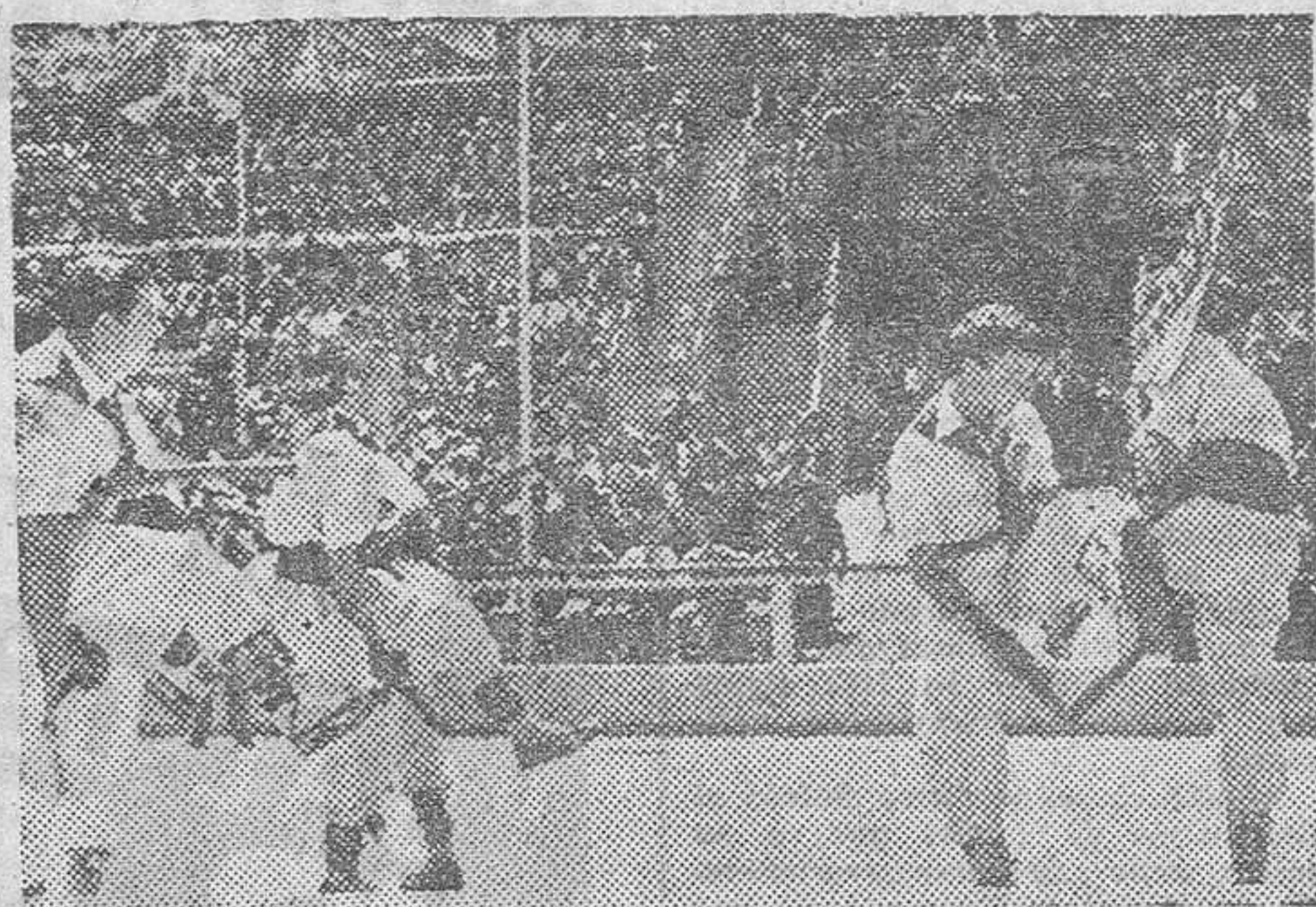
Un momento del festival folklórico, celebrado por el Frente de Juventudes.

Tomaron asiento en el presbiterio el Teniente Coronel Ozalla, en representación de la Autoridad mi-