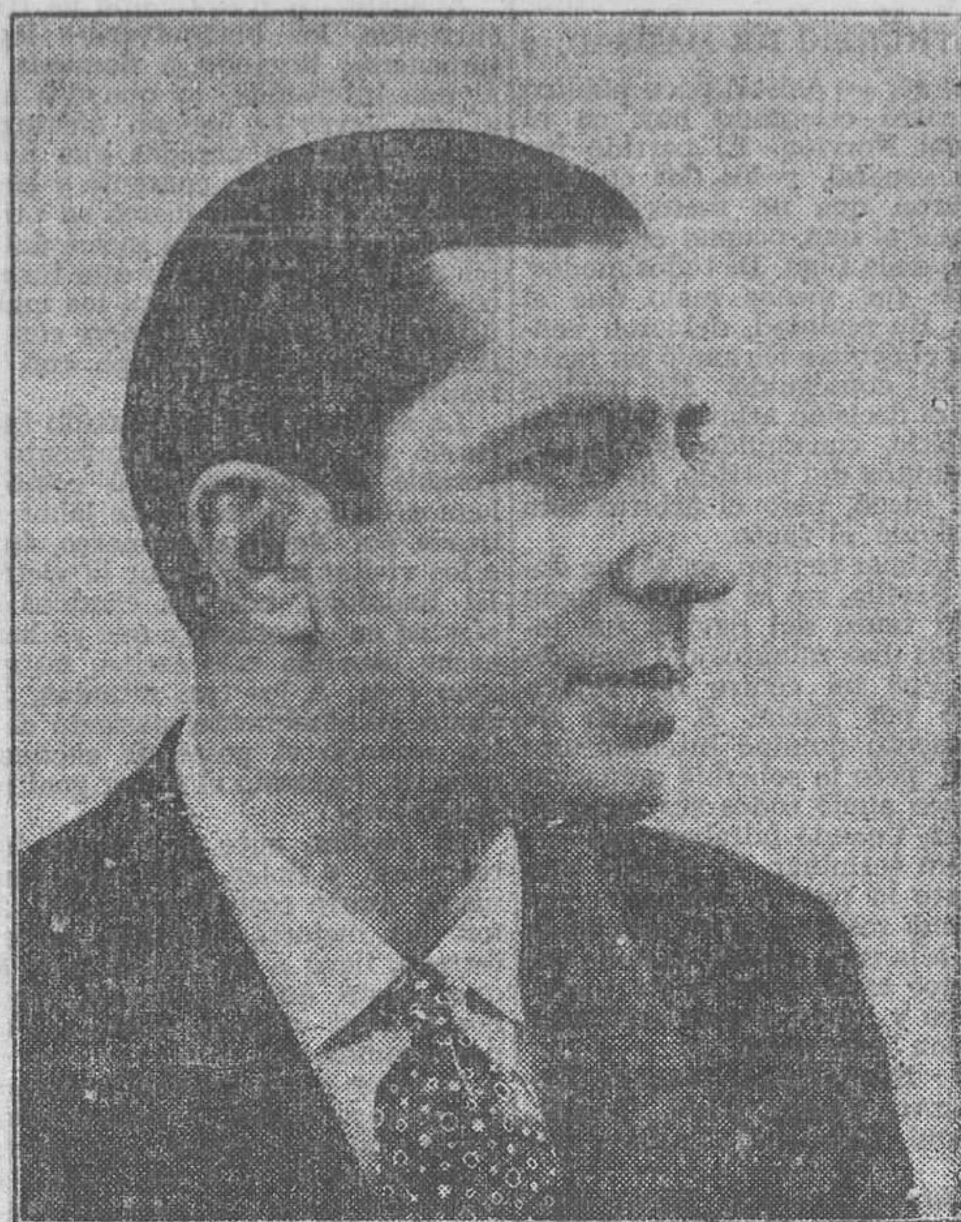
CARLOS GARDEL, el malogrado artista cuya última producción TANGO BAR, se estrenará hoy, lunes, en Coliseum