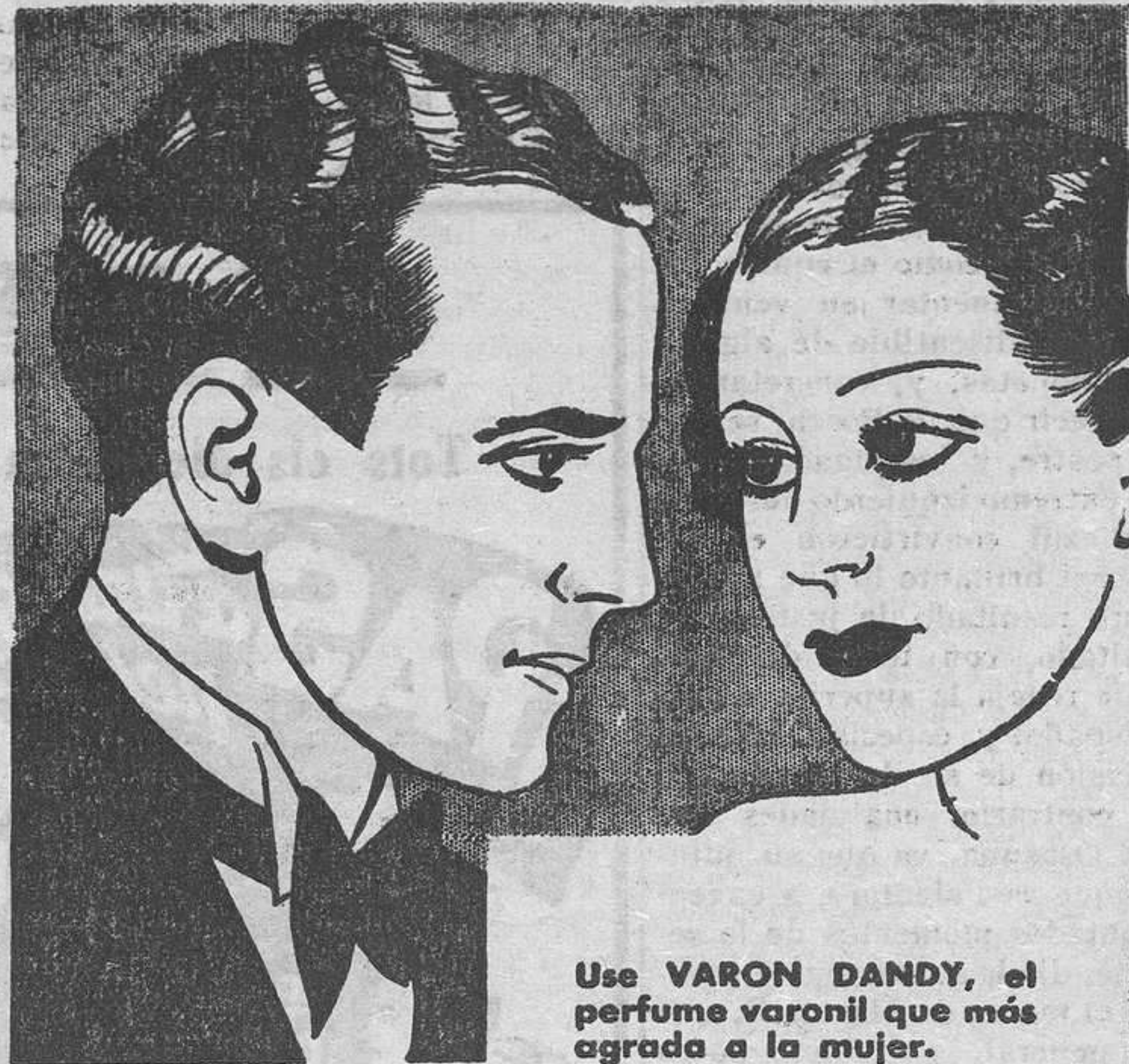
Use VARON DANDY, el perfume varonil que más agrada a la mujer.

Ha arbitrado regularmente Menal y los equipos eran: Calella: Zamora, Miró, Colomer, Alcoriza, Monzoni, Vilanova, Corominas, Salto, Co-