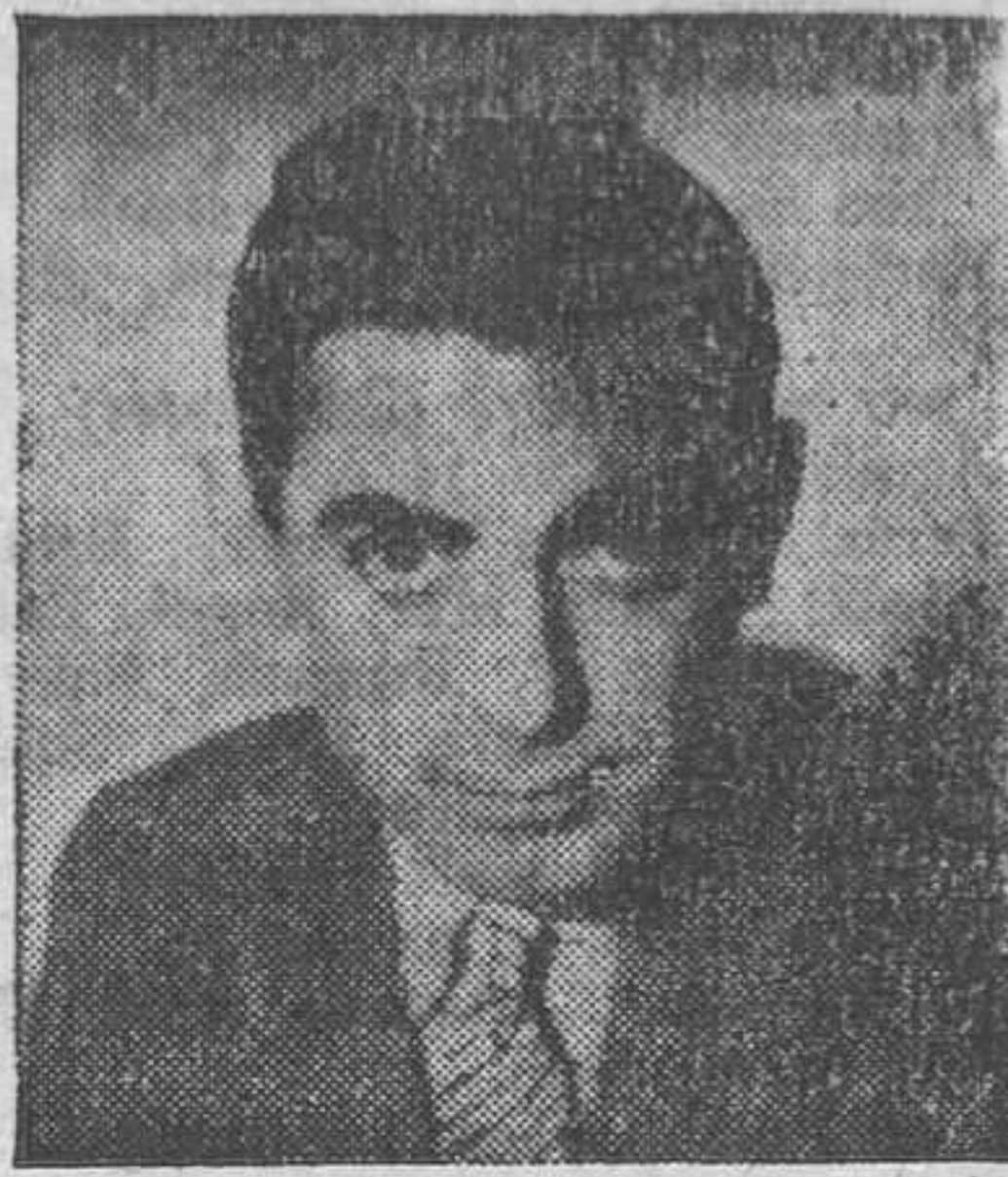
Eddie Cantor protagonista del film EL CHICO MILLONARIO, que esta noche se estrena en el Coliseum

En Estrictamente confidencial , Capra une de nuevo a dos estrellas de gran cartel, Warner Baxter y Myrna Loy, y las dos triunfan plenamente.